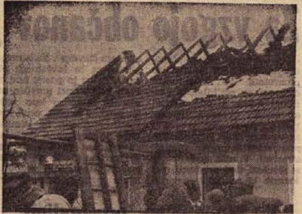
Ožgano ostreže Moretovo hiše opozarja, da previdnosti ni nikoli dovolj (k vesti v današnji NOVOMEŠKI KRONIKI)

sebnih sestavkih) in sprejeli ustrezna priporočila. V zadnjem delu dnevnega reda so sprejeli predlog, da se odobrijo omenjenemu podjetju investicijska sredstva v znesku 7 milijonov 500 tisoč din. Ta znesek bo podjetje uporabilo za dograditev poslovnih prostorov in za povečanje obratnih sredstev, proizvodnja pa bo nato za približno 200 odst. večja kot letos. Odobreni kredit so označili kot sanacijski, ker bi »Dolenjka« brez njega zšla v nepremostljive težave.