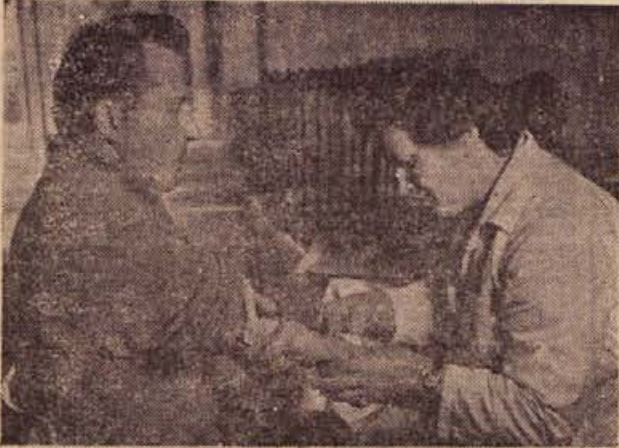
Izredno lep uspeh je dosegla letošnja krvodajalska akcija tudi v brežiški občini. Na sliki: odvzem krvi za pregled pred oddajo