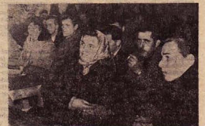
Takole je bilo v ponedeljek zvečer na Mirni

Razprava je bila dokaj razgibana. Poznalo se je, da Mirenčani vedo kako bi bilo treba postaviti to in ono, sami pa so tudi povedali, da bi