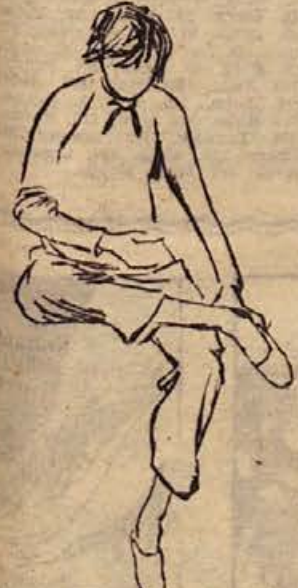
Miro Kugler: MACA (1962, litografija)

izobraževanju, niti ne pri fizičnem delu. Ne po njihovi lastni krivdi, pač pa mnogokrat po krivdi staršev in družbe morajo opravljati najtežja fizična dela tam, kamor še ni posegel stroj in druga mehanizacija. Ko pa bodo še nadaljnja delovna področja avtomatizirana in mehanizir-