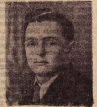
16. ure. Ves prosti čas porabim za gradnjo hiše. Zelim, da bi hišo čimprej dogradil.»

na to vprašanje. Prostege časa imam zelo malo. Službo nastopim že zgodaj jutraj in delam skoraj vsak dan do