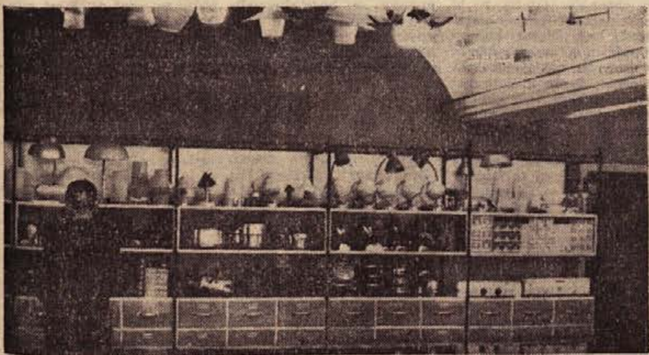
Bogata izbira v trgovini ELEKTROTEHNE v Novem mestu kaže pot naši trgovini: specializirane prodajalne nujno potrebujemo zaradi vedno večje kupne moči prebivalstva in vedno novih potreb v razširjenem blagovnem prometu