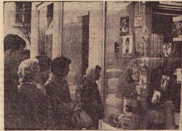
Pred izlozbnimi preurejene prodajalne ELEKTROTEHNE na Glavnem trgu je vedno dovolj občudovalcev in kupcev: bogata izbira blaga vabi! Zdej ne bo treba po vsako gramofonsko ploščo, žarnico ali varovalko v Ljubljano ali Zagreb...