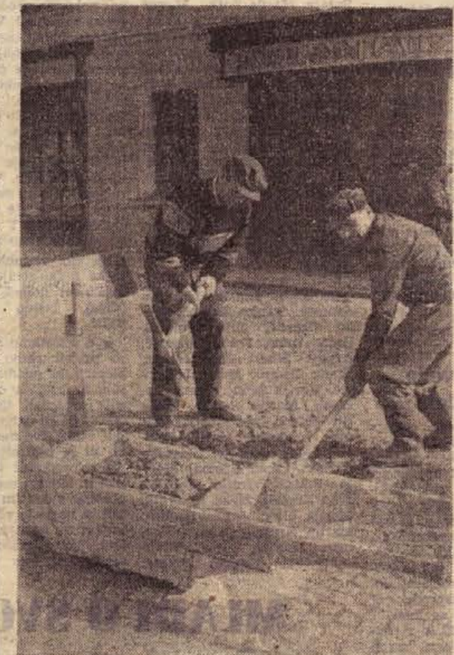
Na majhnem gradbišču v Novem mestu — a seveda pred zadnjim oz. »prvim« snegom...

Italijanska skupščina je z veliko večino sprejela vladni predlog o nacionalizaciji industrije električne energije. Zakonski osnutek mora sprejeti še senat. Nacionalizacija energetske industrije je ena glavnih točk v programu vlade premiera Fanfanija. Proti predlogu so glasovali liberalci, monarhisti in neofašisti.