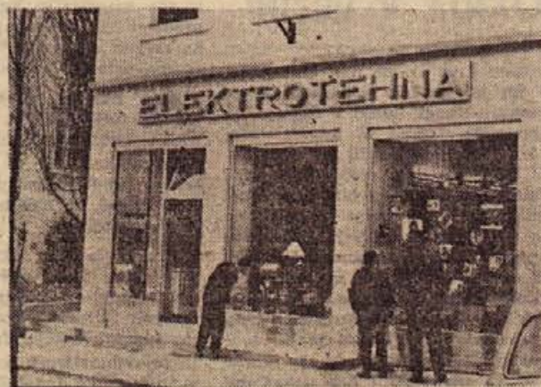
V soboto dopoldne je podjetje ELEKTROTEHNA iz Ljubljane odprlo na novomeškem Glavnem trgu svojo 4. prodajalno: specializirano trgovino z bogato izbiro elektrotehničnega materiala, televizijskih in radijskih sprejemnikov, gospodinjstkih ter drugih aparatov. Več o tem berite na 3. strani današnje številke!