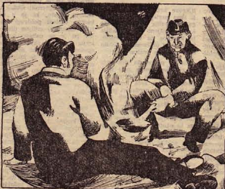
29. Njuno prenočišče je bilo borno. Nečaka sta pobrala skoro vse. Večerjo sta si skuhala v dveh že napol razhitih piskrih. Rzepela sta oguljeno ponjavo in se zavila v odejo. Ko je stric zaspal, je šel kriš k iskanecem zlata, ki so se znašli svoje stvari ali pa tesali in zbijali čolne.

KRISTOF DIMAČEV PRIREDIL: Stanko Simenc RIŠE: Janez Gruden