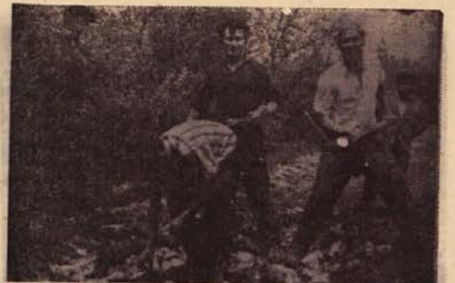
Mladina iz Stranske vasi tudi ob nedeljah ne počiva. Prejšnjo nedeljo se je urejanju poti zbralo 15 mladincev, ki so pomagali starejšim. Razen tega se udeležujejo v gasilstvu in na drugih področjih družbenega življenja (Franc Plantan ml.)