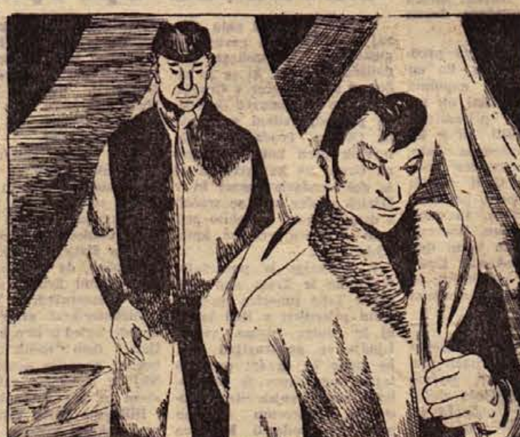
30. »Srečno pot!« je po zajtrku rekel stricu. »Cemu bi se vračal, ko sem že tako daleč? Dobil sem delo.« je rekel in zamahnil z roko proti šotorom. »Vlekel bom 150 na mesec in hrano povrhu. Grem v Dawson, O'Hara in VAL« pa naj vrag vzame!« Stric je bil osupel. »No, ta je pa dobro!« je izjavil.