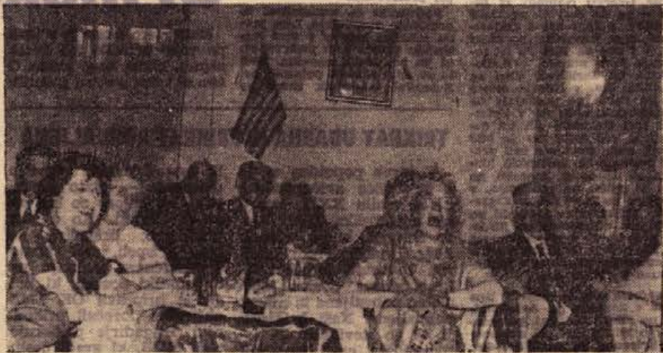
Vse je bilo dobre volje, na uspelem pikniku, skupna želja pa je: prihodnje leto spet na svidenje na prelepem Otočcu!