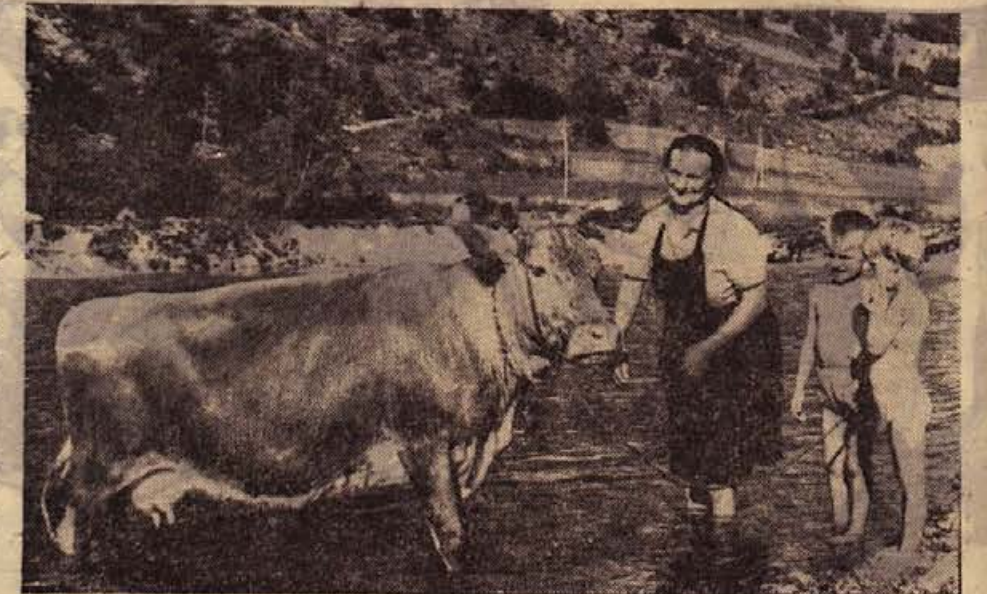
»Če se lahko ljudje ohladijo v vodi, se lahko naša Liska tudi!« je dejala Požgajeva mama iz Adlešičev, ko je prišla s kravico in otroci v strugo Kolpe in tam skrtčila pridno mlekarico...

Lansko jesen so se res začele priprave za izvedbo teh del. Ljudje so obljubili izdatno pomoč s prostovoljnimi delom in prevozi. Iz članov SZDL in krajevnega odbora sestavljeni odbor je kmalu za-