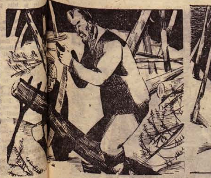
31. Neprenehno pihal močan jezerski veter. Videti je bilo, kako so se ki so jih zgradile nevesne roke. Deske v Dawson, O'Hara in VAL« pa naj vrag vzame!« Stric je bil osupel. »No, ta je pa dobro!« je izjavil.