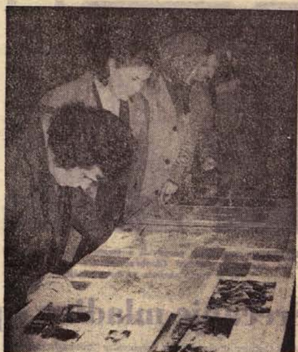
3. julija zvečer so odprli v dvorani brestaniške elektrarne razstavo o potujočevanju in preseljevanju, ki je vzbudila veliko zanimanja med domačini in gosti. Pripravil jo je Posavski muzej iz Brezic

primer kupijo po 65.500 din, prodajajo pa ga po 75.000 din, torej za 9500 din dražje. Od te razlike v ceni odvedejo občini 4300 din v obliki občinskega prometnega davka. Ta odvod pa tudi sicer predstavlja povprečno 30 do 35 odstotkov marže v njihovi prodaji. S preostankom zaslužka pa mora trgovina plačati prevoze blaga, razsvetljavo in najemnine, stroške poslovanja, osebne dohodeke in ustvarjati sklade. Zelezina plačuje na primer vsak mesec 495.000 din najemnin za lokale in skladišča, ki jih uporablja (za 600 kv. m skladiščne prostora v novih skladiščih v Bršlinu 388.000 din na mesec - mar je res potrebno, da se skladišče, ki ga je zgradila občina, v celoti amortizira z najemninami že v petih letih, v breme potrošnika in trgovine?). Razlike v cenah, pravimo jim tudi zaslužek, pribitek ali marža, plačuje potrošnik. Upravičen je torej vprašati, kam gre do te razlike, in dobiti odgovor na svoje vprašanje. Le z odkritimi odgovori bomo odpravljali večkrat neosnovano, toda precej razširjeno mišljenje o lovu za dobičkarstvom v trgovini, hkrati pa bomo z javno razpravo in v vprašanju potrošnikov odpravili tudi mnoge napake, ki jih brez dvoma tudi v naši trgovini ne manjka.