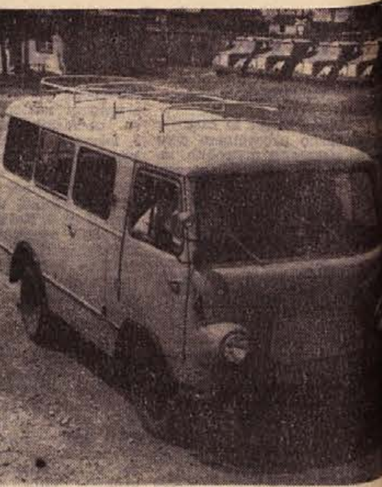
KOMBİ BUS »TAM 2000«, 12 sedežev, eden najnovjših avtomobilov TAM