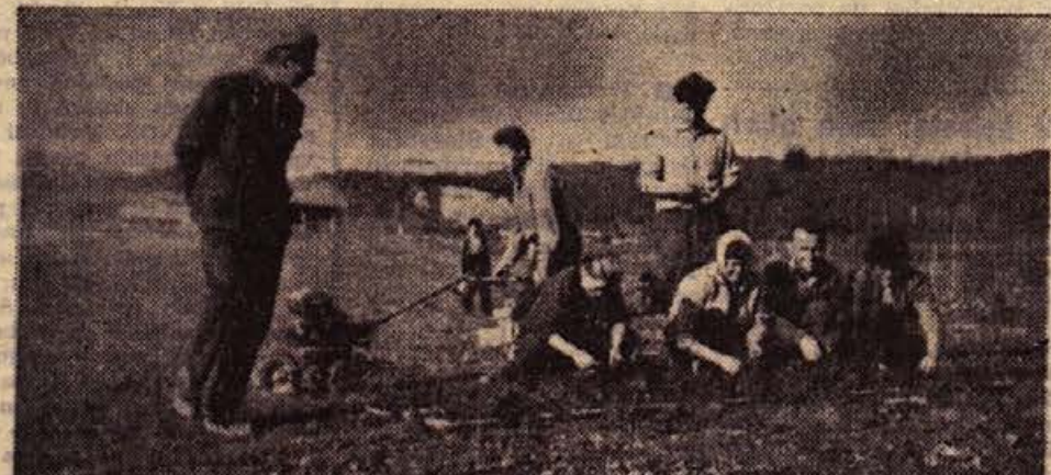
S pomočjo strojev gre delo veliko hitreje izpod rok tudi v drevesnicah

■ Pred kratkim je začela obratovati v trboveljski cementarni nova, 80 m dolga rotorna peč. Ta peč bo omogočala, da bodo v tovarni proizvedli 100.000 ton cementa ali 70.000 ton več kot doslej.