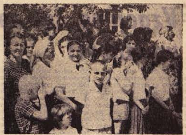
V nedeljo popoldne v Adlešičih: vsa vas se je zbrala na otvoritev novega šolskega igrišča, saj so tudi vsi pomagali! Veselje je bilo pogledati ponosne in zadovoljne starše ter njihovo razigrano mladež