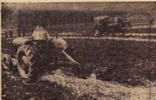
KZ v Crnomlju ima že 20 traktorjev. Društvo kmetijskih strojnikov je pred kratkim organiziralo tekmovanje traktoristov Bele krajine v Dragatušu, kjer smo videli lep napredek naših kmetijskih delavcev

Občinska komisija za usklajevanje delitve čistega dohodka in osebnih dohodkov je obiskala že vse kolektive. Predpisane podatke so dobro zbrali in pripravili pred njenim prihodom v Belsadu, Zori, Beltu, rudniku Kanžarica, v Liču, Begradu in v Splošnem trgovskem podjetju, drugod pa so čakali na komisijo več ali manj nepripravljeno. Največ odstopanj in nesorazmerij med delitvijo in doseženimi uspehi ter gospodarskimi načeli novega sistema je bilo ugotovljenih v zavodih. V komunalni banki so se osebni dohodki neupravičeno povečali, vendar so jih znižali že pred prihodom komisije in pravilnik popravili ter pri izplačilih za maj prejemke že znižali. Neupravičeno visoke osebne dohodke so imeli tudi v novem Zavodu za zaposlovanje, pa tudi v Zdravstvenem domu osebni dohodki porasli predvsem na račun raznih dodatkov in dežurne službe, kar določa pravilnik.