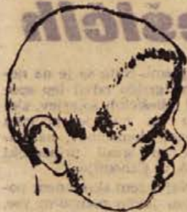
Miro Kugler: SINEK (1962, litografija)

Zc imate DOLENJSKI ZBORNIK, najnovejšo izdajo Dolenjske založbe? Cena 1500 din. Dobite ga v vseh knjigarnah.