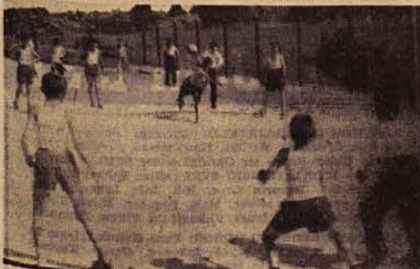
Za zaključek slovesnosti v Adlešičih so se v nedeljo pomerili še dečki na novem šolskem telovadišču s priljubljeno igro z žogo »Med dvema ognjema«. Zdej ni več strahu, da bi žoga padla v sosedovo pšenico ali kam v košato travo...

Danes ob 9. uri se je v Domu TVD Partizan na Loki pričelo okrajno šahovsko prvenstvo, na katerem ima pravico nastopati 16 najboljših mladincev iz Novega mesta, Brežic, Vidna-Krškega, Senovega, Sevnice, Krmelja, Trebnjega, Smibelca, Stople in Črnomlja. Po švicarskem sistemu bodo odigrali 7 kol. Prvak bo zastopal naš okraj na republiškem prvenstvu. Turnir bo zaključen v nedeljo dopoldne. Igrali pa bodo vsak dan od 8. do 12. in od 16. do 20. ure.