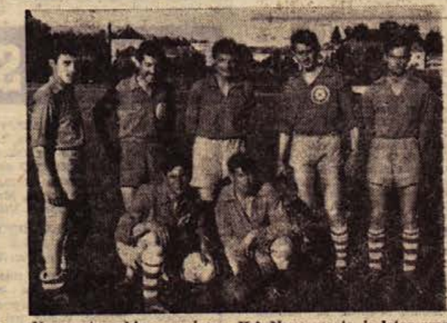
Nogometna ekipa garnizona JLA Novo mesto je letos zmagala na tradicionalnem turnirju v malem nogometu