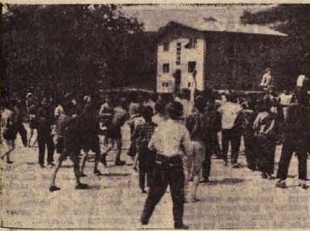
Na Raki je 410 šolskih otrok in 50 predšolskih nadebudnežev. V kraju pa ni bilo otroškega igrišča, kamor bi otroci lahko zahajali. Zato je društvo prijateljev mladine s pomočjo šolarjev zgradilo novo igrišče, ki je bilo dograjeno 25. maja. Tu se zdaj mladina z Rake in okolice že veselo igra. V ozadju 4-stanovanjski blok, v katerem stanuje kar 10 učiteljev; stavba je bila dograjena pred nekaj meseci.

Alkohol je smrtni sovražnik reda in varnosti na cestah!