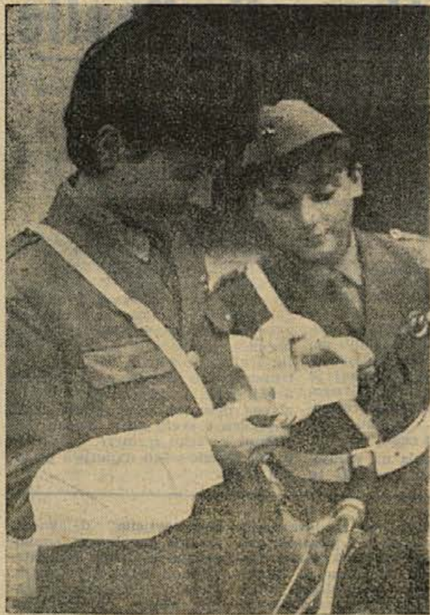
Kdo ve, če je to vozniško dovoljenje v redu? No, mlada črnomaljska prometna miličnika bosta to hitro ugotovila, kaj več pa preberite o najmlajših prometnikih Bele krajine na 10. strani današnje številke

O CEM SO RAZPRAVLJALI GLANI ZBORA PROIZVAJALCEV OLO NOVO MESTO