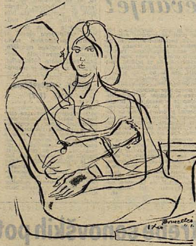
Vlado Lamut: ILUSTRACIJA (Bruxelles, 1960)