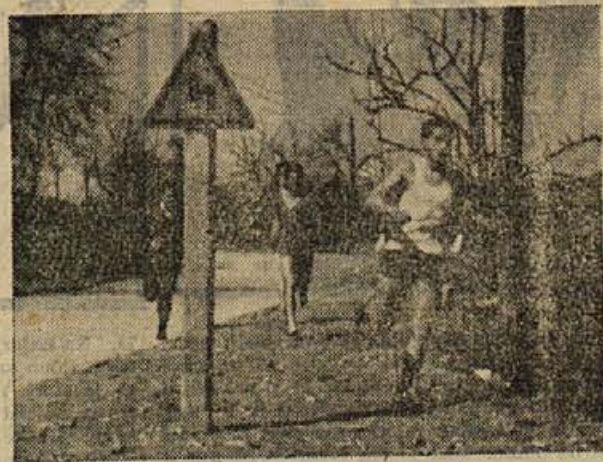
Prizor z občinskega prvenstva v krosu v Metliki

Tako bo Metlika dobila še eno avtobusno progo. Celotna proga je dolga okoli 80 km in podjetje »Gorjanci« upa, da bo rentabilna. Progo bodo uvedli s 1. majem. Avtobus bo vozil samo ob delavnikih. Proga bo prve tri mesece obratovala poskusno.