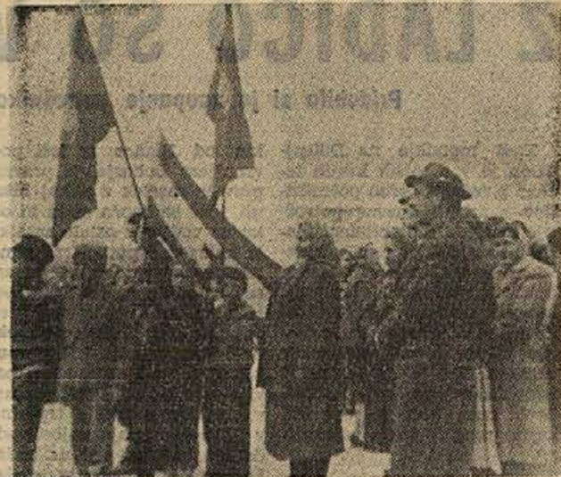
Štacija mladosti s Trebelnega se je ustavila tudi pred spomenikom v Šentrupertu, kjer se je 9. aprila popoldne zbrala množica ljudi, ki so poslali pozdrave predsedniku Titu ob njegovi 70-letnici.