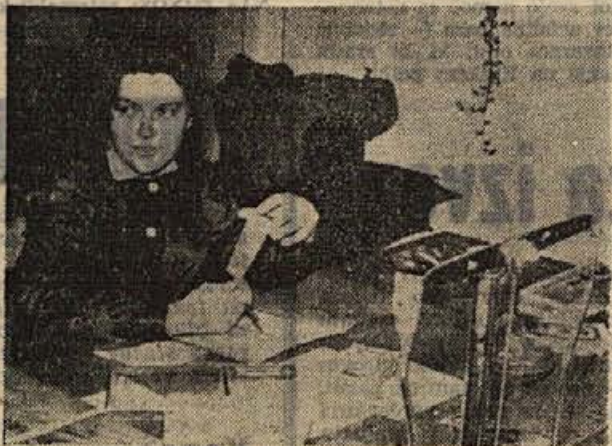
Mnoga dekleta se z veseljem odločijo za zaupno in odgovorno delo na pošti, ki zahteva od človeka predvsem natančnost in smisel za red ter hitro poslovanje

To je le nekaj primerov, le nekaj tožb, ki smo jih našli med devet sto petindvaj-