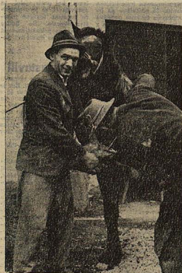
Konjiček je prišel v zrelostno dobo. Njegov gospodar ga je pripeljal v Semič, da mu bo kovač semiškega obrtnega servisa pribil prve podkve