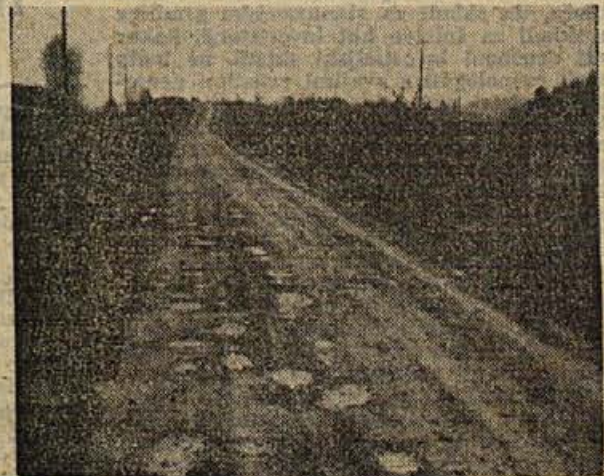
Takšna cestišča, kot je to na sliki, so pri nas kaj pogost pojav. Marsikatera kletvica uide voznikom na račun kotanjstih cest, pa tudi škoda na vozilih je precejšnja. Cestno podjetje Novo mesto, ki se razen s cestami ukvarja tudi z vsemi nizkimi gradnjami, pripravlja obsežen načrt za modernizacijo naših cest. Več o tem berite na 2. strani današnje številke.

Omenili smo že, da pošilja zavodu poročila blizu 800 enot. Poseben problem so roki, do katerih bi morala biti poročila dostavljena, saj jih upošteva le majhno število podjetij. Največ težav pa povzroča malomarno poročanje. Približno 60 odst. poročil pride na zavod nepopolnih, bodisi takšnih, da ne vsebujejo vseh zahtevanih podatkov, bodisi da so podatki netočni. To velja posebno za kontrolne seštevke, katerim marsikje posvečajo zelo malo pozornosti, saj vpisujejo številke skoraj tako, kot bi jih pobirali po tleh. Kakšne so težave, če pride od 800 poročil le 320 točnih in kar 480 takšnih, ki jih je treba popravljati, si najbrž ni težko predstavljati. Mnogo časa in dela porabijo v zavodu za krpanje malomarno sestavljenih poročil, zato je prav, če se vsi, ki poročila sestavljajo, malo zamislijo in jih odslej vestneje sestavljajo! Statistika je žal še vedno slaba plat našega sistema, takšna pa bo ostala, dokler je ne bomo bolj upoštevali kot doslej!