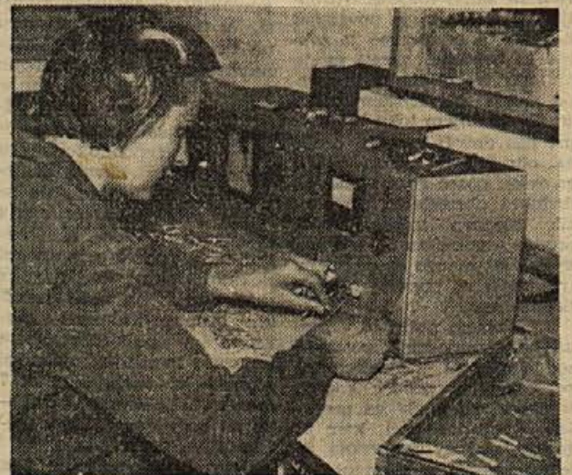
Delo v industriji elektrozvez — v okraju imamo več obratov IEV oz. ISKRE — zahteva mirno roko in dober vid

Na tem mestu je treba izreči priznanje vsem nosilcem letošnje štafete mladosti, zlasti še učencem osnovne šole na Dvoru, v Vavti vasi in Loki, kakor tudi pripadnikom JLA in vsem godbenikom. Bili so požrtvovalni. — Vsem hvala!