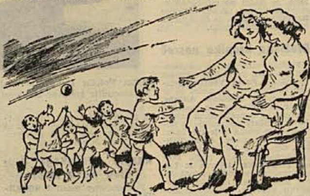
Kmalu bodo lahko spet na tratah — toda ali imajo naši najmlajši povsod tudi primerne prostore za izživljanje?

V vrtcu imajo tri vzgojiteljice in nekateri otroci ostanejo tam do tih popoldne, ko se njihovi starši vrnejo z dela. Mesečna oskrba s prehrano je 3.000 dinarjev, za otroke, ki v vrtcu ne jedo, pa plačujejo starši 800 din mesečno. To ni pretirana cena. Otrokom je hrana v vrtcu všeč in tudi tisti, ki so doma izbirčni, tu pozabijo na to. Kako tudi ne bi, ko v kuhinji večkrat tako prijetno diši po palačinkah kot onega dne? —db