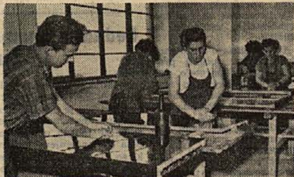
Iz brežiške tovarne pohišva