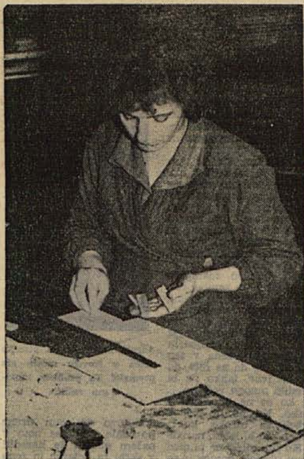
Pri sestavljanju »lamel« parketa v straškem obratu NOVOLESA

Ze sama stavba »Konfekcije Lisca« daje Sevnici lepo podobo. V tem podjetju je zaposlenih 167 žena, ki ustvarjajo letno blizu pol milijarde bruto dohodka. Zene se udeležujejo v delavskem svetu, upravnem odboru, sindikalni podružnici, mladinski organizaciji, organizaciji ZK in v osmih obračunskih enotah. Izkazale so se ne samo kot dobre proizvajalke, temveč tudi upravljavke. Sicer pa je najbolje, da prislunemo kar izjavam samih žena.