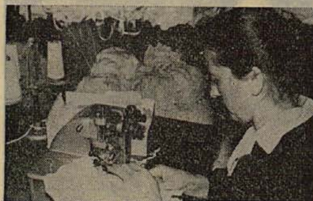
V pletiljskih, konfekcijskih in šiviljskih delavnicah v okraju je zaposlenih zdaj veliko število žena, ki so bile prej brez samostojnih dohodkov

● In kakšen naj bo zaključek? Z izjemo nekaterih izboljšav se pojavljajo že stare ugotovitve: še vse premalo je skrbi za neposrednega proizvajalca. Razveseljivo pa je, da so probleme varnosti na delovnem mestu začeli obravnavati delovni kolektivi sami, da komisije, ki so jih organi samoupravljanja izvolili v ta namen, ponekod prav uspešno delajo. Napredek je, čeprav marsikje manj opazen, pa naj gre za stanje v novomeški občini ali v okraju.