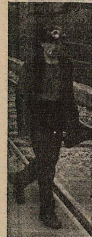
Za danes bo dovolj...

Da bi izkoristila zimski čas, je kmetijska zadruga v Sevnici organizirala strojno-traktorski tečaj. Razen strokovnih predmetov bi tečajnikom lahko posredovali tudi nekaj politične vzgoje, ki se na teh tečajih zanemarja. Delavska univerza je pripravljena nuditi pomoč.