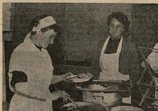
Kdo jim nagaja, da delavci niso zadovoljni z enolončnicami? V obratu družbene prehrane na Vidmu se resnično trudijo, da bi zadovoljili potrebe vseh svojih odjemalcev!

Naj bo kar koli, delovnemu človeku smo dolžni nuditi topel obrok hrane. Glavne razloge spora okoli enolončnic pa je potrebno takoj poiskati in jih odpraviti. 29. januarja je o problemu enolončnic že razpravljala seji občinski odbor SZDL. O tem pa bi morali še temeljiteje razpravljati predvsem tudi prizadeti!