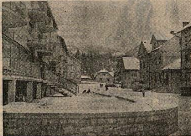
Danes v novem Senovem