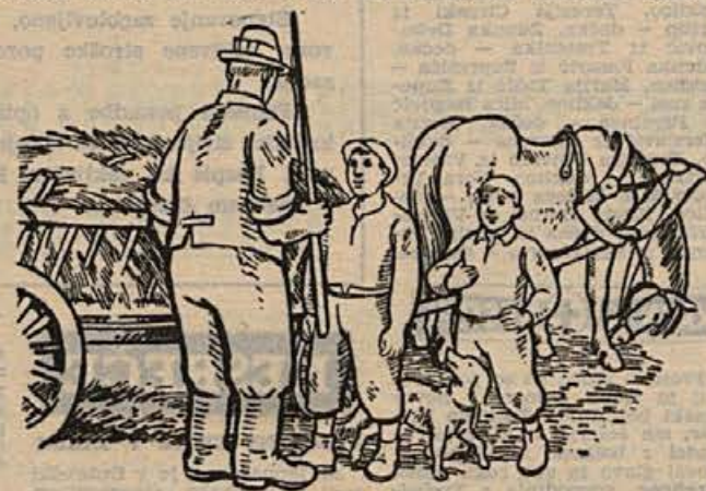
»Tako, fanta: ko bosta napisala naloge in se naučila vsega za jutrišnji dan, pa pridita za nami na travnik! Malo telovadbe pri grabljenju sena ne bo škodovalo...« — Pametna zaposlitev otrok je vzgojna, vsako pretiravanje pa močno škodljivo!

mora biti tako, da ga spravljajo v doro voljo in da si ob njem lahko tudi kaj zapoje. Le tako bo delo vzljubil in se ga veselil. Še sčasoma bo lahko sprejel tudi težje naloge, ki jim bo njegov organizem kos.