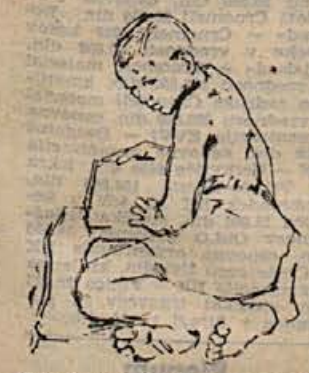
BOGDAN BORGIC: Deček

V veliko kritike je bilo izrečeno na račun spomenika