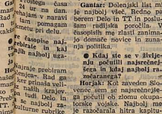
Upokojenec Karel Gantar: »Cene naj bi mirovale!«