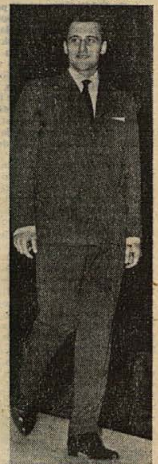
Manekeni so tudi tokrat prikazali vrsto odličnih NOVO-TEKSOVIH kamarnov za moške obleke na Sejmu mode 1962