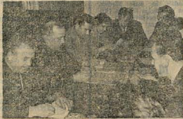
Občinska komisija za tisk in dopisniki iz brežiške občine so se sestali v pelek dopoldne. Vsebinska posveta: dopisovanje v novo komunsko glasilo, ki naj postane ogledalo razmer, potreb in dogodkov v občini

pravljeno, pa smo naleleti na nerazumevanje in na ugovor, da obrat ne bo donosen. Morda smo bili malo premalo vztrajni, kdo ve? To napako, ki je za naše mesto značilna, bomo odpravili samo, če bodo člani Socialistične zveze v bodoče bolj podpirali delo stanovanjske skupnosti in manj čakali, da bi kaj zrastle samo od sebe. Dobro bi bilo tudi, ko bi bilo pri pristojnih organih za take stvari več razumevanja kot doslej!