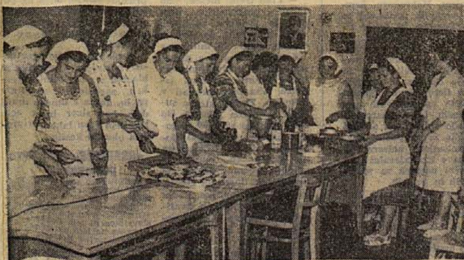
Lani je okrajni zavod za napredek gospodinjstva organiziral vrsto strokovnih tečajev za dokvalifikacijo delavk v gospodinskih poklicih. Na sliki: tečaj kuharic šolskih kuhinj, ki je dal mnogim ženam in dekletom znanje in prvo stopnjo strokovne izobrazbe za poklic »kuhar mlečne kuhinje«. — O nalogah novega Zavoda za napredek gostinstva in gospodinjstva berite na 11. strani današnje številke.

9. januarja so se zbrali na posvetovanje predsedniki in sekretarji občinskih odborov SZDL. Pogovorili so se o organizacijskih vprašanjih in o delu občinskih odborov SZDL. Naloge, ki čakajo Socialistično zvezo glede razlage in sprejema načel nove ustave in izdelovanja občinskih statuten, bodo terjale vsklajeno delo Socialistične zveze v okraju.