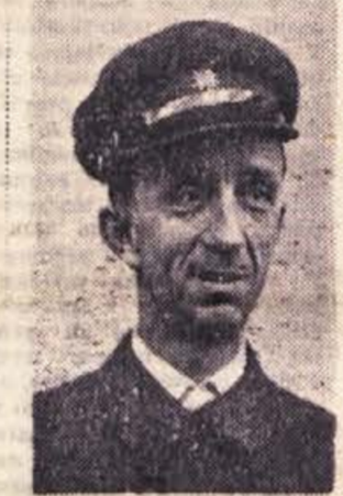
je zavil malce po viniški in nadaljeval: — Dozdam sem jih dobil 68. Vse vaši svojega dostavnega področja sem obšel že po dvakrat. Izdelal sem si načrt: vse domove moram obiskati in vsakomur pokazati Dolenjski list. To je vendar glasilo Socialistične zveze, o naših domačih krajih in zadevah piše, torej ga mora imeti vsaka

okostnjake in prišli do zanimivih zaključkov. Kaže, da so stari Slovani prva stotletja svojega življenja na Balkanu, to je od 8. do 12. stoletja, bili večji in bolj zdravi kot njihovi potomci v dobi razvitega feudalizma. To degeneracija je telesni konstrukcij pa je pospešil že prihod Turkov na Balkan v 14. stoletju. Ekonomska zaostalost, vojne, selitve, lakota in nasilje — vse to je na ljudeh pustilo globoke sledove. V drugi polovici prejšnjega stoletja pa se je začelo stanje boljati. Leta 1912, pred balkansko vojno, je bil srbski vojak po svoji višini na drugem mestu v Evropi, takoj za švedskim. Sele nekaj desetletij predtem so odrasli moški v Srbiji dosegli višino svojih davnih prednikov, pokopanih v Brestovniku — 168 cm.