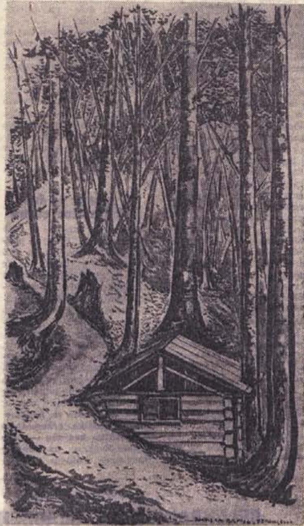
VLADO LAMUT: PO POTEH GORJANSKEGA BATALJONA — Bolnišnica v Pendirjevki (1961)