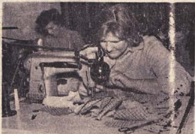
Pogled v konfekcijsko delavnico Zavoda za zaposlovanje invalidov v Metliki, kjer se ob 35 najosobnejših šivalnih strojih pod vodstvom obrtniških strokovnjakov priučujejo invalidi delu. Od tu gre prenekatera delavka kot enakovredna proizvajalka v redno proizvodnjo

Boja za obstanek, ki je občane spremljal vse do letos, ni več. Mlada industrija se je razmahnila, v domači komuni bo odslej dovolj kruha za vse, ki bodo hoteli delati. Vedno več ga bo. Prav to pa daje posebno slovesno obeležje letošnjemu občinskemu prazniku.