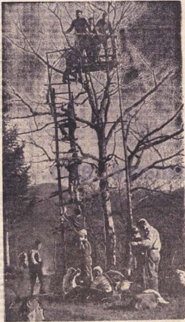
Tabornike poznamo navadno le po šotorih in kratkih hlačah, a vendarle se njihov delovni program razteza na vse leto. Tudi v mrzlih jesenskih in zimskih dneh jih srečate na pohodih in izletih, kjer se vadijo v taborniških veščinah in spretnostih. Na sliki: obisk lovske preže na nedeljskem sprehodu

Iz življenja in dela novomeških tabornikov