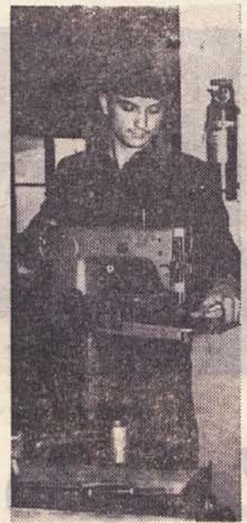
Po dokončanih rekonstrukcijah bo izdelovala Tovarna šivalnih strojev na MIRNI na leto po 20.000 strojev