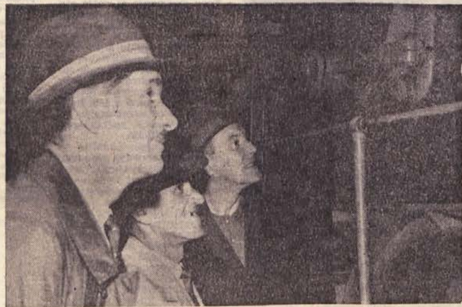
Tokrat je bila prvič uresničena pobuda, da bi bile seje-OLO v raznih krajih in ne le v Novem mestu. Tokrat so se odborniki sešli v Vidnu-Krškem. Po seji so si člani obeh okrajnih zborov z zanimanjem ogledali potek proizvodnje v tovarni papirja in celuloze na Vidnu. — Na sliki: odborniki ob proizvodnih napravah v tovarni papirja DJURO SALAJ

Ugotovili smo, da bomo morali 58 odst. sredstev za naložbe v gospodarstvu zbrati sami. Morda je to na prvi pogled videti malo in v nasprotju z decentralizacijo materialne osnove, saj nenehno poudarjamo, da jo prenašamo navzdol na komuno. Svoja sredstva pa bomo lahko znatno povečali, če bomo preudarno izkoristili možnosti, ki se nam ponujajo pri gradnji večjih objektov zaradi ugodnih mednarodnih kreditnih sporazumov. Za uvoz opreme z Vzhoda je podpi-