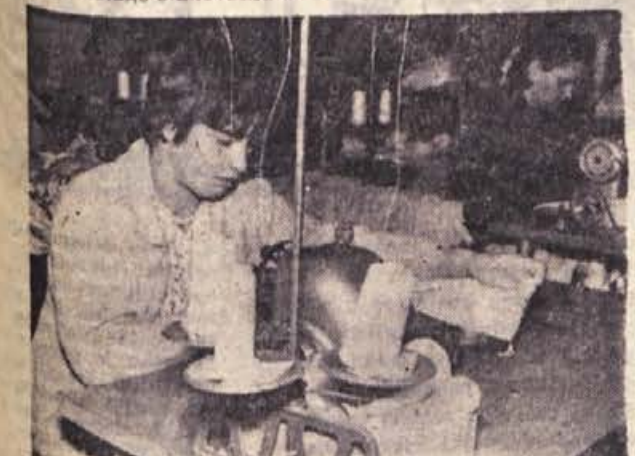
...ni stroj dobro tekla in da bo vzorec lep spleten, je treba nit natančno vstaviti in napeljati skozi mnogo ušesc in pretikov

Odpraviti je bilo treba pomanjkljivosti in obratu zagotoviti osnove za razvoj. Ni šlo lahko! Prostori so bili zaradi vedno novega dotoka delavcev kmalu premajhni. Stroji, ki so jih uporabljali v proizvodnji, so bili večinoma stari. Tehnološki proizvodni postopek je bil temu primerno zastarel, produktivnost dela pa majhna. Tudi v organizaciji nabavne in prodajne službe je bila vrsta napak. Proizvodnja pa je navzlic naštetim težavam naraščala in razmere na tržišču so se vedno bolj urejale. Trg je razen količine vedno bolj in bolj zahteval kvaliteto. Sodobna proizvodnja ni mogoča brez strokovnjakov. Mnogo težav je bilo treba premagati, preden so bila na razpolago stanovanja za-