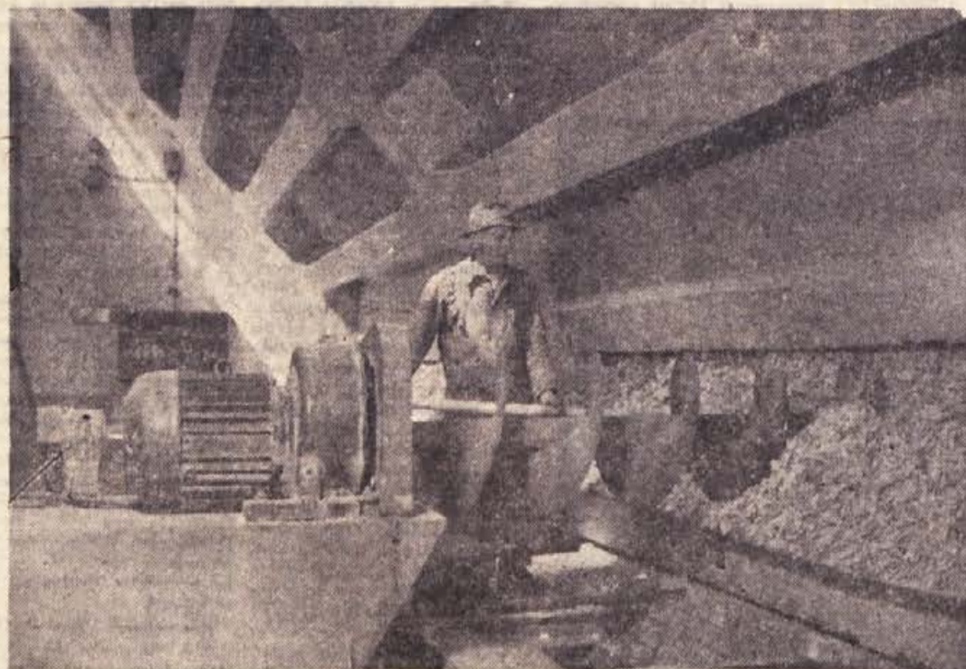
Iz kombinata — tovarne celuloze in papirja »DJURO SALAJ« v Vidmu-Krškem: pripravljeno sekanico potiska »polža« v nadaljnjo predelavo.