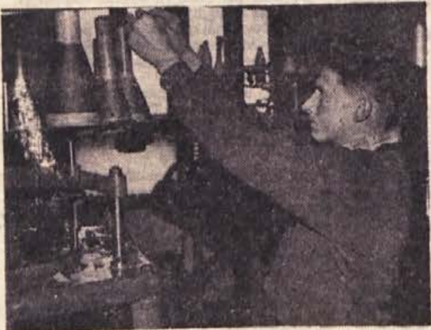
Preden je kos boljsega ženskega perila tak, kakršnega vam ponudijo v trgovini, je z njim precej dela. Čipke, ki nje-govo lepoto še bolj povzdignejo, je treba prišiti s strojem. Na sliki: pogled v oddelek konfekcije