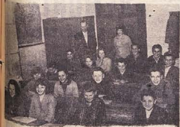
Skupina je oprema v šmarješki šoli in pretesni so pro- stori za vse, ki tu hrepene po znanju in učenju — pa vendarle so radi dobre volje in zdaj, ko so bili sprejeti v vrste LMS, bodo delali še z večjim veseljem. Vsi bodo tudi sodelovali pri zbiranju sredstev za nakup televizi- jnega sprejemnika, ki naj poži in razgiba družabnost v Smarjeti