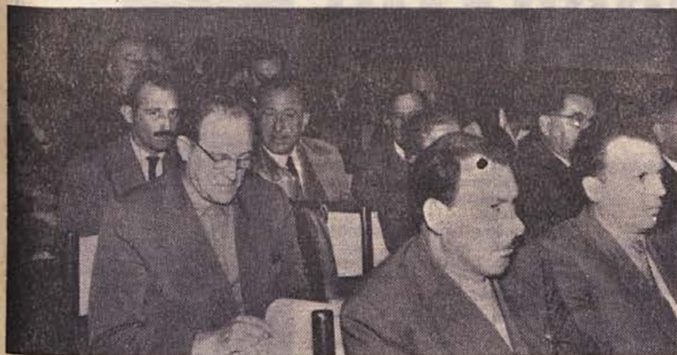
Med zadnjo sejo okrajnega ljudskega odbora