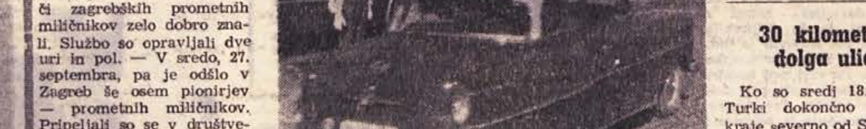
Sevniški pionir se ni ustrašil gostega prometa v Zagrebu: dobro ga je usmerjal in bil pohvaljen

Podmladkariji — miličnikih so 24. septembra odšli tudi na zagrebške ulice. Postavili so jih na najbolj prometna križišča, kjer prevozijo v eni uri več kot 2000 motornih vozil. Čeprav je bilo v času velesoja, ko je bil promet izredno živahen (naj povemo, da gresta čez vsako križišče vsaj dve tramvajski progi), so se mladi prometniki ob pomoči zagrebških prometnih miličnikov zelo dobro znašli. Službo so opravljali dve uri in pol. V sredo, 27. septembra, pa je odšlo v Zagreb še osem pionirjev — prometnih miličnikov. Pripravili so se v društvenem avtomobilu in avtomobilu, ki so ga dobili pri ObLO v Sevnici, za kar so predsedniku ObLO tovarišu Kolmanu še posebno hvaležni. Tudi tokrat je bilo opaziti, da so Zagrebčani zelo nedisciplinirani pešci, medtem ko vozniki prometne predpise bolj upoštevajo. Najbolj je radovedneže navdušil najmlajši podmladkar Jožek Hafner,