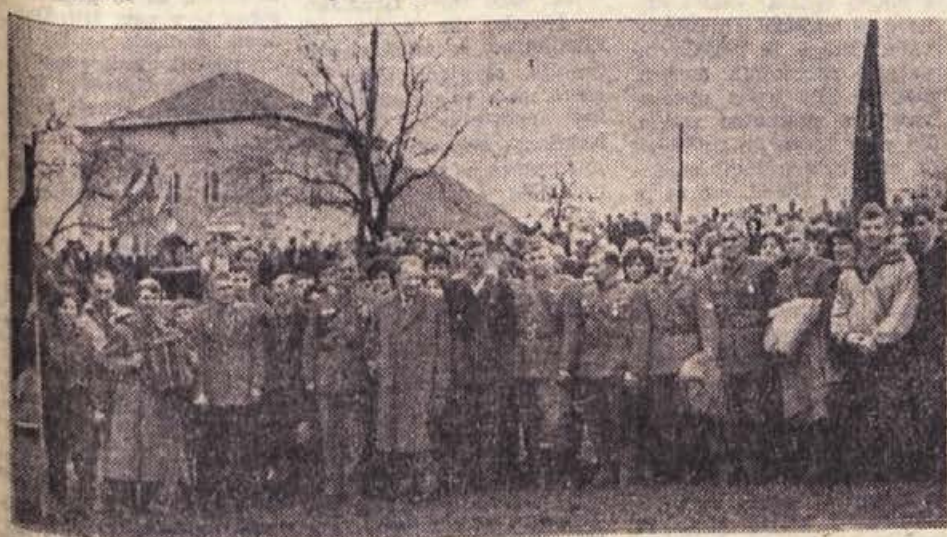
Na Bučki so se po proslavi udeleženci taborniškega pohoda fotografirali s tovariši, ki so napadli v jeseni 1941 nemško postojanko v tem kraju

Ljudje ostajajo zvesti samim sebi in tistemu, za kar so trpeli. Dogovor je kratek. Kot nekdanj. Večerja za sto ljudi in prenočišče na senu. »Jeep« brni in stoka naprej. Nekateri vasi bodo dale vodilce, ki bodo vodili po starih, dobro znanih tolkokrat prehojenih poteh. Ko se v trdi temi ponovno pokažejo luči Novega mesta, je že vse pripravljeno. Pohod se lahko začne.