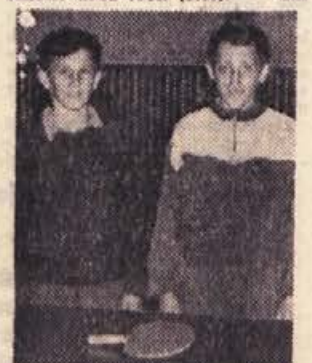
Pionirja Somrak in Gunde sta pokazala lepo in uspešno igro

Drugi dan tekmovalja je uspelo ekipi Partizana osvojiti drugo mesto z zmago nad studentki (Uhl, Plavec) s 3:1. Najboljši igralec turnirja je bil