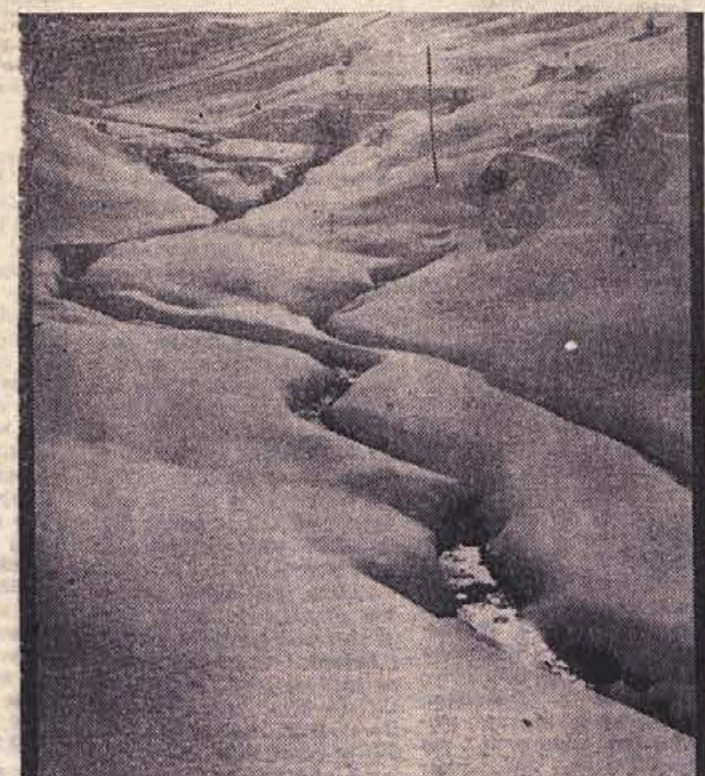
Hilda Rostohar (Videm-Kriško): ZIMSKO SONCE — nagrajena fotografija z letošnje ukrajne razstave fotomaterjev (morda pa zdaj spet lep čas ne bo snega, ko objavljamo gornjo fotografijo tako zgodaj?)