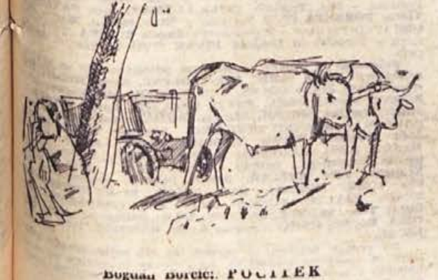
Dogana Borcici: POČIEK

V obnovljeni dvorani Zadrugnega doma v Trebnjem se bodo v nedeljo 12. novembra, ob 9. uri sestali na redno skupščino Svobod in PD delegati društev trebanjske občine. Prav gotovo bo to temeljit razgovor o problemih in odpravi pomanjkljivosti, ki so do sedaj močno ovirale širši razmah kulturnega življenja. Občinski svet je že imel razgovore z delegati, da bi bila skupščina in njeni zaključki čim uspešnejši. V prihodnji številki našega tednika bomo o skupščini obširneje poročali.