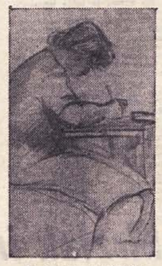
Vlado Lamut: PISMO

prosvetnega društva na vasi last vseh, jim bo nekaj pomenil in se ne bo dogajalo, da bi zaradi odhoda vodilnega društvenega delavca iz kraja delo povsem zamrlo.