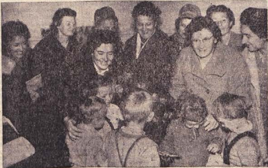
Konec oktobra je bilo v Beogradu zasedanje centralnega komiteja GILDA — Mednarodne zveze združnic. GILDA zaseda vedno v eni izmed držav članic. Tokrat je bila Jugoslavija prvič gostitelj. Predstavnice 16 držav, ki so se zasedanja v Beogradu udeležile, so nato opravile še kratko potovanje po naši državi. Malo dlje so se pomudile tudi v našem okraju, kjer so se udeležile sprejema na Otočcu ter si ogledale kmetijsko šolo na Grmu, obiskale otroški vrtec stanovanjske skupnosti v Kandiji in se pomudile tudi v zavodu za napredek gostinstva in gospodinjstva. Na sliki: gostje pri ogledu otroškega vrtca stanovanjske skupnosti v Kandiji

Okrog 11. novembra dvoali tri-dnevne padavine, nato v glavnem suho oziroma lepo vreme, zlasti okrog 16. novembra. Okrog 18. novembra ponovne padavine s snegom do nižin, pozneje močna burja s prvimi zimskimi dnevi.