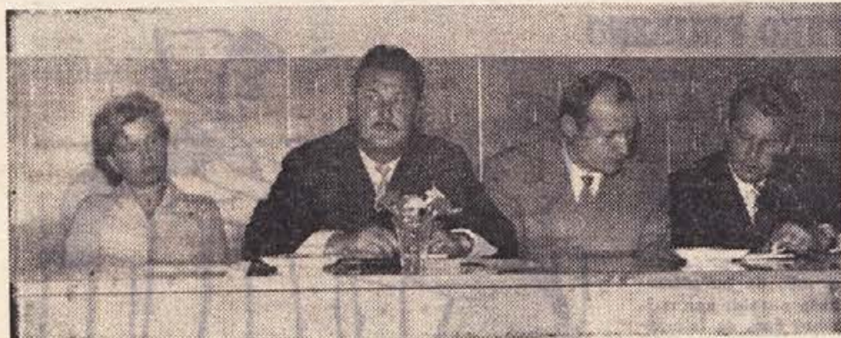
Delovno predsedstvo občnega zbora okrajnega sindikalnega sveta v Novem mestu

V ospredju sta predvsem dve nalogi: ob najširšem sodelovanju kolektivov izdelati pravilnike, težišče sindikalnega dela pa prenesti na sindikalne podružnice — Z osnovnimi principi novega gospodarskega sistema še nismo prodrli do osnovnih proizvajalcev, ker o njem razpravljajo še vse preveč in samo v vodstvih podjetij in sindikalnih podružnic — Ekonomski instrumenti ne bodo sami po sebi ustvarjali načel notranje delitve dohodka — Sindikalne podružnice morajo bolj kot doslej prisluhniti razpoloženju v kolektivu, vsebina njihovega dela pa mora temeljiti prav na tem — V bodoče jim moramo nuditi več pomoči.