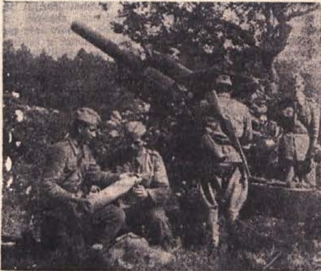
Tudi zanje velja znano pravilo: postati mojster svojega orožja in orodja

Krat dobilo v svoje roke močno orožje, ki je bilo pozneje strah in trepet okupatorja. Orožja ni nihče poklonil, temveč so si ga morali priboriti v boju. Mnogo ljudi je moralo dati življenje, preden so borci prišli do topov. To so bili težki, toda slavni časi ljudske revolucije.