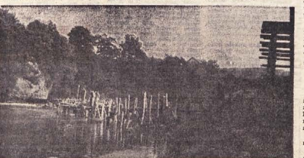
Slika kaže dela pri popravilu jezua na Krki v Novem mestu. Zaradi odprtín v jezui je Krka toliko upadla, da so bili iztočni kanali nad vodno gladino. Obnovitvena dela izvaja novomeška Komunala pod strokovnim nadzorom Vodne skupnosti. Če ne bo večjih padavin, bodo jez popravili do srede novembra. V ta namen bodo porabili 6 milijonov 200 tisoč din, gladina Krke pa bo za 60 cm višja. Večina iztočnih kanalov bo nato pod vodo. Ker bodo nekateri še nad vodno gladino, je treba že zdaj resno razmišljati o betonskem jezui s sistemom zapornic, ki bi dokončno rešil vprašanje vodnega stanja na Krki in kanalizacijskih izplak