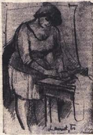
Vlado Lamut: ZAPISEK

Dopolnilno izobraževanje bo zavod organiziral za vse vrste dejavnosti v gostinski in gospodinjstvi stroki; za