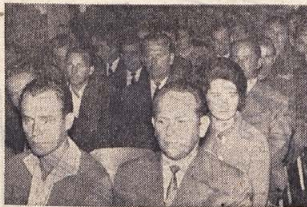
Pogled na skupino delegatov med poročilom

● V vodstvih sindikalnih podružnic sodelujejo 2104 ljudje, med njimi 1292 delavcev in 575 žena.