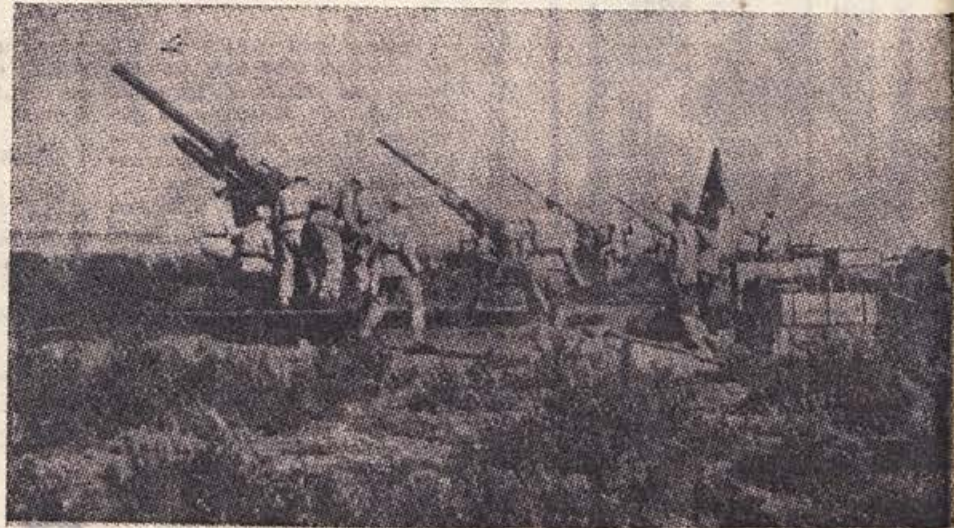
Topničarji JLA pri vajah ob orožju

Tudi nemški tankisti so kmalu spoznali, da se ne bodo mogli sprehajati po naši zemlji. L. 1943 so sicer poskusili vdreti na osvobojeno ozemlje pri Begunjah, toda pri Kamni Gorici jih je dočkala naša protitančkovska baterija in odbila njihov napad. Sovražnik se je moral vrniti proti Ra-