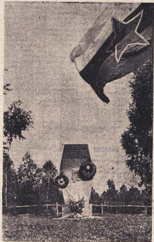
Povsod po domovini nam govore spomeniki, spominska obeležja, kamni, plošče, grobnice in napisi o nepozabnih dogodkih iz let naše revolucije.

V drugi del izobraževalnega programa sodijo specialni tečajji in seminarji za funkcionalno izobrazbo strokovnega kadra v proizvodnji in upravi, posebno pa za dopolnilno znanje srednjemu vodilnemu kadru. S tega področja smo na osnovi analiz v podjetjih pripravili cikel predavanj v obliki eno ali dvodnevni seminarjev, na katerih bodo udeleženci obravnavali aktualna vprašanja organizacije in produktivnosti dela. Ciklus bo izveden v novembru in je namenjen predelavcem, mojstrom, obratovodjem in tehnikom. Obdelali bodo naslednja poglavja: organizacija lastnega dela, faktorji