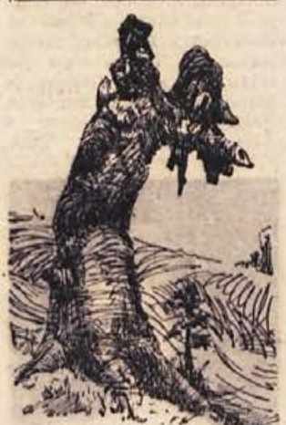
Bogdan Borčič: STARO DREVO

Kmetijska zadruga v Sevnici redno odkupuje vse vrste sadja. Do sedaj je odkupila okoli 30 ton jesenskih jabolč po 15 do 20 dinarjev in 40 ton zimskih jabolč po 20 dinarjev. Pravijo, da bodo odkupili še najmanj 280 ton jabolč. Namiznih hrušk so odkupili okoli 10 ton po povprečni ceni 30 dinarjev za kilogram, hrušk za predelavo 130 ton po 10 dinarjev in sliv za predelavo 10 ton po 13 dinarjev. Zaradi bogate sadne letine pričakujejo velik odkup sadja. Sadje ljudje lahko prodajo v vseh poslovalnicah kmetijske zadruge. D. K.