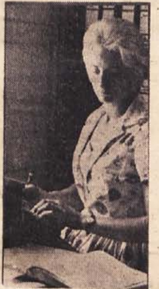
Ivanka iz brežiške KZ pri vsakdanjem delu

druge (n. pr. Šentjanž-Tr-zišče) so s tako akcijo že dosegle lepe uspehe. Več zadržav pa še vedno čaka, da bodo kmečki pridelovalci sami prišli v njihove pi-sarne sklepate pogodbe. Za-kaj se ne bi rajši njihovi strokovnjaki potrudili? Je-senska setev je pred dur-mi, vendar ni tako blizu, da zamujenega ne bi mogli nedoknaditi.