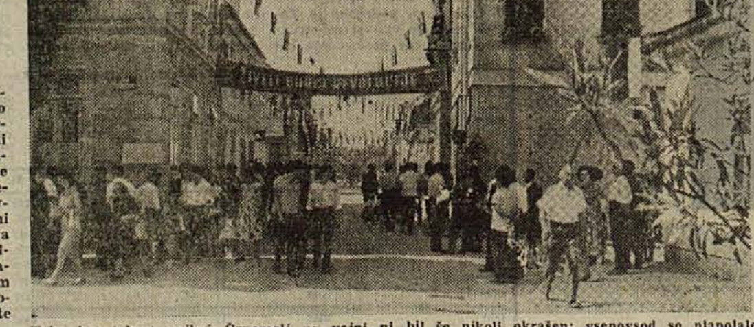
Tako kot tokrat najbrž Crnomelj po vojni ni bil še nikoli okrašen: vsepovsod so palopale zastave, praznično vzdrušje je bilo opazno na vsakem koraku...