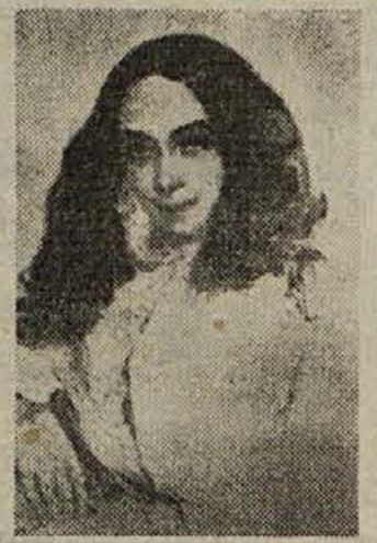
nos angleške književnosti

* E. Barrett Browning: Portugijskih sonetov. Prevodil Alojz Gradnik. Izdala Dolenjska založba v Novem mestu. Založila založba "EMKA", 1961