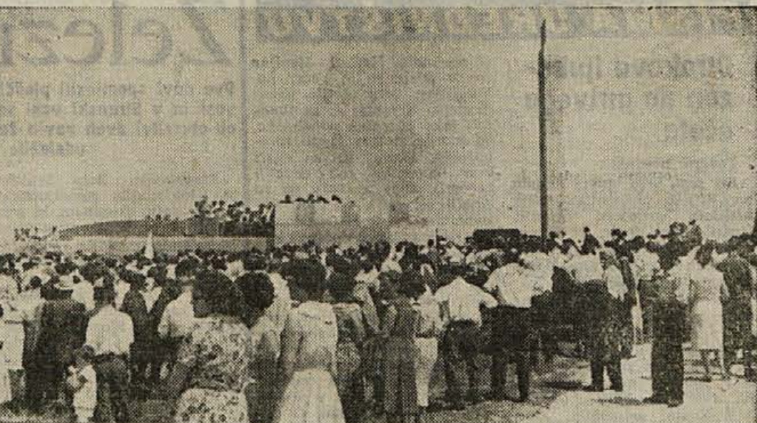
Pogled na del množice med slovesnostjo ob novem spomeniku na Gričku nad Crnomljem; 4. julija se je zbralo v Beli krajini nad 5.000 ljudi

Crnomelj je pričakal in pozdravil svoje goste okrašen kot se menda nikoli po vojni! Organizatorji slavlja so se izkazali, to je treba posebej podčrtati. Mesto je bilo en sam šopek cvetja in zastav, pot na Griček do novega spomenika pa še prav posebej 3. julij zvečer je pred-