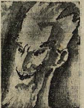
Zmagoslav Jeraj: VEDOMEČ

posreduje boljše probleme, pa tudi beleži, razlaga in poučuje. Dvorana resda ni bila polna, vendar se in gledalci poraja vprašanje: zakaj ni kratkometražnih filmov na repertoarjih naših kinematografov?