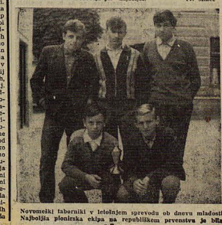
Novomeški taborniki v letošnjem sprevedu ob dnevu mladosti. Najboljša pionirska ekipa na republikanskem prvenstvu je bila s Senovega

Da bi usposobili trgovska podjetja za neposreden nakup blaga v proizvodnji in da bi ustvarili pogoje za specializacijo trgovine, smo v zadnjih dveh letih preusmerili vso grosistično dejavnost v en gros-detajl in reorganizirali manjša podjetja v večja. Tako imamo sedaj v okraju 30 trgovinskih podjetij in 28 prodajalnih industrijskih, obrtnih in založniških podjetij. Na novo osnovana trgovska podjetja ustrezajo po obsegu poslovanja bodočemu razvoju in nalogam trgovine. Toda v pogledu notranje organizacije, finančne ter komercialne sposobnosti in specializacije trgovine ta podjetja še niso povsod uspela. To vprašanje se toliko bolj izraža sedaj, ko se že delno čutijo posledice novih instrumentov in ima proizvodnja mnogo več smisla za neposredni poslovni stik s trgovinskimi podjetji na drobno. Poleg preteklih problemov glede števila primernih lokalov in modernizacije, ki izvirajo iz premenjnih investicij v trgovino, menim, da