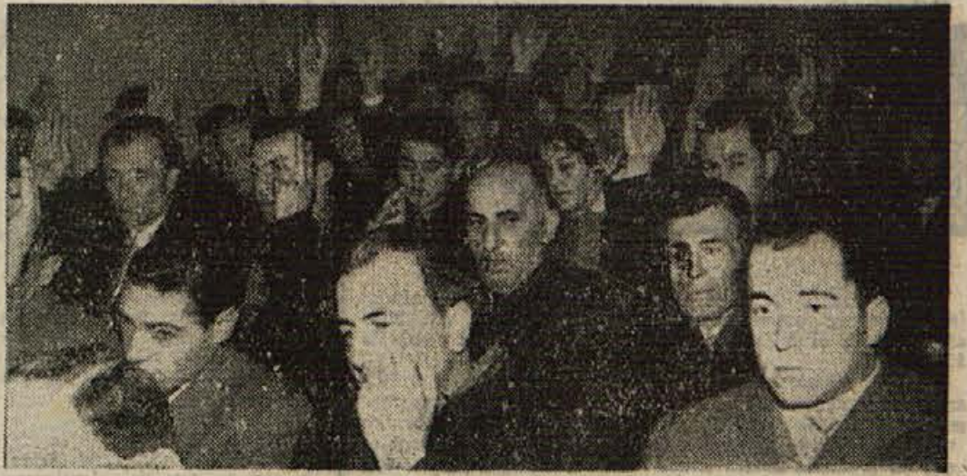
Delegati občinske konference SZDL v Brežicah volijo organe konference

da nikakor ne smejo dovoliti, da bi šel plan tak, kakršnega je izdelal občinski aparat, naravnost pred ljudski odbor in družbi. Šele potem na zbor volivcev. Vse predloge, pobude in priporočila, ki jih bodo dali zbor volivcev, delavski in zadrugi sveti ter drugi samoupravni organi, je treba upoštevati in jih vsklajene z realnimi možnostmi upoštevati v družbenem načrtu.