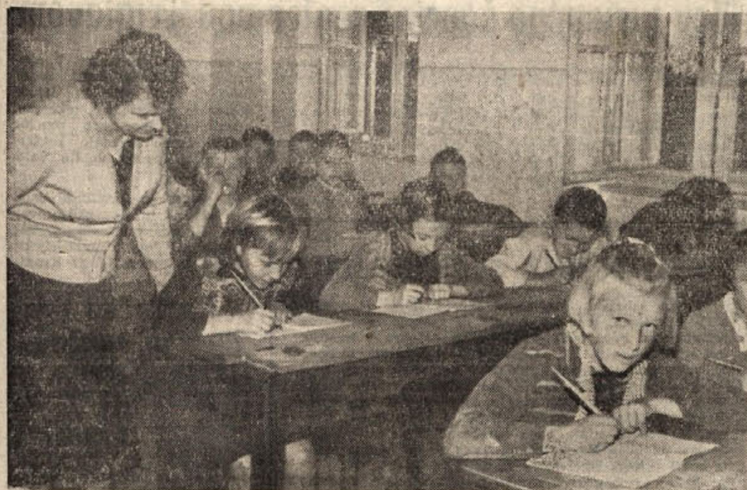
Le pogledite jih, pridne glavice 3. razreda osnovne šole na Bizeljškem, kako vneto računajo!

Zapiski po letni skupščini DPD SVOBODE v Kanižarici