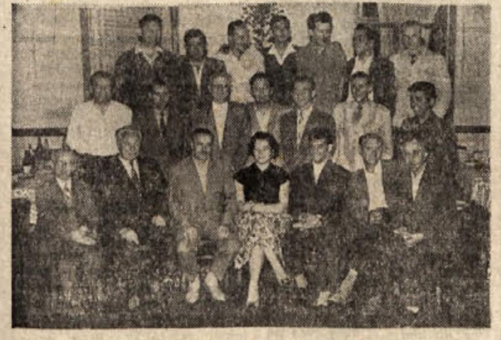
Orkester DPD Svoboda Dušan Jereb v Novem mestu je po svojem kvalitetnem izvajanju dobro znan ljubiteljem glasbe in obiskovalcem raznih slavnostnih prireditelj. Dostojen je bil to simfonični orkester, ker so bili njegovi člani tudi godbeniki JLA. Ker je godba JLA odšla iz Novega mesta (ostalo jih je le še pet), se je orkester znašel v Škripih. Vendar so se člani, čeprav jih je bilo nekaj manj, z novo vneto lotili dela in se nam bodo kmalu predstavljali kot salonski orkester. Na sliki: člani orkestra ob slovesu od svojih tovarišev-godbenikov JLA

Ko smo lani izvedli tako anketo med 60 vajenci, se je pokazalo, da jih največ obiskuje domače filme (26), na drugem mestu so kavbojke (14), na tretjem italijanski in an-