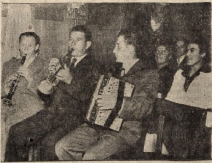
Domači trio je urezal celo vrsto poskočnih in res lepo ubranih viž

V tem pa je tudi namen pomoči, ki jo bodo novinarji Dela, RTV Ljubljana in Dolenjskega lista nudili organizacijam SZDL v okraju pred kongresom. Prihodnji večer bo v četrtek 10. novembra v Trebnjem.