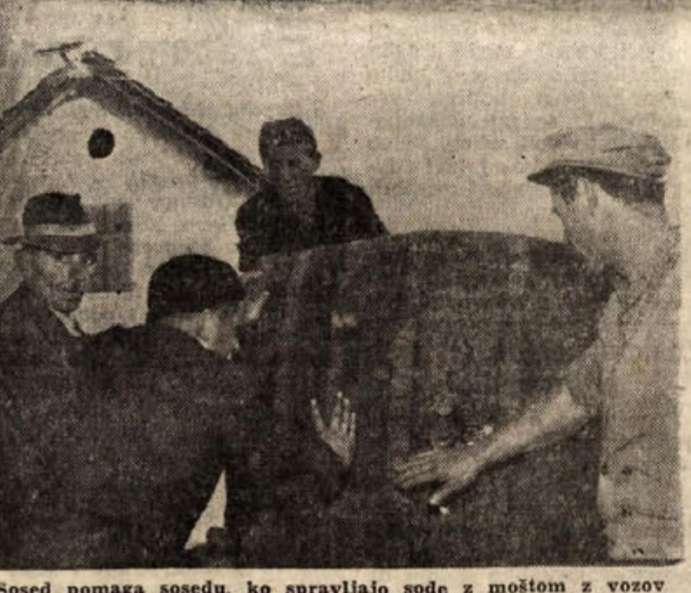
Sosed pomaga sosedu, ko spravljajo sode z moštom z vozov (vsakdanji prizor pred vinarskim odsekom bizeljske kmetijske zdruge)

pa je bilo tik za njim in se je začelo v njegov zadnji konec. Ker sta oba vozilka vozila zelo hitro, je sunek pogнал vozilo S-1386 (DKW Junior) visoko v stranico vseka, od koder se je prevrnilo nazaj na avtomobilsko cesto. Voznik in trije potniki so laže poskodovali na obeh vozilih pa je za več kot pol milijona škoda. Vozilo S-1386 vrh vsega ni zavarovano, tako da bo moral posestnik Franc Kotar (njegov pradedek je nesrečo povzročil) lastniku avtomobila najbrž odrediti težke denarje. Za mnogokrat smo pisali o tem, da je pašo ob avtomobilski cesti zelo nevarna. Gornji primer je nov, resen poduk. Kmetovalci, upoštevajte ga! Vse našteje nesreče so posledica prevelike hitrosti in kršenja cestno-prometnih predpisov. Voznike zato ponovno opozarjamo, naj kadar koli sedejo za krmilo, pomislijo, da so odgovorni za velike materialne vrednosti, predvsem pa za življenje sopotnikov in ostalih uporabnikov cest. Majhna nevarnost ali prenegljetost lahko povzroči hudo prometno nesrečo!