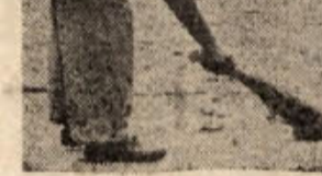
uspešno izvedla to svojo, najčistejšo reformo do danes. Na sliki: indijski cestni pometalci s staro metlo.

Po Nehrujevem pismu je vlada države Pendžab odredila, naj pometalci uporabljajo samo meče z dolgimi držaji. Tudi občina New Delhi je sprejela novo metodo pometanja ulic. Dnevnik »Times of India« piše v svojem uvodniku med drugim: »Pometalci naj sami zahtevajo za svoje delo metle dostojne dolžine. Samo tako bo zagotovljena, da bo lahko naša vlada