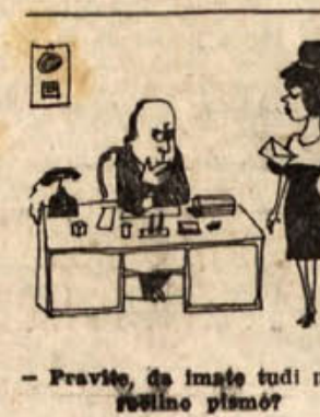
Pravite, da imate tudi priložnostno pismo?

POZNAVALEC V KNJIGARNI »Rad bi kako zanimivo knjigo.« »Zelite Zadnje dneve Pompejev?« »Prav. Samo povejte mi prej, od česa je ta družina umrla.« ZADNJA ŽELJA »Eh, gospodje zdravniki, sam vidim, da sem hudo bolan, vi pa ne morete ugotoviti, kaj mi je. Zato bi vas lepo prosil, da me po smrti raztelesite; bom vsaj vedel, od katere bolezni sem umrl.«