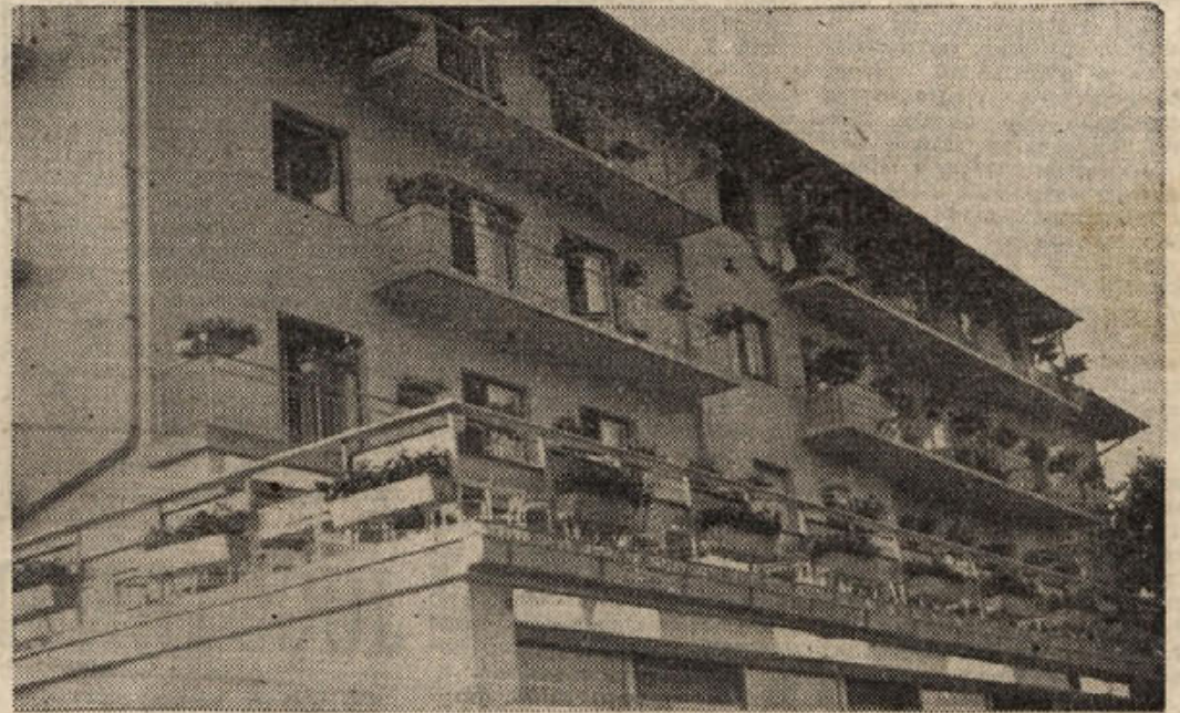
Pozdrav iz Smarjeških Toplic, ki so z letošnjimi povečavami (slika nam kaže prizidek glavne zdraviliške stavbe) precej pridobile in postale še bolj priljubljeno zbirališče vseh, ki cenijo oddih in prijeten počitek v čudoviti okolici in zdravilni termalni vodi

ZA CAS OD 3. DO 13. NOV. Do 6. novembra še nestalno s pogostimi padavinami, nato pretežno lepo vreme z meglo v nižinah, le okrog 9. novembra nekaj krajevnih padavin. Dr. V. M.