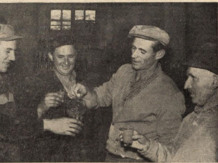
Po trdem, napornem delu se kozareček sladkega mošta vsakomur pričeže. Tudi možje vinarskega odseka bizelske zadruge so ga v četrtek popoldne spili pol litra, pa še nam so ga dali pokusiti (kako bi sicer poročali, da je sladek in močan, čeprav ne tak, kakor prejšnja, ugodnejša leta) — in res je škoda, da bo letos vinskega pridelka znatno manj kot lani

Elaborat je že potrjen, odprto pa je vprašanje investicijskih sredstev. Investicijska vsota, potrebna za uresničitev vsega načrta, znaša 1 milijardo 300 milijonov dinarjev, samo za prvo stopnjo rekonstrukcije pa bi bilo potrebnih približno 700 milijonov dinarjev.