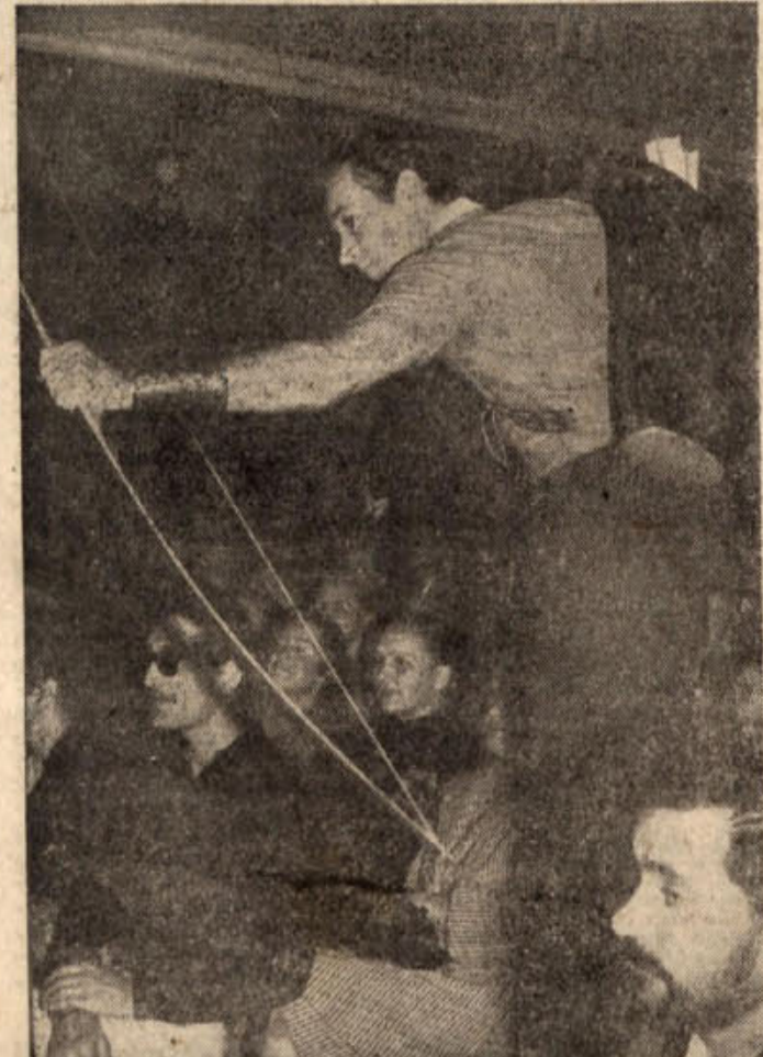
Se spominčkan na »Razgovor o filmu«, o katerem smo že zadnjič obširneje poročali: mladi svet v dvorani DLP v Novem mestu je še posebej navdušil sodobni »Robin Hood divjega Zapada« — ameriški igralec Guy Madison, ki je res dokaj spretno streljal iz dvorane na oder z lokom in počel precej ploskanja za svoje uspehe...

Vinogradniki iz Kratova v Makedoniji so najboljši strokovnjaki za pripravlanje sladkega vina. Njihovo vino ima okus po likerju.