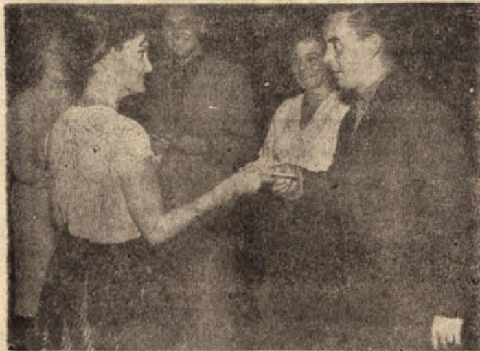
Filmska igralka Rossana Podesta razdeljuje nagrade udeležencem kratkega nastopa, ki se je razvil pred gledalci v nabito polni dvorani.

In tako je v lahkem, igrivem tonu potekal pogovor z našimi in tujimi igralci. Med pogovorom z igralci so dvakrat zapeli delavci Dubrava filma. Igralci so pokazali tudi nekaj svoje izurjenosti (Robin Hood zahoda — Guy Madison je streljal z lokom, dva igralca sta sabljala). Sledil je še pogovor z Rossano Podesta, ki je obrtala svojo pot do filma. Za odgovore o njenem delu v filmu je pet gledalcev dobilo nagrade, ki jim jih je izročila igralka. Razgovor je zaključil režiser »Rimske sužnje« Sergio Grieco.