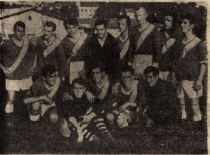
ELANOVA zmagovalna ekipa, ki je z nedeljsko tekmo postala okrajni prvak nogometne podzveze

vaša mnenja, da bo imel Elan precej težko delo, če bo hotel obdržati prvo mesto v okrajni ligi. Preroki ko mu je Borec lepo poigral iz gneče pred golom. Naslednja dva gola sta dosegla Hrvat in Vesel, tako da se je prvi polčas končal z rezultatom 4:0 za Elan.