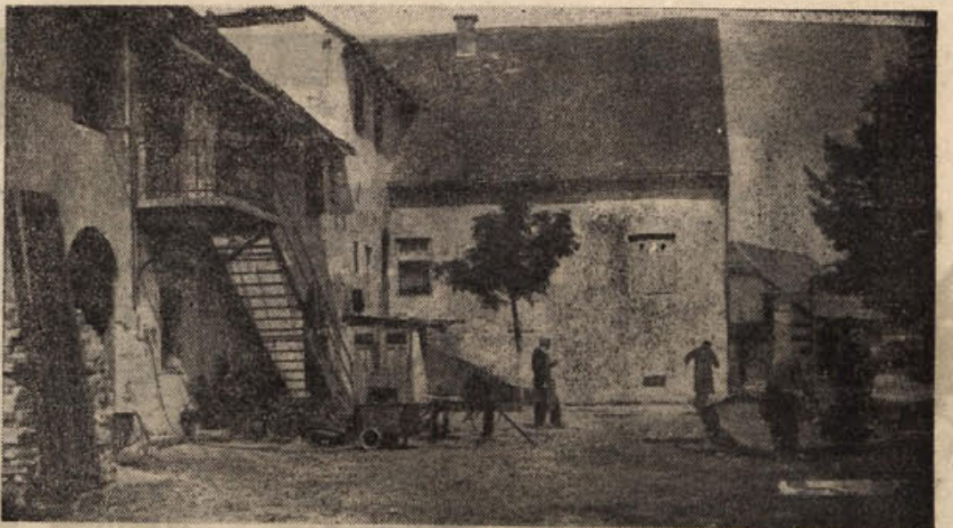
Poročali smo že, da je Obrtno kovinarsko podjetje v Dobovi prvo v okraju doseglo in izpolnilo letošnji proizvodni plan. Delavnice ima v teje zgradbi: v prvem nadstropju in na dvorišču. Preden pridejo v zgorajno delavnico, morajo s materialom in izdelki po stopnicah, kar jih semalokrat ovira pri delu. Kljub različnim oviram si majhen, toda vztrajen kolektiv prizadeva, da bi kar največ prispevali skupnosti

M. S. Kadar kupujete ali želite kaj prodati — poslužite se našega oglasa