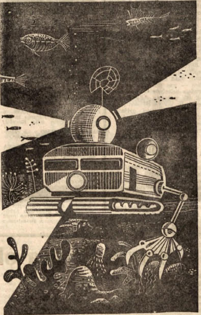
Osvajanje morskih globin si v skorajšnji prihodnosti predstavl- ljajo učenjaki takole: ogromni stroji, le na videz podobni sedaj- šnjim podmornicam, bodo raziskovali morsko dno in risali nove zemljevide doslej neznanih globin mokrihi razsežnosti...

Zlariške koralarje prav radi obiskujejo domači in tuji turisti da opazujejo, kako spretni lov- ci, domačini, prinašajo iz mor- ske globine prgišče teh drago- cenihi živalce.