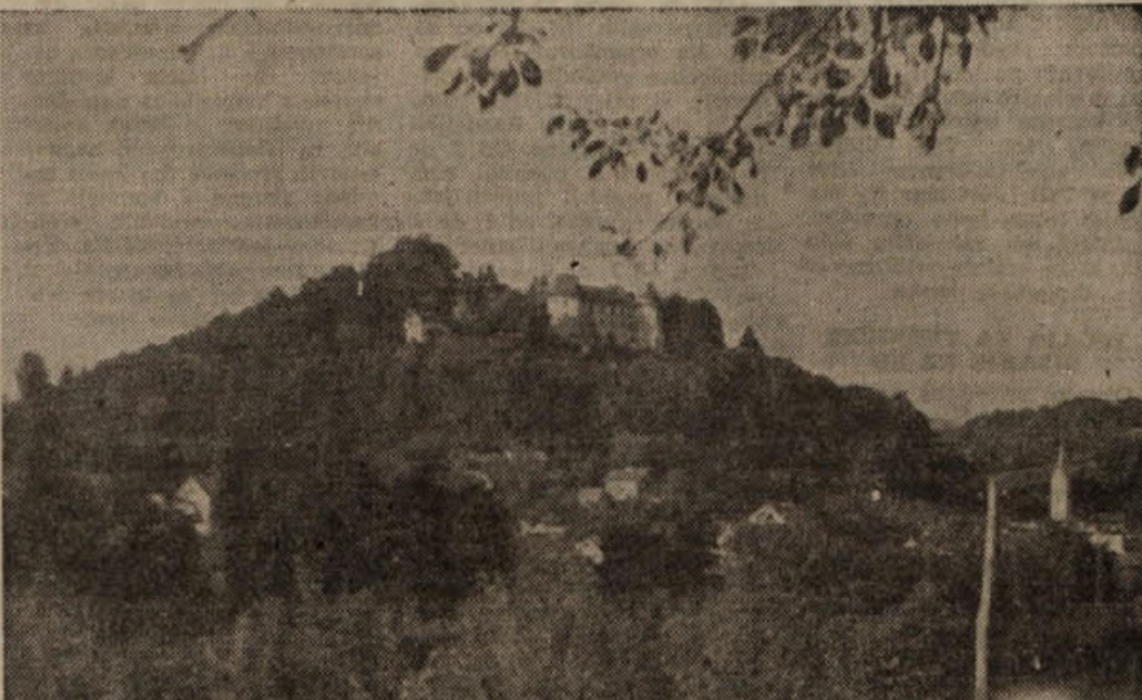
Prireditev ob občinskem prazniku v Sevnici so za nami. Proslavili smo ga dostojno, saj je bil enotenski sporod dokaj pester in bogat. Akademija v torek zvečer in veličasten zbor v sredo zjutraj sta pokazala prehojeno pot. Ljudje so prisluhnili in videli veličino uspehov. Sedaj so znova odšli na delo, trdno odločeni, da v bodoče še povečajo delovne in druge zmage, da še povečajo proizvodnjo vseh dobrin. Prihodnje leto pa - kaj neki bi moglo biti drugega kot še večji uspehi, še več pohval in priznanj za trud, ki ga bomo vložili naslednjih 12 mesecev v vse naše delo za nadaljnjo rast sevniske komune in Sevnice!