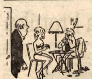
— Nič se ne jezi, očka, saj ne igrava za denar...

ZASKRBLJENA ZENA »Panirac,« pravi žena zjut- raj možu, ki vozi pri gradnji gorjanske ceste, »obljubi mi, da ne boš tako drvel kot dru- gi šoferji!«