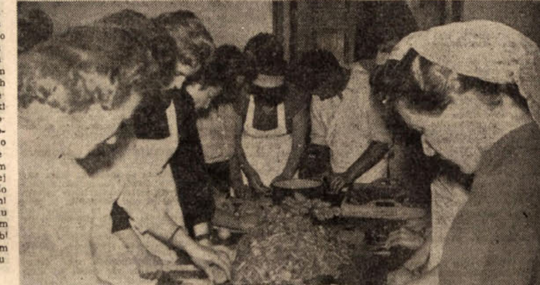
Toliko rok je pri delu, da bi marsikdo na prvi pogled rekli: pogled no, to je pa tovarna. Na silki pa vidite skupino udeležencev in udeleženec tečaja za vkuhanje, ki ga je na Bizeljskem pridelala šolska žena-zadruga. Brez posebnega strokovnega vodstva se žene ojnaučile in 5. septembra pričele. Kmetijska zadruga jim je dala na razpolago prostor in nekaj drv za kurjavo, kozarce in vse potrebno (tudi štedilnik za kuho) so priniseli tečajnice s svojih domov, 25 jih hodil redno vsak dan, večnih jih je tudi več, kakor pač ustelejo. Da, še celo Mirje fantje se s pomočmi del dekleta in se uče vkuhanjavanja. Tovaršice jih zelo pohvaljajo, pravijo da so prav tako ročni kot oni, eden izmed njih je celo najboljši tečajnik! Nemalokrat je ura še polna, če se svetl luč v sobi, kjer pridni udeleženec tečaja kuhajo mezz, pripravljajo srbsko in bolgarsko solato, vkuhanjavo sadje in se uče. Dosej so vkuhali in vložili še več kot 200 litrov. Tečaj bo trajal do 28. septembra, nato bodo pridelile žene-zadrugnice razpolago o vkuhanjavo sadja in zelenjave za samo. Na Bizeljskem so imeli do sedaj še dve kuharske šole (prva leta 1955, druga leto 1956). Mladiki tečaj za vkuhanjavo je prvi