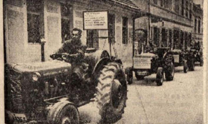
Z nedeljske povorke kmetijske mehanizacije v Vidmu-Krškem: traktorji ferguson s številnimi priključki, opremljeni s podatki njihovi vsestranski uporabnosti, so sprožili med številnimi gledalci veliko zanimanja

V prvih šestih mesecih letos so jugoslovanske tovarne proizvedle skoraj petino industrijskega blaga več kot v istem razdobju leta 1959. Največje povečanje — in sicer 33-odstotno — so zabeležili v industriji Črne gore, sledi Srbija 21 odst., Makedonija 19 odst., Hrvaška 17 odst., Slovenija 16 odst., ter Bosna in Hercegovina 15 odstotkov. Najbolj se je povečala proizvodnja — za 25 odstotkov — tobačnih izdelkov in v živilski industriji. Sodeč po proizvodni uspehih v prvih šestih mesecih se bo narodni dohodek letos povečal za več kot 8 odstotkov, kakor je predvideno z družbenim planom.