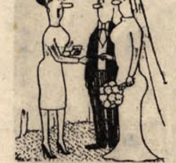
— Čestitam, draga moja, poročila si najbolj interesantnega med možmi, ki sem jih jaz zavrnila...

»Pastirček pasel je oco, začel antene štet...«