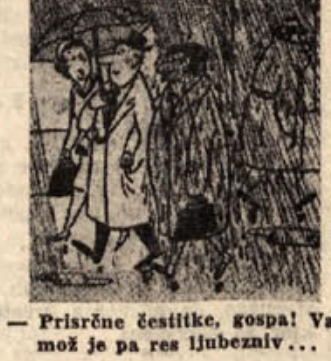
Prisrčne čestitke, gospa! Vaš mož je pa res ljubezljiv...

CAKANJE »No, spet greš z mano neobriti!« »Cakaj: obril sem se, ko si se ti začela oblačiti.«