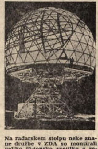
Na radarskem stolpu neke znane družbe iz ZDA so montirali veliko 60-tonsko svetilko z reflektorjem in z mnogimi svetilni kanali. Naloga te svetilke za radar, kot jo imenujejo, je, da ugotavlja stopnje vpliva radarske kupole na sprejemnik, ki ga ima vmontiranega.

hrani ribiču še vesla. Konstruktor, American Dick Brackett pravi, da bo svoj izum z dvema močnima jermenoma. Motorček dveh konjskih sil pri-