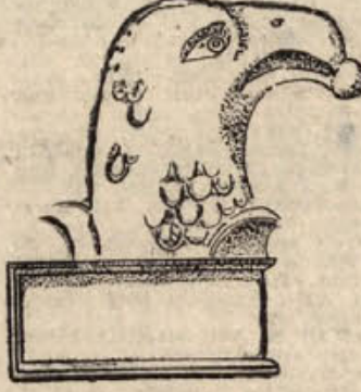
Skica glave v Drnovem izkopane rimskega orla

Počitek v hladni senci pod košato lipo se nama je odlično prilagel. V dobri uri sva pošteno omlatila pol sveže pečene hlebca kruha ob mortadelu in pospravila polič dobrega vina, ki je ohladil žejo. Medtem sva z zanimanjem poslušala Beletovo mamno in tudi oba »mlada« sta kljub delu rada kramljala. Kako rada bi še ostala v tej prijetni družbi, da ni priganjal čas. Po cesti navzdol sva se napotila k izviru Težke vode. To ime so dali močnemu potoku zato, ker so ženske tu zajemale vodo in nosile težko breme od izvira po strmi poti v vas.