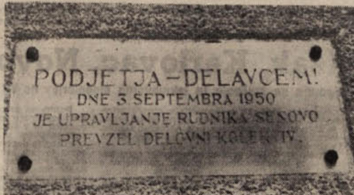
Desetletnico delavskega samoupravljanja bo slavil kolektiv senovških rudarjev letos 3. septembra

Rudnik Senovo pripravlja izobraževalni center za svoje rudarje, saj je kolektiv velik. Zgradili bodo tudi izobraževalni dom. Načrte zanj že pripravljajo. V ta namen je zbranih 8 milijonov dinarjev. V domu bosta dve predavalnici, prostori za knjižnico, klubska soba, prostor za prikazovanje diapozitivov in poslušanje filmov, skratka vse, kar potrebuje sodobna izobraževalna ustanova.