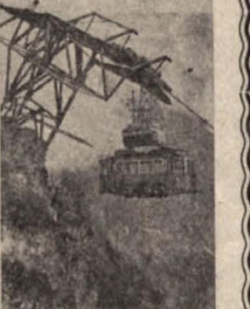
Po dolgih letih službe na ulicah Zürichu v Švici je tramvajski voz na sliki dostupil v tem mestu, nadaljeval pa bo na neki poštni liniji na goriskem masivu Glarona. Kamor so ga morali potegniti v žično železnico (na sliki).