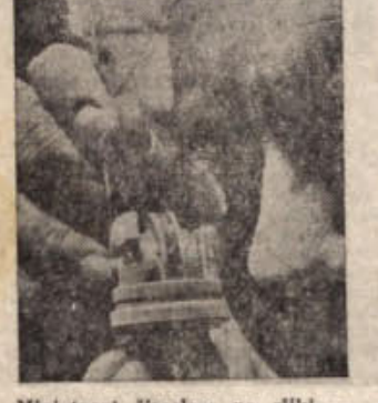
Miniaturni žirokrop na sliki — težja 200 gramov — je najbolj občutljivi živec v vodstvenih napravah vesoljskih rakiet. Je silno občutljiv in njegovi vrteči se deli v membrani s helijem so priljubljeni na ovi, ki je 30-krat tanjša od najljepšega človeškega lasu. Žirokrop je občutljiv za premike do petimilijonskega dela palca (angliška dolžinska mera = 2,54 centimetra).