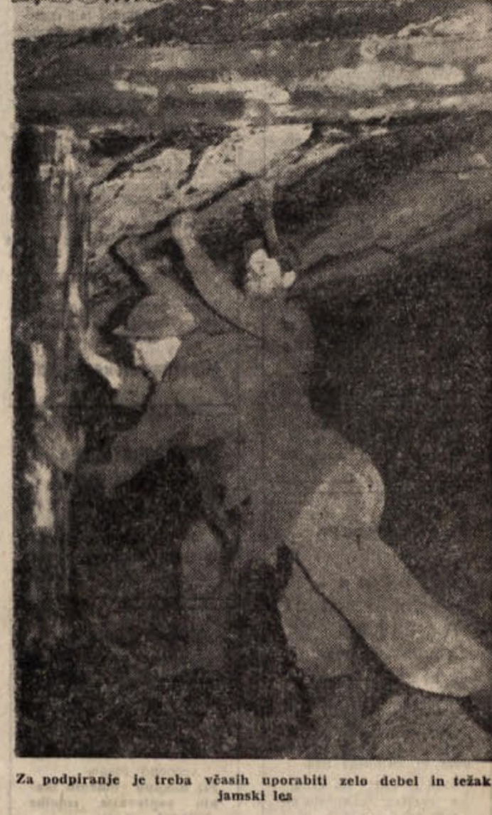
Za podpiranje je treba večših uporabiti zelo debel in težak jamski les

Za 4. julij in za minul kranjski praznik pozdravljam vse vasčane in jim čestitam; Tomi Jesih iz Sarajeva.