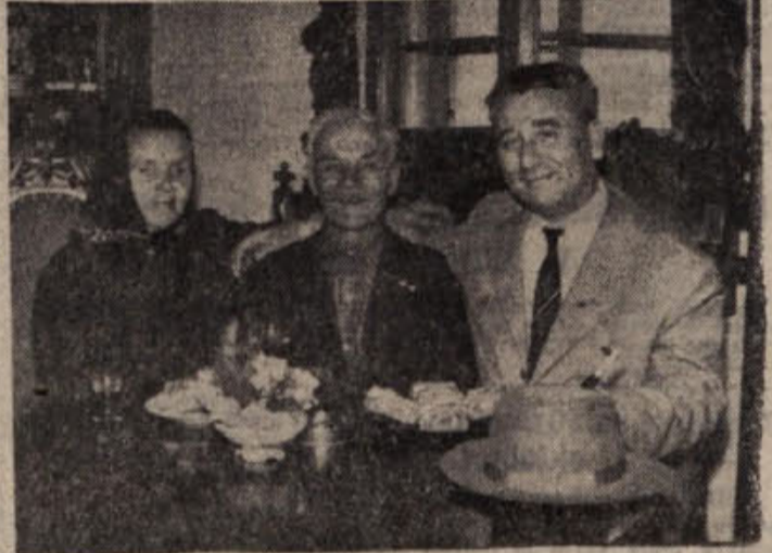
Predsednik Zveze borcev NOV Jugoslavije tovariš Aleksandar Ranković je v nedeljo, 19. junija dopoldne sprejel predstavnike ZB in ZVVI našega okraja. Prisrčno se je pomenil tudi z nekaterimi starimi padlimi partizani in s starimi aktivisti našega okraja. Na sliki: partizanska mati in oče iz Bele krajine s tovarišem Rankovićem