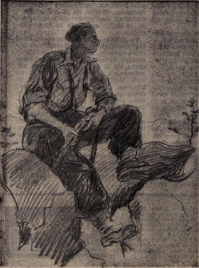
Božidar Jakac: NA STRAŽI

Bliža se 4. julij — dan borca. Zopet bodo oživel tisoč spominov na težke in vesele trenutke iz časa narodnoosvobodilnega boja. Spomini se bodo zvrstili neurejeno. Oživel bodo ob pogledu na hoste, jase in polja, mesta in vasi, na prehode preko rek... Leta so izbrisala datum. Partizani se spominjajo: »To je bilo takrat, ko je padlo toliko smega — pozimi dvajsetdesetega... To je bilo, ko je alja zorela... Na tej čistini smo se borili tistega leta, ko je padel naš kurir... Dnevi in meseci so izginili. Ostali so samo zapiski zgodovinarjev. V spomenu njih, ki so se borili, pa se ti dogodki polagoma stranjujejo v en sam čas jurisve in hajk, v čas boja za novo življenje. Prepletajo se s sedanostjo.