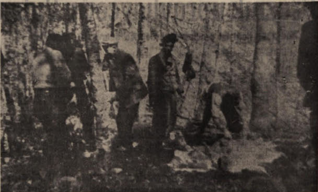
Doslej še neobjavljena fotografija Gorjanskega bataljona, posneti avgusta 1942 na Pragu na Gorjancih.

Sinove, može ali fantje, ki služijo vojaški rok v vrstah JLA, boste prijetno presenetili, če jim naročite DOLENJSKI LIST!