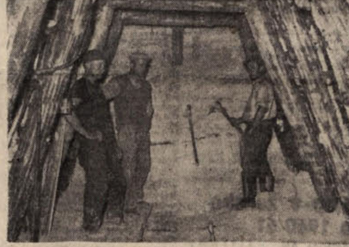
Rudarji v rudniku Globoko