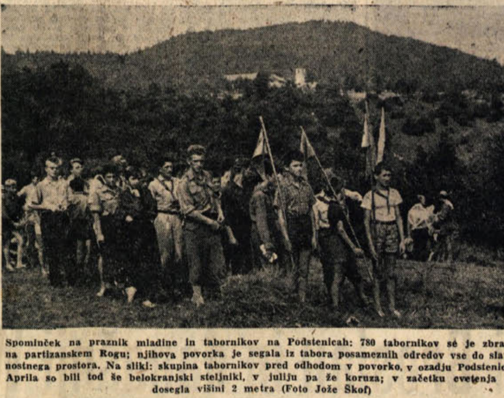
Spominček na praznik mladine in tabornikov na Podstenicah: 780 tabornikov se je zbralo na partizanskem Rogu; njihova povorka je segala iz tabora posameznih odredov vse do slavnostnega prostora. Na sliki: skupina tabornikov pred odhodom v povorko, v ozadju Podstenice. Aprila so bili tod še belokranjski stelniki, v juliju pa že koruza; v začetku cvetenja je dosegla višini 2 metra

Občinski ljudski odbor Trebnje je v lastni režiji začel asfaltirati cesto skozi Trebnje. Asfaltirana cesta bo dolga 800 metrov. Če bo vreme ugodno, bo delo končano v štirinajstih dneh.