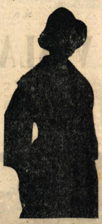
Na sliki: Model jesenskega plašča. Letošnja moda narekuje za plašče zelo velike ovratnike in stisnjene pasove, da pada blago v bogatih gubah

Brezice s 5 točkami pred BELT Crnomelj in Celulozo Videm-Krško prav tako s 6 točkami, toda z boljko razliko golov. Sevnica se je uvrstila na četrto mesto z dvema točkama in Mirna na peto mesto brez točk. Pohvaliti moramo domačo rokometno ekipo, ki se je vztrajno borila in je bila močno okrnjena. Njihovi tekmovalci so na plavalnem prvenstvu v Beogradu. To je bilo zlasti čutili pri naprednih vrstah in pri vratarju Rezervni vratar ni bil kos svojih nalogi. Ugodno je presentelita tud Sevnica. Po končanem tekmovanju je bila odigrana še prijateljska rokometna tekma med zmagovalcem iz Brezice in tretje plasirano Celulozo. Z lakotno je Celuloza premagala zmagovalca z rezultatom 8:3. Pri tem pa moram omeniti, da je za Celulozo branil rezervni vratar iz Brezice. Turnir je popolnoma uspel. Množilo je le nekaj. Na lepših je bilo napisano, da se turnir prične v soboto in v nedeljo obakrat ob 18. uri. Gledalci, ki je prišel v nedeljo ob 16. uri na tekme, je bil močno razočaran. Točno ob 18. uri je bil rokometni turnir končan. Tekme so bile odigrane že v tnaturnih urah in pričelo se je zopet ob 14. uri. In vendar so me organizatorji prepričevali, da je ta turnir tudi propagandni in da je njegov namen pridobiti gledalce. Drago Kastelic