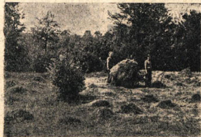
Ob robu senčnih host bi se seno slabo sušilo. Zato ga je treba znositi na sonce

Čas gorjanske košnje je odvisen od lege košnic. V bližnje košnice se spuste Gaberčiči in Jugorci že takoj po Petrovem (29. junij), v polnem razmahu pa je njihova košnja v prvi polovici julija. To je tudi čas košnje po zumberških košnicah. Najkasneje dozori trava