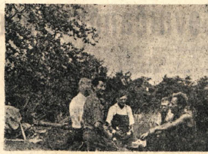
Koscem, ki podirajo dišečo travo gorjanskih košnic, se prilije žujina. Gospodinja in gospodar poskrbita, da je obilna in zalita

TEZAVA S PSOM »Čujte, tovariš veterinar,« pravi lastnik velike in močne doge, »tale pes mi prizadeva grozne preglavice. Nепrestano dirja za majhnimi avtomobili.« »O, to ni nič hudega,« ga tolaži veterinar, »psi sploh radi tekajo za avtomobili.« »Vem. Ampak moj jih vlačim na vrt in tam zakopava...«