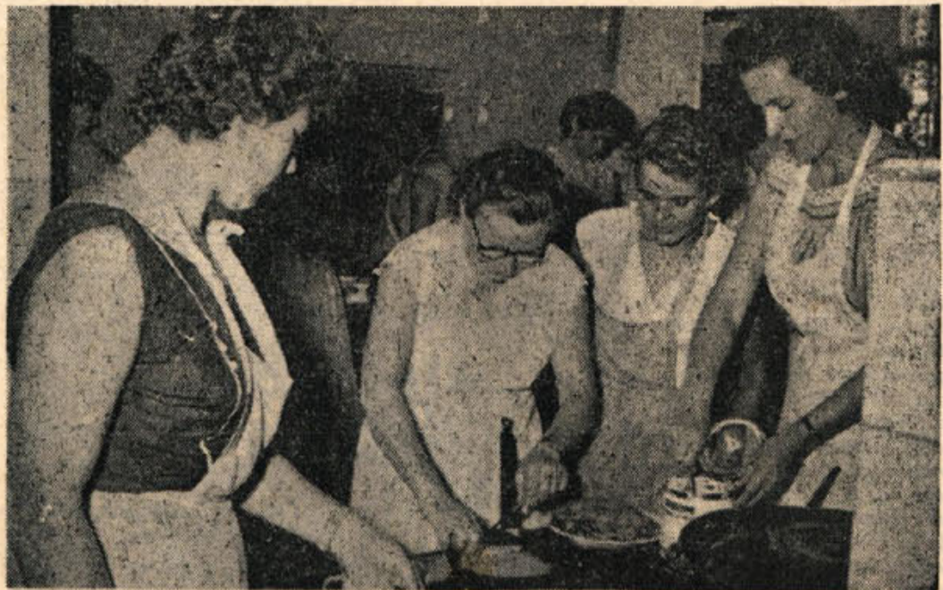
Tudi učiteljice za pouk gospodinjstva v osemletkah so se bile pretekli teden zbrale k teoretičnemu in praktičnemu pouku v krajnem Zavodu za pospeševanje gospodinjstva v Novem mestu. Dobro pripravljene bodo zdaj lahko nudile mladini v šolah marsikaj zanimivega in za življenje nujno potrebnega