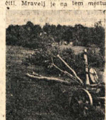
Smuke so najprimernejši »tovornjak« za gorjanske strmine. Z njimi odvažajo seno v dolino

Na košnici Pri Jezeru je bila nekoč vas. Še danes se pozna zidovje in robovi na košnicah so sledovi nekdanjih brazd. Nekateri menijo, da so odšli ti prebivalci z Gorjancev zaradi turške nevarnosti, drugi pa trde, da so morali bežati pred mravljami, ki so jih hotele uničiti. Mravelj je na tem mestu