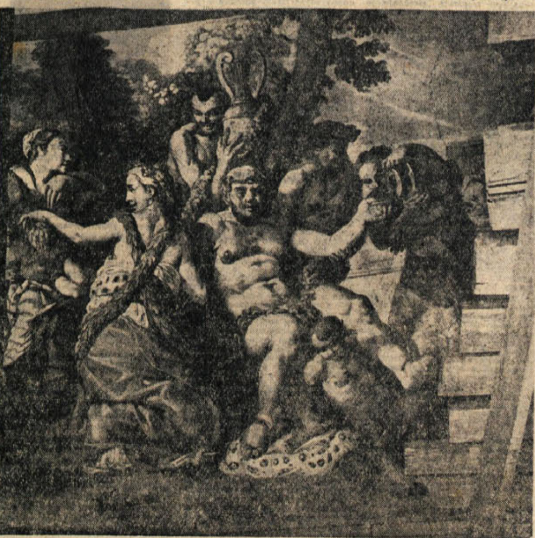
Bakhusova skupina v brežiški slavnostni dvorani

Slovensko etnografsko društvo bo od 14. do 17. septembra organiziralo na Bledu VI. kongres in letno skupščino Zveze združenja folkloristov Jugoslavije. Predavali bodo jugoslovanski in nekateri tuji etnografi in strokovnjaki za folklor. Kongres bo pod pokroviteljstvom Sveta za kulturo in prosveto LRS.