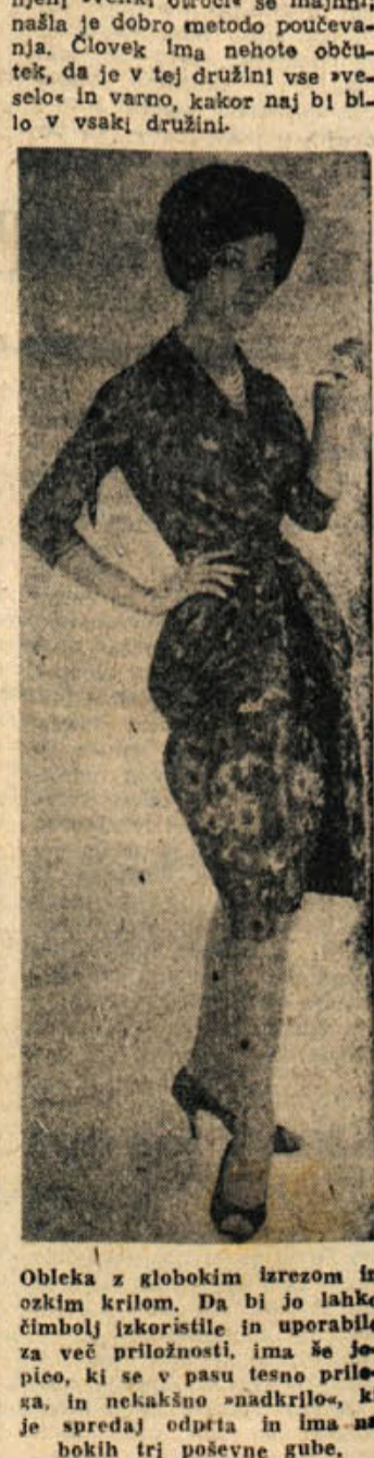
Obleka z globokim izrezom in ozkim krilom. Da bi jo lahko čimbolj izkoristile in uporabile za več priložnosti, ima še jopico, ki se v pasu tesno prilga, in nekakšno »nadkrilo«, ki je spredaj odprta in ima nabokih tri poševne gube.

4. Včasih pa je treba otroke le prepustiti same sebi, da si naberejo izkušnje. Morda bo pa deli kdo v bazen (pažni, da ni v njem preveč vode) in bo moral potem prenašati posledice mokre obleke (postelja in vroč čaj). Vse moje navedbe najbrž dišijo po »svzorni ženici«, kar pa poudarjam, nisem. Zdi se nam, da je ta mati, kljub njeni nasprotni trditvi v dobrem pomenu le svzorna žena. Vse naredi brez velikega hrupa in zna ustvariti v družini pravo sožitje, čeravno so njeni »veliki otroci« še majhni; našla je dobro metodo poučevanja. Človek ima nehotne občutke, da je v tej družini vse »veselo« in varno, kakor naj bi bilo v vsaki družini.