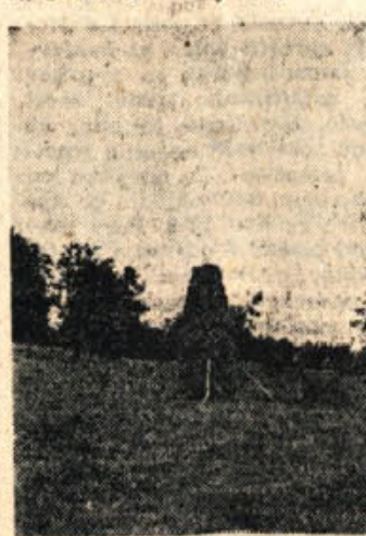
Ponosno in ravno stoji na košnici pri Miklavžu koplje, ta gorjanska oblika spravljanja sena

Za gorjansko košnjo pripravijo kmetje dobro in tečno hrano, da se podpro za težko delo. Zjutraj, ko začne kositi, dobe kosci žganja. Okoli šeste ure imajo »frustek« — slanino, čebulo in kruh. Sredi popoldneva je predjuznik, za katerega pripravijo klobase ali kakšno drugo meso. Za opoldanski obrok je v navadi kisel zelje, v katerem se je kuhala krača, ali pa jesprenj, v katerega je tudi stopil pakec. Popoldanska malica je podobna dopoldanski; ves dan pa morajo imeti kosci in grablice dovolj vina.