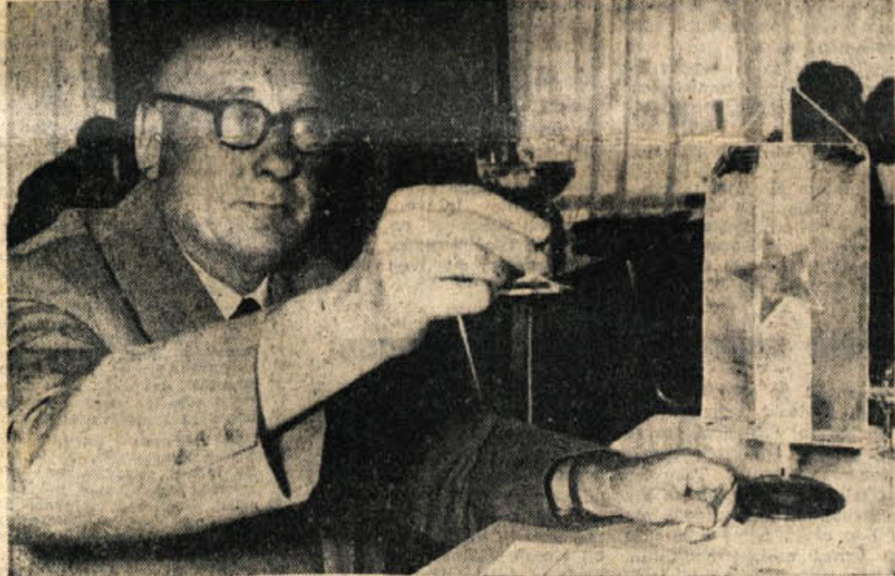
Ocenjevalec pri komisiji na letošnjem vinskem sejmu, kjer je naša država v močni mednarodni konkurenci dosegla tako lepa priznanja

OD 4. DO 13. SEPTEMBRA V splošnem nestalno s pogodbinami padavinami in obilnimi razjasnitvami na bodo trajale več kot tri dni. V. M.