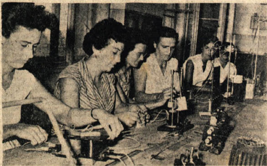
Na tečaju za matematiko in fiziko za učitelje osemletk v Novem mestu so se tečajniki lahko sami s poskusi prepričali o veljavnosti nekaterih fizikalnih zakonov. Gotovo tečaj ni bil le koristen, ampak tudi zanimiv. Članek o tem tečaju preberite na strani 5.