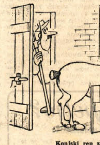
Konjski rep za »konjski rep«

Moja stari deveti rojstni dan in gleda, kako ji mama zatika v torto devet svečk. »Mama, zakaj pa nsi raje spekla devet tort in dala samo eno svečko?«