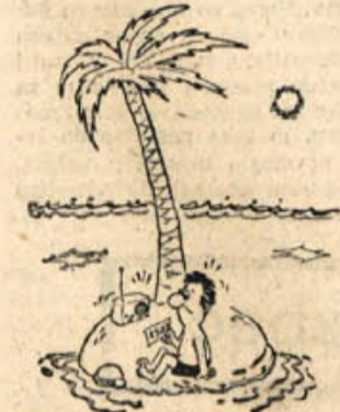
Obveščamo srečnega lastnika srečke številka 1307, da je danes zadnji rok za dvig stotimilijonske premije...

Med vojno ponoči je začel sovražnik bombardirati mesto. Mož plane iz postelje, zbudi ženo in pravi: »Teciva v klet!« »Počaka,« odgovori žena, »da vzamem umetne zobe...« »Hudiča kaj boš z zobmi, saj ne padajo sendviči, ampak bombe!«