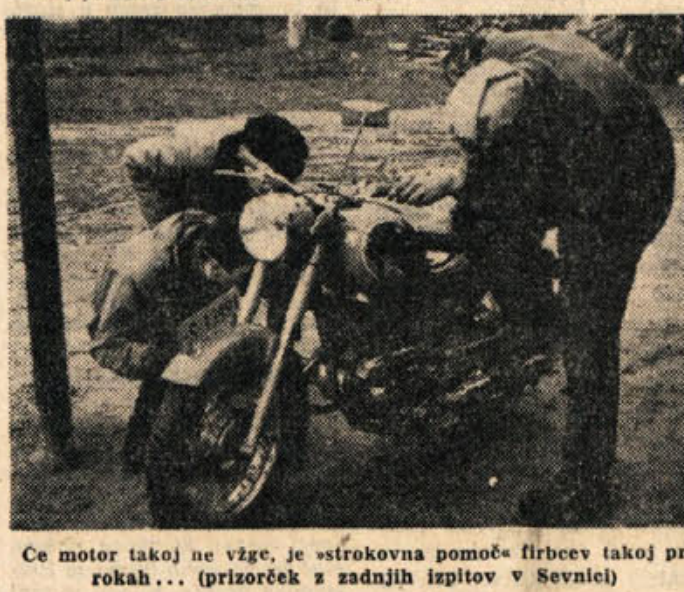
Ce motor takoj ne vžge, je «strokovna pomoč» firmev takoj pri rokah... (prizorček z zadnjih izpitov v Sevnici)

Do konca januarja morajo opraviti vse strelske družine tekmovalne zračno puško za «Zlato puščico». Rezultati, katere je prejel OSO Novo mesto, kažejo, da imajo družine v svojih vrstah že