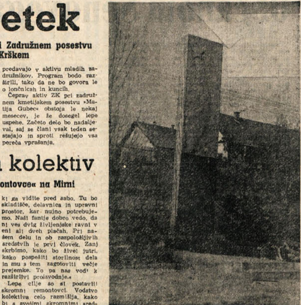
Spomenik padlim borcem, talcem in žrtvam fašističnega nasilja na Senovem

Vodenje dokumentov v aktivih LMS. Kulturno prosvetno delo med mladino. O vodenju sestankov. Kaj mora voditi predavatelj in slušatelj. Petletni načrt razvoja gospodarstva FLRS. Gospodarski problemi novomeške komunne, Pomen delovnih akcij in njihova organizacija. Program Zveze komunistov. Vloga Jugoslavije v svetu in naša zunanja politika.