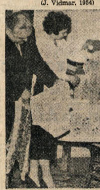
Igrali »AMBASADORJA«, ki so ga lani igrali na Senovem

Ce ni mogoče reči, da je Prešeren tvorec slovenskega naroda, je gotovo usaj njegov čudežni Orfej in gotovo je, da se je usoda tega naroda v marsičem oblikovala, kakor se je, zaradi njega. (J. Vidmar, 1954)