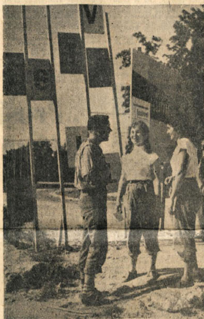
X. novomeška MDB — delovilače v Srbiji od 1. septembra do 31. oktobra.