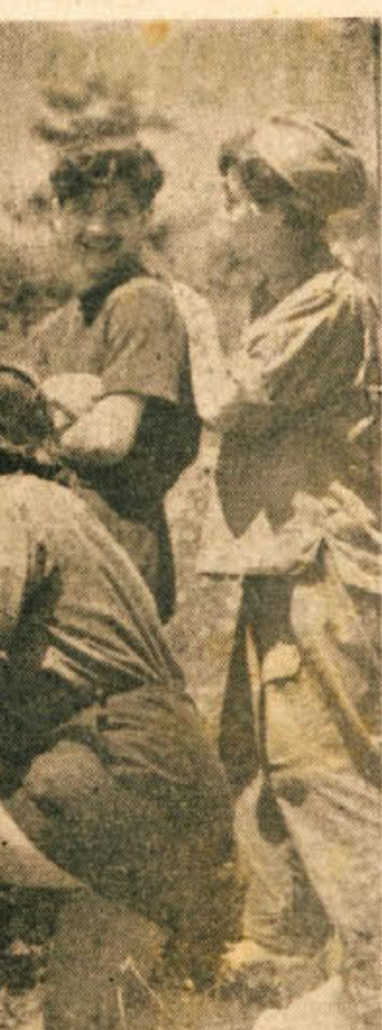
Prestavljali so hribe in jih znova gradili tam, kjer je to bilo potrebno. Jurij je sledil jurisu, na grafikonu pa so rasli kubiki, tisoče, desetstisoče kubikov. Tu je mlada generacija naših narodov znova potrdila, da prav v ničemer ne zaostaja za borbenostjo Skojeveev in za požrtvovalnim pletom ter ljubeznijo do domovine, ki jo je tako plemenito izpričal v osvobodilni vojni naš mladi rod.