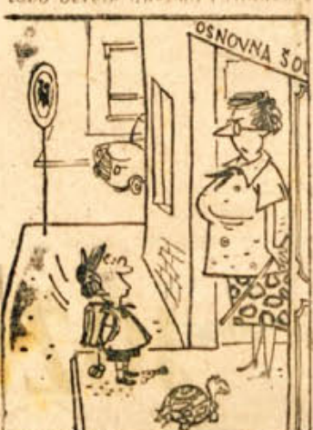
»Veste, slučajno sva imela isto pol...«

NOVA MOČ V PODJETJU »Tovariši in tovarišice, na- še podjetje je dobilo novega blagajnika. Mislim, da mi ni treba govoriti o njem, saj go- toro berete dnevno!«