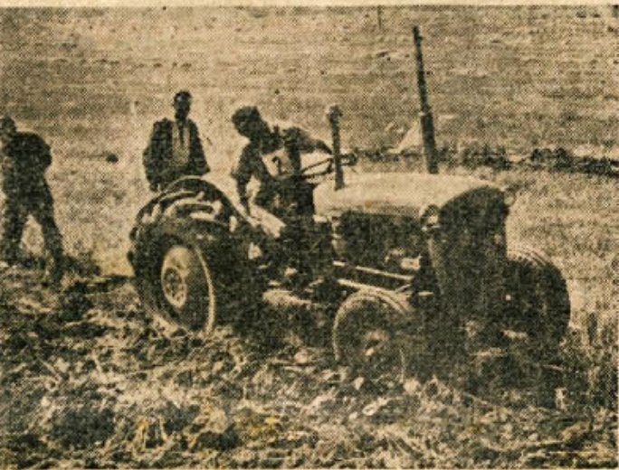
Hitreje, globlje in bolje, pa še ceneje nam dela traktor. Nobene zadrage si ne moremo več niti predstavljati brez sodobne strojne opreme, katere nakup omogoča država z ugodnimi krediti.