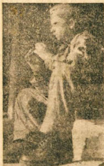
»Ko prideš v Drago, vprašaj me za Aco, saj me vsi po- znajo...»

Potem mi je še dolgo mahal iz avtomobila. In moral sem mu obljubiti, da ga bom obi- skal v naselju.