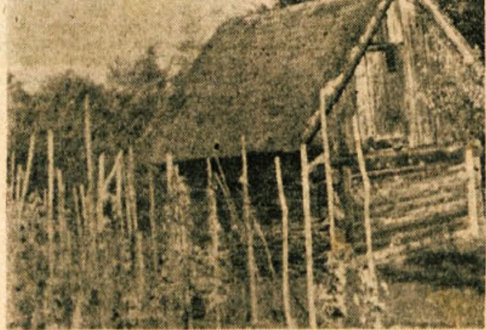
Jesensko tložišče pred zidnico na Libni

V istem času so bili izvršeni proračunski izdatki v višini 221.292.000 din ali 55,7%. Izvršeni izdatki kažejo navidezno nizke odstotke, vendar temu ni tako. Upoštevat moramo, da so se mo-