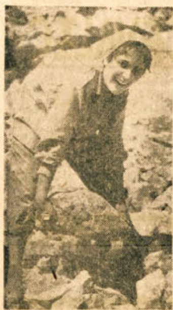
Zdaj je taka fotografija res še samo prijeten, lep spomin...

on srečuje prvič. Oba imava še malo let in nemara se prav zato zdi mama, da Krka očarljivo žubori, čeprav se dobro spominjam, da je še danes popolnoma bila kalna in nepri- vlačna.