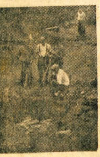
Ribiči pri žalostnem delu...