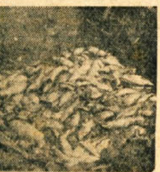
Nad 8000 kg mrtvih rib so pobrali črnomajski ribiči samo v 2 dnevih iz zastrupljene Dobljice.

Strokovnjaki bodo ugotovili, na kak način je prišlo do zastrupitve v tako velikem obsegu.