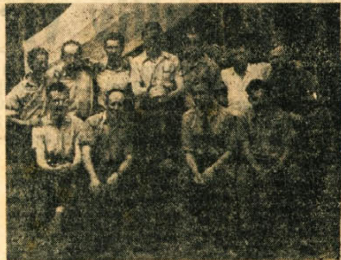
Komandni kader tabora predvojaške vzgoje okraja Novo mesto

Dva fanta žagata drva, eden jih cepi, dva pa delata v kuhinji. Dežurni je ravnokar predlagal šotore: »V četrtem šoto-