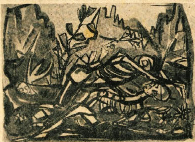
Vlado Lamut: SPOMIN NA SUTJESKO

Od kamenitih pečin odmeva bobnenje streliv in zadetkov, črni oblaki dima prahu pred nami in za nami stalno rastejo... Sprito nepretrgane kanonade, sovražnikove artilerije in naših bomb padamo in spet vstajamo. Gozdovi in posamezno drevje se nam zdi v plamenu. Vsa okolica smrdi po žveplu — njegov dim se dviga od eksploziji granat in mitraljejskih rafalov.