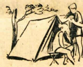
omogočila počitnice v Bakru. Prva skupina bo odpotovala že 7. julija.

V Crikvenici bo 54 otrok v centralni koloniji Društva prijateljev mladine preživljalo prijetne počitnice. Gasilska zveza bo 15 najboljših gasilcev poslala na letni oddih v Pacug. Tudi za otroke padlih borcev je lepo poskrbljeno. Zveza borcev bo okoli 120 otrokom