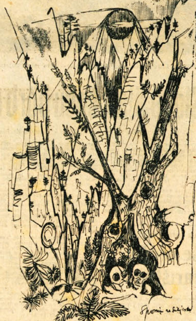
VLADO LAMUT: SPOMIN NA SUTJESKO

Zvezde na jasnem nebu pa svetijo kakor večerj, kakor pred letom in kakor bodo tudi prihodno noč.