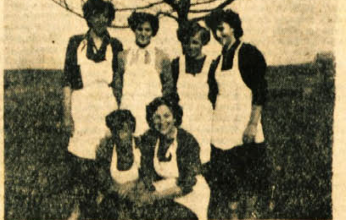
šupina deklet, ki so obiskovale gospodinjstvi tečaj v Straži, je vesela in zadovoljna, ker se je marsikaj naučila. Tečaj je organizirala mladina, stroške pa sta deloma krila KZ Straža in ObLO

● MLEKO SE TUDI V POLETNI vročini ne sesiri, če kozoico, v kateri kuhamo mleko, izplaknemo z borakovo vodo ali pa vržemo v mleko za nožovo konico jedilne sode.