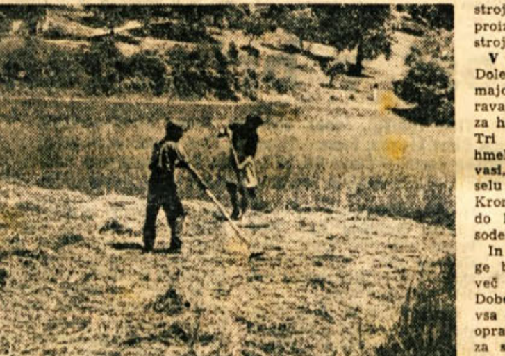
Prva košnja je skoraj povsod že končana. Sena je manj kot je prvotno kazalo, ker ga je stisnila suša v maju

farovških hlevih ter še v enem prostoru urediti pitališča goveje živine za 40 glav. V mnogocem je to odvisno od upravnega odbora, kako bo odločil. Ze zdaj razmišljajo o skladiščih, ki bodo kmalu potrebna zaradi povečanja kmetijske proizvodnje. Za gradnjo bodo potrebovali približno milijon in pol dinarjev. Kmetijska zadruga Mirna je letos popravila vse stroje. Dobili so tudi kvalificiranega strojnika, tako da so izpadi v proizvodnji zaradi okvar na strojih in bodeče izključeni. V Smarjeti se kot povsod na Dolenjskem kmetje zelo zanimajo za hmelj. V jeseni nameravajo pripraviti vse potrebno za hmeljeve nasade v letu 1959. Tri do pet hektarski nasad hmelja bodo uredili v Gorenji vasi, pet hektarski v Luterskem selu in pet hektarski nasad v Kronovem. Za vse površine bodo kmetje sklenili pogodbe o sodelovanju s KZ. In še nekaj za konec: zadruga bi morale posvečati veliko več pozornosti traktoristom. Dober in vreden traktorist, ki vsa dela temeljito in v redu opravi, je najboljša propaganda za strojno obdelavo v kmetijstvu. Naši traktoristi so marsikje žal še zelo površni, zadruga pa ima potem dovolj tega samo težave s kmeti.