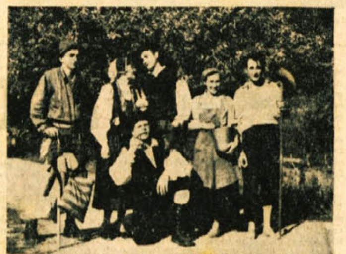
Igralci Snelgulčice so navdušili staro in mlado Dobričnu in v Žužemberku, »er veselogro s petjem »Svoje glavočke«, ki so jo igrali za zaključno.

ček tedna mladosti. Z obema so poželj lep uspeh. Dramska sekcija si je nabavila tudi nove kulise in zaveso, ki je bila nujno potrebna. De-