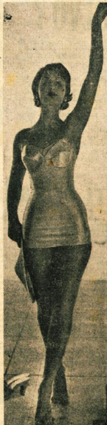
Poglejte jo, kako je ljubka! Tudi ve ste v primerni kopalni obleki lahko take. Močnejšim pripravljamo elastične kopalne obleke, drobnim in lepo zalitim pa take iz navadnega blaga, lahko rožastega ali enobarvenega.

Fant, lepo rasel, zdrav, močan, da bi ga bilo veselje pogledati. A kaj bo iz njega? Ali ga morejo v šoli prevzgojiti v fanta, katerega značaj po klen kod njegova rast? Gotovo je njegovega očeta vzgajal prav takšen oče in ta prenaša vzgojo z deda na vnuka. Jo more šola zajeti? Pri tem in onem uspe, ostanje pa le še Matič, ki kljub naporom nesrečnih mater in potrpežljivih učiteljev, profesorjev, vodij krožkov in mladinskih organizacij ostanejo takšni, da ljudje nad njimi ogročno negodujejo: »Uh, kako je surov!«