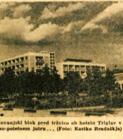
Novi stanovanjski blok pred tržnico ob hotelu Triglav v pomladno-poletnem jutru...