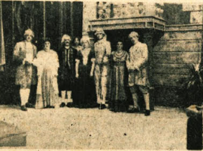
Prosvetno društvo MIRAN JARC v Crnomlju je pred kratkim nastopilo doma s »Prevaranim soprogom« Mollera, ponovilo pa ga je medtem tudi na gradskem odru. Kjer so crnomljski igralci poželi prav tako velik uspeh. Na sliki: po zaključni sceni v Crnomlju.