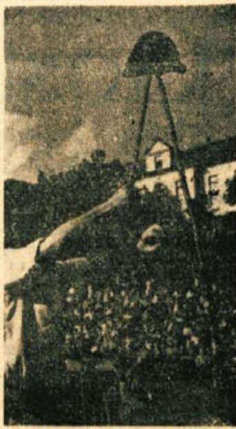
Na koše smeha je vzbudila med več kot 1500 gledalci živahno sestavljena igra pionirjev z žogami in klobučki, s katero so nastopili na tolednem nastopu novomeškega učiteljskega vladnice v nedeljo, 1. junija, na Lokih