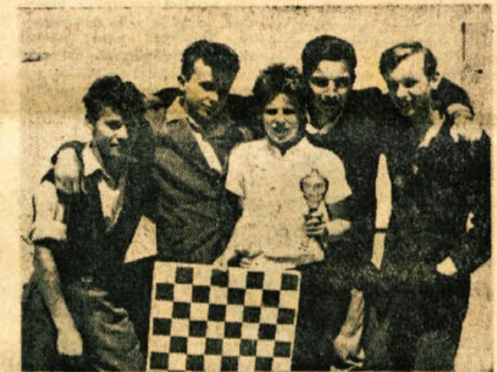
Pionirji novomeške gimnazije (starejša skupina) so zmagali na okrajnem prvenstvu

V okraju so 4 kmetijske šole. Nujno je sestaviti nov učni program, ker dosedanjih gojencev ne usmerja pravilno in se zaposlujejo po šoli celo v drugih strokah. Učni program bi moral imeti več praktičnega znanja, uporabnega v našem kmetijstvu. Svet za kmetijstvo bo skupno s svetom za