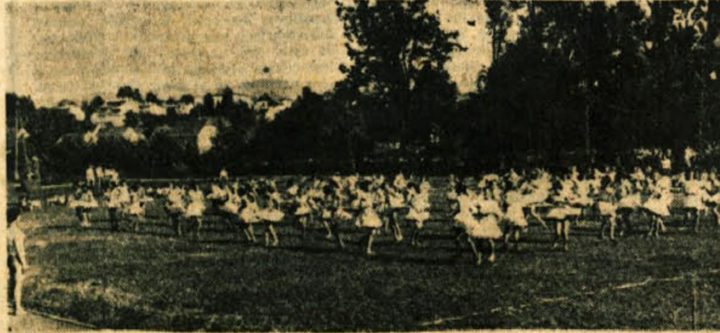
Kakor beli cvetovi in pisani metuljčki so bile plonirke na velikem telovadnem nastopu novomeške učiteljice in vladnice v nedeljo, 1. junija, kdor jih je videl, temu se je nasmejalo srce ob sproščeni, rajajoči srečni mladosti, ki se je smejala in uživala na zeleni Loki...

V drugi polovici tekočega tedna pogoste krajevne nevihte, ki bodo proti koncu tedna presle v trajen dež z močno ohladitvijo. V prvi polovici prihodnjega tedna lepo vreme in postopno topleje, a v drugi polovici tedna zopet nestalno s pogostimi padavinami. Hkrati je možen tudi trajen dež.