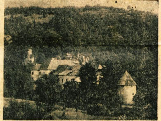
(Pogled na grad Pobrežje pred zadnjo vojno)

Po okoliških vaseh je sovražnik pobral kmetom živino, vozove ter zažgal hiše z gospodarskimi zgradbami vred. Tedaj so zagorele vasi: Pobrežje, Purga, Adlešiči, Gorenji, Vrhovec, Velika sela, Mala sela in naslednji dan še velika vas