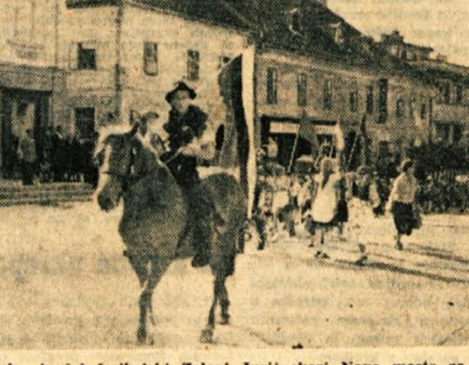
Tako je sel šmihelski Zeleni Jurij skozi Novo mesto za letošnji Dan mladosti. To je bilo veselja, pesmi, sreče in zadovoljstva...

TUDI V BEOGRADU bodo zgradili veliko medcelinsko letališče, ki bo oddaljeno od mesta 17 km. Novo letališče pri Surovinu bo največje v južni Evropi; tu bodo lahko pristajala od 135 ton teška letala, med njimi tudi znano sovjetsko letalo TU-114. V eni uri bo lahko novo letališče odpravilo do 40 letal.