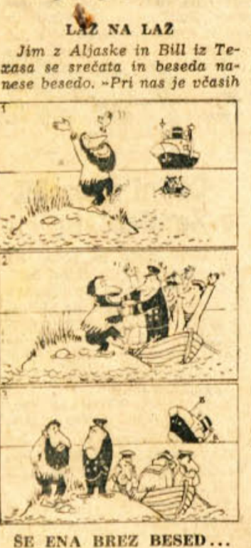
SE ENA BREZ BESED...

tako mraz,« pravi Jim, »da moramo pod krave postaviti grede, da jih lahko pomolze-mo, ker jim v vimenu zmrzne mleko.« »Vaš mraz je res hud,« odgovoril Bill, »vendar malenkost v primeri z našo vročino. Velikokrat je tako vroče, da moramo dajati kokošim piti vodo z ledom, sicer bi znesle trdokuhana jajca.« GALANTNOST »Joj, dragica, kako te je vipo-pejšalo!« »Vino? Saj nisem pila.« »Ti ne, ampak jaz...« VSE JE PREDVIDENO »Veste, tale desen na blagu pa ni lep...« »No, lep res ni,« odgovoril prodajalec, »Toda veste, tovarišča: tovarna jamci, da bo pri prvem pranju izgini!« BLAGAJNIŠKA »Greš na tramvaj?« »Ne, jaz se nikoli ne vozim s tramvajem. Tam je zmerom kontrola.«