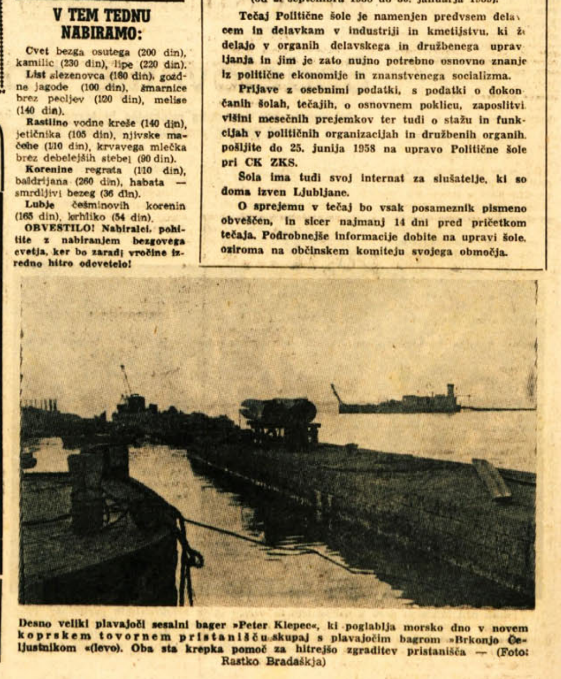
Desno veliki plavajoči sesalni bager »Peter Klepec«, ki pogloblja morsko dno v novem koprskem tovarnem pristanišču skupaj s plavajočim bagrom »Brkonje Čeljustnikom« (levo). Oba sta krepka pomoč za hitrejšo zgraditev pristanišča

Tečaj Politične šole je namenjen predvsem delavcem in delavkam v industriji in kmetijstvu, ki ž delajo v organih delavskega in družbenega upravljanja in jim je zato nujno potrebno osnovno znanje iz politične ekonomije in znanstvenega socializma. Prijave z osebnimi podatki, s podatki o dokončanih šolah, tečajih, o osnovnem poklicu, zaposlitvi višini mesečnih prejemkov ter tudi o stažu in funkcijah v političnih organizacijah in družbenih organih, pošljite do 25. junija 1958 na upravo Politične šole pri CK ZKS. Sola ima tudi svoj internat za slušatelje, ki so doma izven Ljubljane. O sprejemu v tečaj bo vsak posameznik pisмено obveščen, in sicer najmanj 14 dni pred pričetkom tečaja. Podrobnejše informacije dobite na upravi šole, oziroma na občinskem komiteju svojega območja.