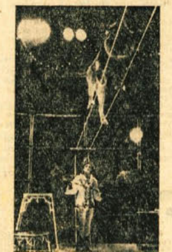
LETECI LEV. — Ena izmed glavnih znamenitosti moskovskega cirka so levi, ki se sprejehajo po žici. Doslej namreč še nikomur ni uspelo, da bi te divje živali tako zdesirali. Kot vidimo na sliki, se mogočni »sakrobat« na dveh žicah kar varno pohtul

Med 520 tisoč oljk, kolikor jih danes raste v ozkem in kraksem pasu Črnogorskega Primorja, jih je malo, ki se morajo zavarovati neobičajni odredbi, ki je veljala na koncu prejšnjega in v začetku sedanjega stoletja. Da bi čimprej vpejala gojitev tega koristnega drevesa v Primorju, kjer sta zemlja in podnebje zelo ugodni za oljko, je črnogorska vlada izdala ukaz, da mora vsako gospodarstvo zasadi 100 oljk. Za tiste, ki bi tega ne storili, so bile predpisane hude kazni.