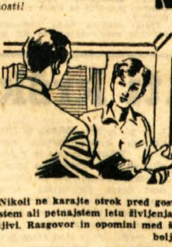
Nikoli ne karajte otrok pred gosti. Posebno ne otrok v štirinajstem ali petinajstem letu življenja, ker so se prav posebno občutljivi. Razgovor in opomini med štirinajstimi otroki bodo zalegli veliko bolj.

Oče sinu: Kako vendar sediš? In s čim neki si se danes zjutraj počel? Mar misliš, da je res moderno, da nosijo dečki dolge lase in kodre? Kako smešno!