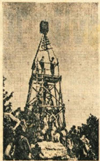
Stolep na Debelem vrhu (864 metrov) s čudovitim razgledom po Beli krajini je bil kar kmalu naš

Prebudilo nas je hladno, a lepo jutro; ogenjki so znova vzplapolali. Po zajtrku smo se založili z vodo, nakar smo spet prislunili tovaršem Simecu in Romaniču, kako je bilo tu pred 17 leti. Pripovedovanje starih partizanov, ak-