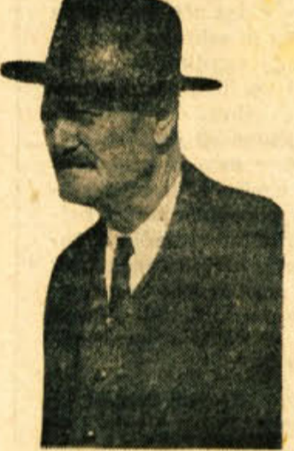
in želimo še mnogo let plodnega dela, zdravia in sreče v krogu njegovih dragih!

Obdar živ in Novem mestu ni bil nikdar tožen niti ni sam nikogar tožil. S poštenim delom in dostojnim življenjem si je zgradil v Novem mestu lep dom in je prepričan, da mu tudi Amerika ne bi mogla dati kaj več. Prosil nas je, naj vsem strankam, ki so obiskovale ali še obiskujejo njegov lokal, izrazimo njegovo hvaležnost. Mi mu pa ob rednem jubileju toplo čestitamo.