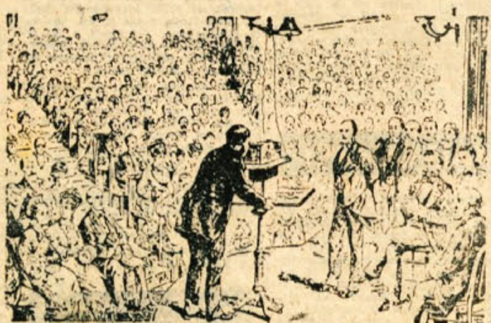
Graham Bell prikazuje svoj izum 15. marca 1877.

DVA IZUMITELJA 24. februarja 1876. leta je prišel v Patentni urad v Washingtonu neki Amerikanec z za-