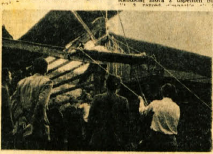
ŠKROPLJENJE KROMPIRJA. OBČIJSKI OČISTNI ORGANI NA TEJ OBLASTI V LJUB. ZUPICANI S PRAKTIČNIMI VAJAMI REŠAVALI LJUDI (KOTRAJ SVOJE KOLEGE, UDELEŽENCE TEJAJA) IS SRUŠEVINS. Z NASORAMNIM POUKOM JE BIL TEJAJNOM, KI SO VSI ODBORNIKI CIVILNE ZAŠČITE IZ VSEH NAŠIH OBČIN, ZELO USREJENO.

Nekolikovanih prošnji ter prosti besedilni listini ne bomo upoštevali. V izjemnih primerih bodo sprejeti v vse tri odeske tudi učenci z manjšo šolsko izobrazbo, če uspešno opravijo sprejemni izpit. Pri šoli je Internat, ki nudi učencem vsa potrebna. Kandidati izven Zagorja, ki želijo stanovati v internatu, morajo to navesti v prošnji. Vpis v šolo traja do 25. avgusta 1958. Kandidat se lahko vpiše osebno ali pa pošlje prošnjo po pošti. Ravnateljstvo Industrijske rudarske šole Zagorje ob Savi.