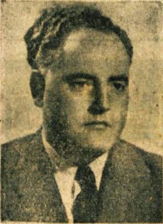
JOŽE BORŠTAR, poslanec zveznega zbora

NOVO MESTO 98,5 — TREBNJE 96,6 — STRAŽA-TOPLICE 96,1 — METLIKA 92,4 — MIRNA 92,1 — MOKRONOG 90,3 — SEMIČ 90,2 — ŽUZEMBERK 90,2 — ŠENTJERNEJ 86,8 — KOSTANJEVICA-PODBOČJE 85,2 — ČRNOVELJ 85,1.