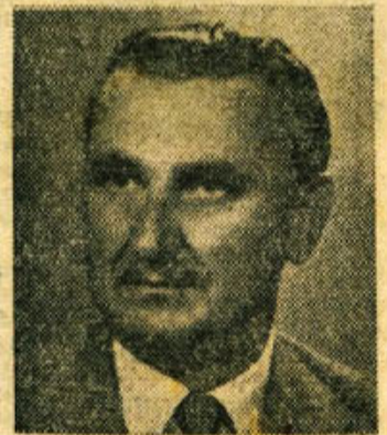
FRANC PIRKOVIČ, poslanec republiškega zbora