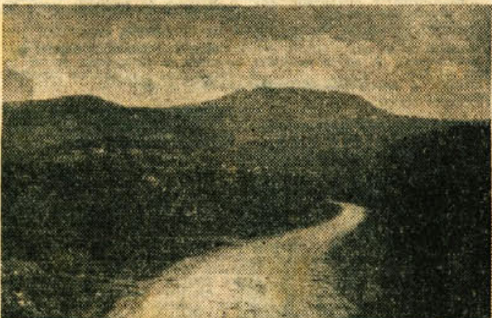
Pogled na Gorjance, v sredini Trdinov vrh — starodavna »Kukov. gora«

Enega pa uporablja Gospodarska poslovna zveza, h.h. »smpatizerjev«, ki se »činu« ne bi odrekli, če bi... V našem okraju je 28 vozil. Kakor vidimo so se začnje