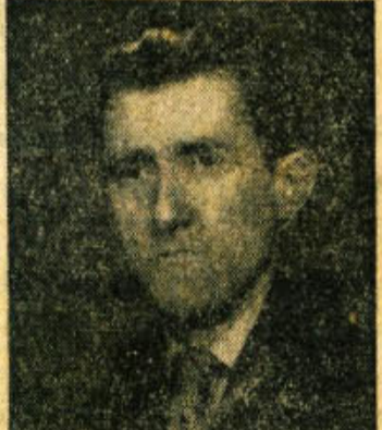
VIKTOR ZUPANČIČ, poslanec republiškega zbora