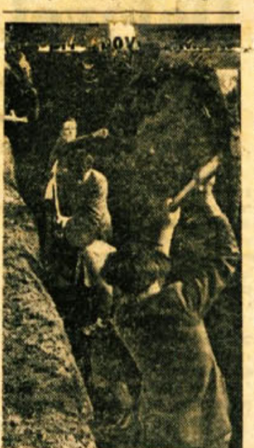
Brigadam so priskočili na pomoč ljud novomeski srednješolci in pomagali kopati jarke za vodovod pri Ločni in Mačkovecu. — Njihova brigada bo šla na avto cesto Sepe poleti.

Predvolilno zborovanje je potekalo brez poročil, ker jih bodo brali na volitvah. Ko so sprejeli kandidatsko listo, so delavci pričeli razpravo o nejasnostih v nagrajevanju. Bilo je nekaj vroče kriz zaradi popravka norme. Podjetje je vpeljalo delno strojno obdelavo, razen tega pa je proizvodnja razdeljena na strogo lo-