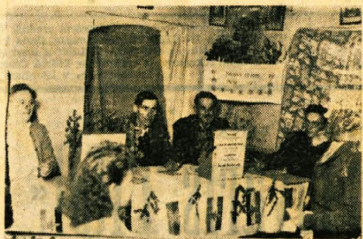
Takole je bilo na volišču v Grčvrhu

ni volil. Zaradi tega smo imeli udeležbo le 99,83 odstotno, se glas drugo obvestilo. Okoli Novega mesta so na predvečer volitev zakurili mladinci nekaj kresov. Na Dvoru je godba igrala že ob petih zju-