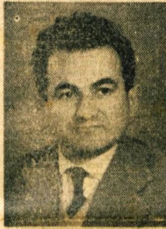
NIKO BELOPAVLOVIČ, poslanec zveznega zbora