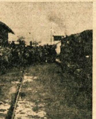
Takole so pozdravili v Trebnjem prejšnji teden prihod prvih brigad na avto-cesto Ljubljana-Zagreb

Od vašega dela je odvisno, ali bodo materialna sredstva, s katerimi razpolagamo, in o katerih odločate, uporabljena tako, kakor to terjajo interesi posameznikov in interesi skupnosti!