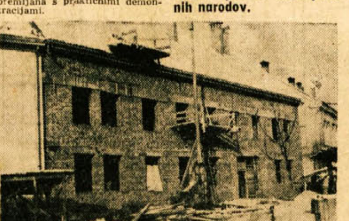
Pod streho je tudi že stavba okrajnega zavoda za socialno zavarovanje v Novem mestu. Na vselitev težko čaka zavod in njegove številne stranke, ki se obračajo nanj glede pokojnin, invalidin in podobno.

Tudi v namiznoteniški klubu še ni vse tako kot bi se želeli. Sedaj rekviziti v glavnem niso več problem, velik problem pa so postali prostori. Klub razpolaga s štirimi mizami, ki jih pa nima kam postaviti. Že v januarju so misli organizacije pionirsko namiznoteniško šolo, toda vprašanje prostorov je vse postalo na glavo. Tekmovalni uspehi niso bili majhni, čeprav se klub še ne more postaviti s kakšnimi vrhunskimi uspehi. Teniški klub se je lani z dograditvijo igrališča postavil na trdne noge. Sedaj ima osnovne pogoje za napredek, večji problem so le še rekviziti, ki so precej dragi, in pa oskrbovalni stroški. Kakor pri namiznoteniškem klubu, tako je tudi v teniškem klubu težko finančno stanje pereč problem. Namiznoteniški klub se ni mogel udeležiti vrste tekmovalj, ker ni bilo denarja. Plavalni klub je med vsemi najmlajši. Je organizacijsko š neutrinje. Glavna akcija je bila organizacija plavalne šole, ki je klub slabim pogojem (slabo vreme) uspešno opravila svojo nalogo, saj se je lepo število pionirjev in pionirk naučilo plavati. Po poročilu upravnega odbora, blažnjaka in nadzornega odbora je bil stari odbor razrešen, nato pa so izvolili nov upravni odbor, ki ga sestavljajo: predsednik Nibo Križanec, podpredsednik inst. R. J. tajnik Miro Verbič, blagojnik Nika Meden, člani Stari, Kozina, Milke, Doljak, Lilija in drugi. Glavna naloga društva v prihodnjem obdobju bo organizacijska udeležba v klubih in šolah čimvečje množičnosti. P. M.