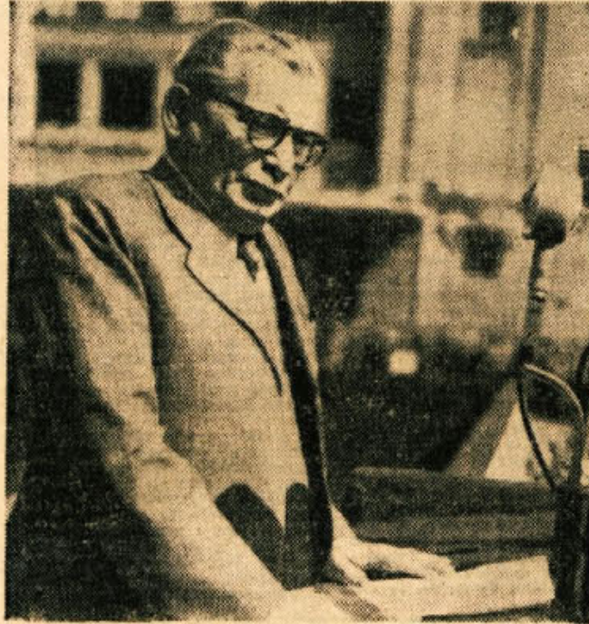
Moša Pijade, velik državnik, umetnik in do kraja predan komunizem, med svojim nenehnim delom skrajni ni poznal počitka. Ob prvi obletnici njegove prerane smrti se je spomnil velikega bora in revolucionarja poklonila vsa domovina.

Vtem ko so poslanci 21. decembra lani zadnjič zapuščali klopi v Skupščini, se je novinarju na galeriji za trenutek zadelo, da za predsedniško mizo spet vidi znani lik pokojnega predsednika Moše Pijade. Tudi ta zadnja seja skupščine tretjega sklicanja se je razvijala po proceduri, za katero se je Moša Pijade toliko prizadeval in jo tako spoštoval. Za Mošo Pijade poslovnik ni bil samemu sebi namen. Čeprav ustvari in izborni zakoni — je pisal še leta 1953 — dovolj obveščajo o karakterju in vlogi parlamenta in njegovih domov, kakor tudi o