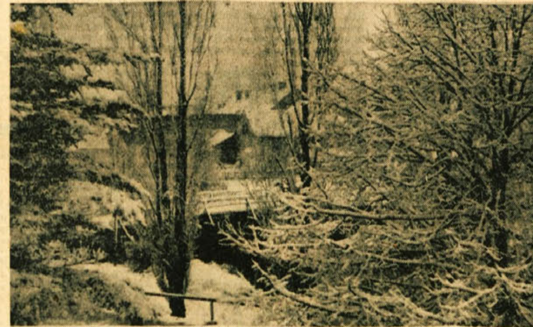
KO SMO PRETEKLI TEDEN POROČALI O »SREDZIMSKI POMLADI«, JE ŽE MED SESTAVILNIM DOLENJSKEGA LISTA V TISKARNI SPET NO, ZIMA JE ŠE POŠTENO MAHNILA S LEDENIM REPOM BOTO, 22. FEBRUARJA POPOLNE, JE PO DEŽU ZACELO RAČUNAL ŽE Z ZGODNJO POMLADJO JE PREVIDNO RAJE NIMAJO LAHKEGA DELA: BRALCI NAŠEGA TEDNIKA PA VENDORLE LAHKO VERJAMEJO NASI TEDENSKI NAPOVEDI, SAJ JE DRŽALA TUDI TOKRAT... — NA SLIKI: TAKOLE JE FOTOREPORTER DOLENJSKEGA LISTA UJEL KOSTANJEVICO

Na okrajnem komiteju mladine so nam povedali, da so že tudi prijave za srednješolsko brigado preslele planirano število. Kaže pa, da zaradi velikega števila prijav tudi po drugih okrajih in republikah ne bo mogoče sprejeti vseh prijavljencev v brigado. Tisti, ki letos ne bodo mogli na akcijo, bodo drugo leto prvi upoštevani za nadaljevanje dela na odseku avto ceste Beograd—Djevdjevlja.