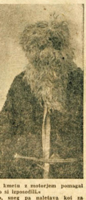
Kostanjevica na Krki Pustni torek 1958

brazevalnih šol (všete so nižje gimnazije Mirna peč, Stopiče in Smarjeta). Po več ali manj zanesljivih podatkih je v novomeški občini odpadlo na vseh šolah zaradi bolezni 10,1 dneva pouka, zaradi sindikalnega dela 2,1, zaradi izletov in ekakurzij 1,8, zaradi uradnih konferenc 2,5, zaradi raznih vzrokov 2,8, skupaj torej 14,3 dneva. Službena potovanja, tečajji študijski in bolniški dopusti, delo v družbenih organizacijah in družbenem upravljanju je v posameznih oddelkih preprečilo reden pouk 80,4 dneva. Nadomestovanje je bilo možno oršarnizirati le 34 dni. Vedeti pa moramo, da pouk v času nadomestovanja po kvaliteti ne odgovarja rednemu. Vsa družba je odgovorna, da v bodoče po nepotrebnem ne bomo zapirali šolskih vrat! S šolskim obiskom, razen zaradi objektivnih razlogov, ni bilo posebnih težav. V gimnazijskih razredih je torej le malo neopravičenih zamud zaradi domačega dela v nasprotju z oddelki ostalih obveznih šol. Zaradi kroničnih šolskih proračunov se zbirka učilj skodaj ne večajo. Največ razumevanja ima skoraj občinski ljudski odbor v Metliki, saj je šola leto dni dobila za 150.000 din učil, čeprav je aprilo potreb tudi ta vsota majhna. V Mokronogov niso mogli nabaviti prav ničesar, prav tako ne v Žužember-