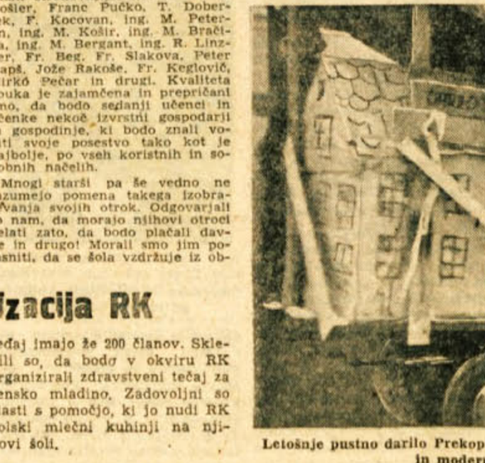
Letošnje pustno darilo Prekope Kostanjevičanom: prevoznik hotel in moderno gostišče...