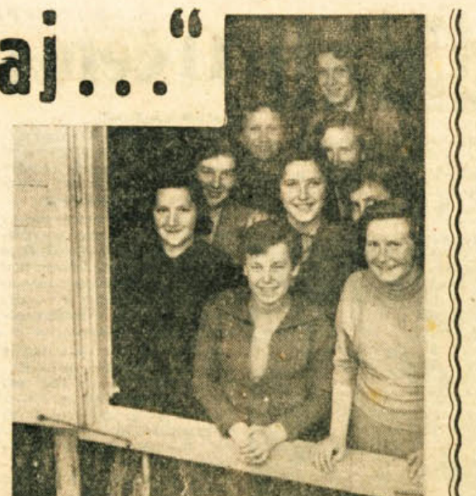
ČETA ALI MATER, NEKATERIM PA OBA, JIM JE VZELA VOJNA. ZVEZA BORCEV JIM NADOMESTUJE ZDAJ STARŠE IN DOMACE OGNJISICE. ZATO, SO GOIENKE NOVE DVOLETNE ADMINISTRATIVNE ŠOLE V NOVEM MESTU VESELE IN NASMEJANE, KO ČUTILJO TOPLO SKRB ORGANIZACIJE, KI JIM BO POMAGALA DO POKLICA IN VSTOPA V ŽIVLJENJE.

bomo izžebali III nagradnega nove letnega nagradnega žrebanja, v katerem bodo sodelovali vsi stari in novi naročniki, ki so do 31. januarja poravnali celoletno ali polletno naročnino. Vsem naročnikom, ki nas pisмено ali po telefonu sprašujejo, kdaj bo žrebanje, sporočamo, da bomo dobite izžebali takoj, ko bodo prekinjena vsa vplačila naročnine. Računamo, da bo to še v prvi polovici prihajajočega meseca. Dotlej pa, prosimo, potrpite.