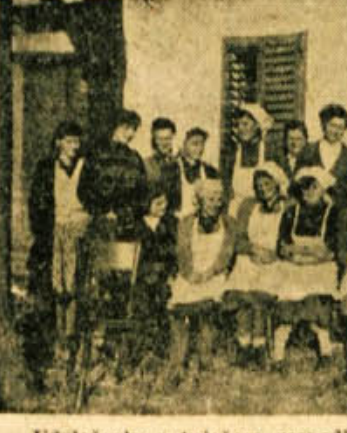
Udeležence potujočega gospodinskega tečaja v Adlešičih