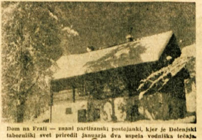
Dom na Frati - znani partizanski postojanki, kjer je Dolenjski taborniški svet priredil januarja dva vselna vodniška tečaja.

iz mnogo znanja in da se zaveda, to odgovornosti avojeza dela. Prirčno je bilo slovo od domače družine. V dolgi koloni so se udeleženci drugega tečaja prebijali skozi pol metra visoko snežno odejo v smeri proti Straži. Lepo, a naporno je bilo gaziti v celo. Po dveh, treh urah take hoje so nove postajale težke kot svinec. Vsa sreča, da je sijalo sonce in da ni bilo vetra. Frata bo ostala vsem udeležencem tečaja v najlepšem spominu. Posebej gre zahvala organizaciji Zveze borcev, ki je dala na razpolago Dom na Frati Dolenjskemu taborniškem avetu, da je lahko organiziral oba tečaja za vodnike. Sivi Javlovec