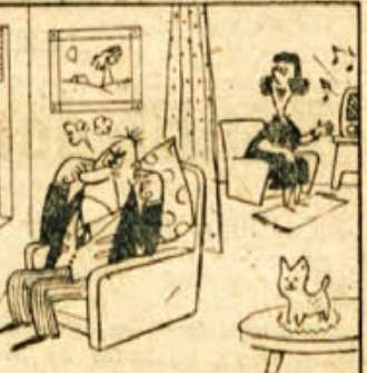
»Postušaj, dragi! Zdahte igrajo valček, ki si mi ga podaril na dan poroke!«

Na dalmatinski reki Krki šumi voda v enem naših najlepših slapov — Manojlovcu. Visok je 52 metrov, širok pa sto metrov. Na Krki je tudi slavni Skradinski Buk — »Jugoslovanska Niagara«, kjer pada voda čez 17 pragov v globino 46 metrov. Vodopad Skradinava, v katerem pada rečica Vogošća, pritok Bosne, z višine 98 metrov zavzema prvo mesto med jugoslovanskimi jezovi. Med najlepše vodopade v Evropi štejejo Pirtvice, kjer pada voda v več curkih čez robove v globino 70 metrov.