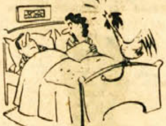
»Zdaj je pa dovolj tega! Še danes nesj budilko popraviti!«

Iz Kanade poročajo o nadaljnem porastu brezposelnosti. V mestu Torontu se je število ljudi, ki iščejo zaposlitev, v enem tednu povečalo za 3.558 ljudi, vseh brezposelnih pa je bilo v tem mestu v začetku januarja 47.183. V mestu Windsor je bilo ta čas nezaposlenih 20.748 ljudi ali 20 odstotkov vse delovne sile v mestu. V tem mestu so brezposelni organizirali povorko in zahtevali javna dela v mestu, da bi prišli do zaslužka. Povorko je organiziral sindikat avtomobilskih delavcev.