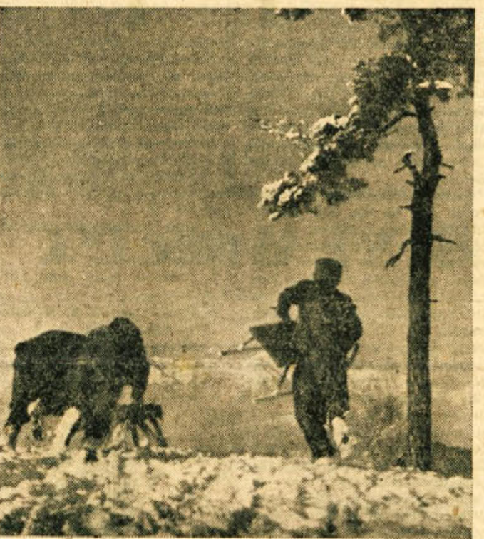
Zdaj pa le urno navzdol, dokler je še kaj belega na bregu...

gleda na število članstva (105) lahko bilo društveno življenje vsestransko mnogo bolj razvijano. Organizacija je bila prav gotovo dobra, odtegovali pa so se mnogi od konkretnega dela. Da bi bilo v bodoče tudi v tem pogledu bolje, je društvo ponovno izvolilo širši odbor, ki bo imel še sodelavce v raznih sekcijah.