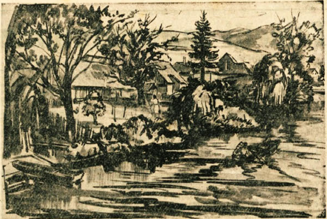
Vlado Lamut: DOLENJSKA POKRAJINA (1957)