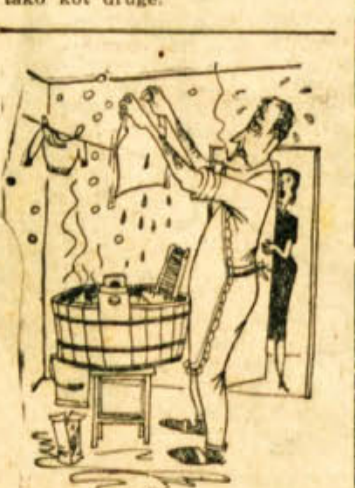
»Ali boš zdaj še trdil, da ne potrebujemo pralnega stroja?«

Riž na pol skuhamo in ohlajemo z mrzlo vodo. Rajžele in črvesno mast prevremo, zmeljemo in ju dodamo rižu, kakor tudi omenjene dišave in sol, nato prilijemo vročo juho, vse dobro premešamo in s to zmesjo napolnimo debelo (gladko) črevo. Te klobase kuhamo tako kot druge.