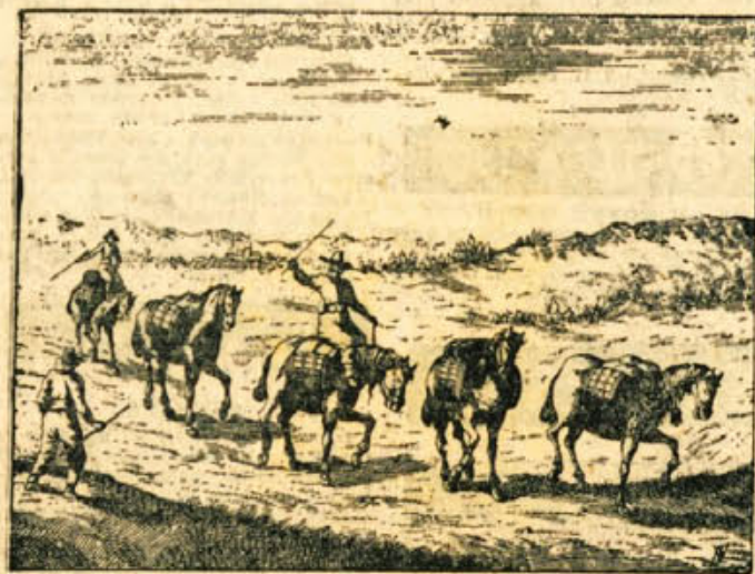
Tako so nekdo tovarniki po Dolenjskem tovorili razno blago od Trsta proti Hrvaški in iz drugih krajev (iz Valvasorja).

gledališke umetnosti. Osnove za to posredovanje naj dobi učitelj že na učiteljskem, da bo z veseljem prišel za delo, da bo znal zbrati okoli sebe ljudi, mladino, in ji vcepiti ljubezen do odreskega dela, da bo znal voditi igro in jo privesiti; do vlišne, ki je bila nekdo in je se danes ponos našemu amaterstvu. —an.