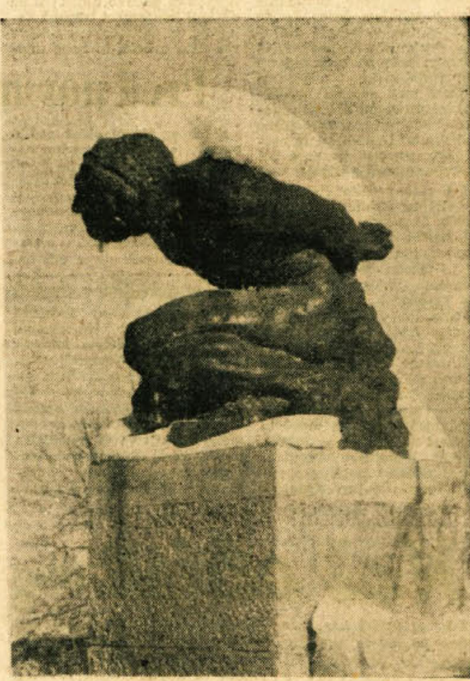
Novomeški zimski motiv

naročnikov je v minulnem tednu pridobil Dolenjski list. Veliko zaslug pri tem imajo naši sodelavci in pokrivalni poštarji, ki se prizadevno trudijo, da bi to priljubljeno glasilo Dolenjec imelo čim več naročnikov. Vse, ki nam pomagajo pridobiti naročnike, prosimo, naj bodo tudi v februarju tako prizadevni!