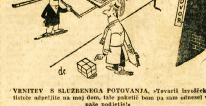
VRNITEV S SLUŽBENEGA POTOVANJA, »Tovariš izvošček! tistole odpeljite na moj dom, tate paketič bom pa sam odnesel v naše podjetje!«

Za vsa finančno knjigovodska poslašila se poslej obratujte na Društvo knjigovodij. RI