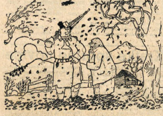
Ilustracija iz knjige »Doživljaji Nikolettine Bursac«