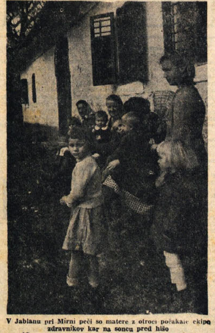
V Jablanu pri Mirni peči so matere z otroci počakale ekipo zdravnikov kar na soncu pred hišo

Predvidenih je dvajset plačilnih razredov. Najnižja plača bi bila 8.000 dinarjev, najvišja pa 33.000 dinarjev. Uslužbeni s srednje strokovno izobrazbo bodo imeli v začetku 16. plačni razred, to je 9.700 dinarjev. Uslužbeni z višjo solo bodo začeli s 15. in zaključili s 6. razredom, to je z 19.200 dinarji. Uslužbeni z višjo strokovno izobrazbo pa bodo v začetku razvrščeni v 12. plačni razred z 12.800 dinarji temeljne plače. K temu je treba povedati še kakšne bodo položajne plače. Za najvišje položaje bo znašala mesečno 22.000 dinarjev, po občinih pa do 12.000 dinarjev. Kot je znano, se bodo s tem prejemki javnih uslužbencev v prihodnjem letu povečali za 18 milijard dinarjev. To nedvomno utemeljuje tisto, kar smo povedali v uvodu. Razumljivo, da zakon ureja tudi vprašanje dopustov, odpovednih rokov in podobnih stvari.