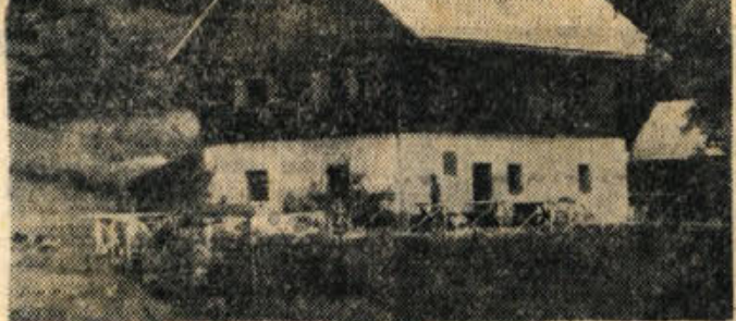
Partizanski dom na Frati vabi tudi v pozni jeseni ljubitelje narave — (Foto: Polde Pungertar)

Prav je, da se na občnem zboru tudi temeljito pomenite