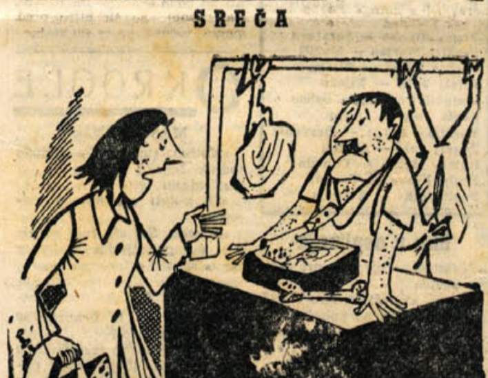
SREČA. - v časopisih piše, da za podražitev mesa ni vzroka. - Zdaj si pa predstavljajte, da bi bil! (Po »Ježuru«)