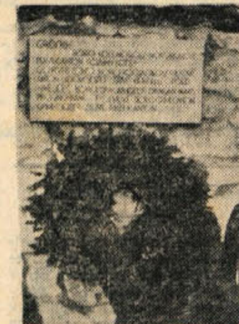
Ena izmed spominskih plošč (z imeni padlim borcem in talcem) na pokopališču v Mirni peči.

Na pobudo organizacije ZB smo na pokopališču v Mirni peči lepo uredili skupne grobove padlim borcem in talcem in jim odkrili spomenik. Oboje smo svečano odkrili na Dan