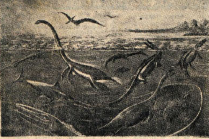
Morski prebivalci pred milijardo let

kodele in kače. Nekatere imajo na hrbtu izrastke in bodice, druge dolge vratove, tretje veličanske in ostre zobe. To je bilo razdobje kuščarjev, nekateri so bili dolgi po 30, 40 metrov. Pojavijo se tudi krilati kuščarji.