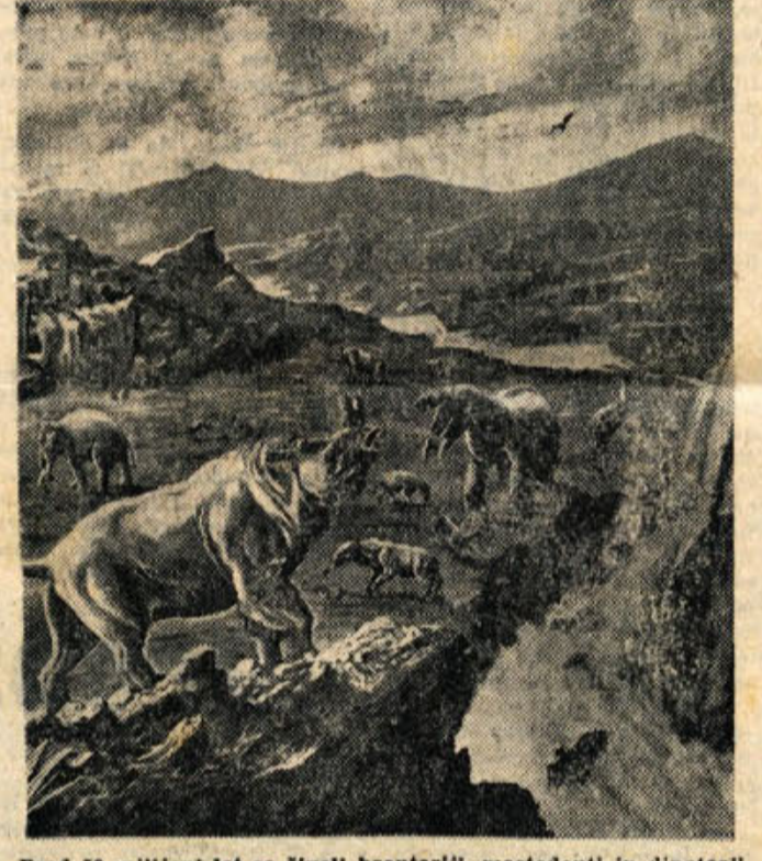
Pred 50 milijoni let so živeli bronteriji, mastodonti in dinoteriji. O človeku se ni bilo duha ne sluha, saj se je pojavil na Zemlji komaj pred enim milijonom let.

Ali gre za množično histrijo ali prenapeto domišljijo posameznikov, se trenutno ne da zanesljivo ugotoviti. Res pa je, da je vojno letalstvo v ZDA pred kratkim naročilo vsem svojim nadarskim in drugim opazovalnim postajam, naj budno zasledujejo in opazujejo, kaj se dogaja v zraku. Mnogi Američani so namreč izjavili,