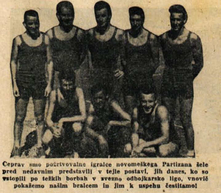
Čeprav smo poizkuševali igralske novomeške Partizana šele pred nedavnim predstavili v tej postavi, jih danes, ko so vstopili po težkih borbah v zvezno odbojgarsko ligo, vnovič pokažemo našim bralcem in jim k uspehu čestitamo!

Ob koncu tega tekmovanja se morajo in upravni odbor zahvaliti feta za podporo in razumevanje vsem onim, ki so kakorkoli prispevali in pomagali, da je prišlo do tekmovanja. J. V.