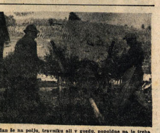
Cez dan še na polju, travniku ali v gozdu, popoldne pa je treba nažgati drv, da bo okoli peč prijetno...

je takoj treba priti. Tako otroci šele zvečer pridejo do učerja, pa še tedaj likajo, prebirajo krompir, tlačijo zelje in podobno.