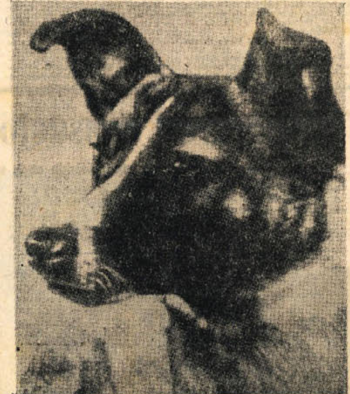
Psička Lajka neposredno pred poletom v vesolje

Vendar se je človek doslej dvignil visoko že 30 tisoč metrov. Problem te višine za človeka je tehnika rešila s posebnim kabino, v kateri so isti pogoji kakor na Zemlji. V višinah vlada izreden mraz, nad zemeljskim ozračjem pa visoka temperatura. Toda tehnikom bo nedvomno uspelo zgraditi kabine, ki bodo potnike