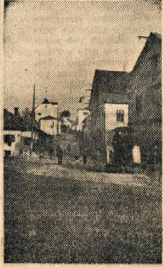
Polovico Partizanske ceste v Novem mestu so medtem že tlakovali, za ostanek pa potrebujejo še nekaj lepega vremena

UREJUJE uredniški odbor — Odgovorni urednik Tone Gošnik — NASLOV UREDNISTVA IN UPRAVE: Novo mesto, Cesta komandanta Staneta 30 — Poštni predal Novo mesto 33 — TELEFON uredništva in uprave št. 127 — Rokopisov ne vračamo — TISKA Časopisno podjetje »Slovenski poročevalec« v Ljubljani