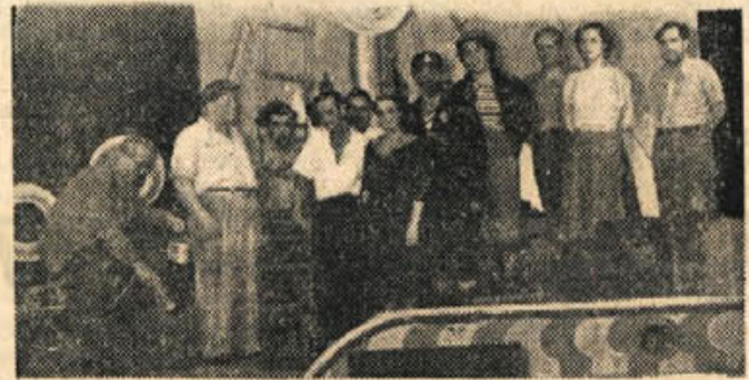
Igralci in sodelavci O'Neillove drame »Anna Christie«, s katero bo novomeško gledališče v kratkem gostovalo v Ljubljani. — Režija prof. Tone Trdan.

Posebni voz, napolnjen z blagom in predmeti iz velikih trgovskih magazinov, vozi sedaj skozi vso Litvunijo (v Sovjetski zvezi). Namen te trgovine v vagonu je, da bi se uslužbenci na majhnih postajah in kmetje lahko oskrbeli z istim blagom, živili in predmeti, kakor prebivalci velikih mest.