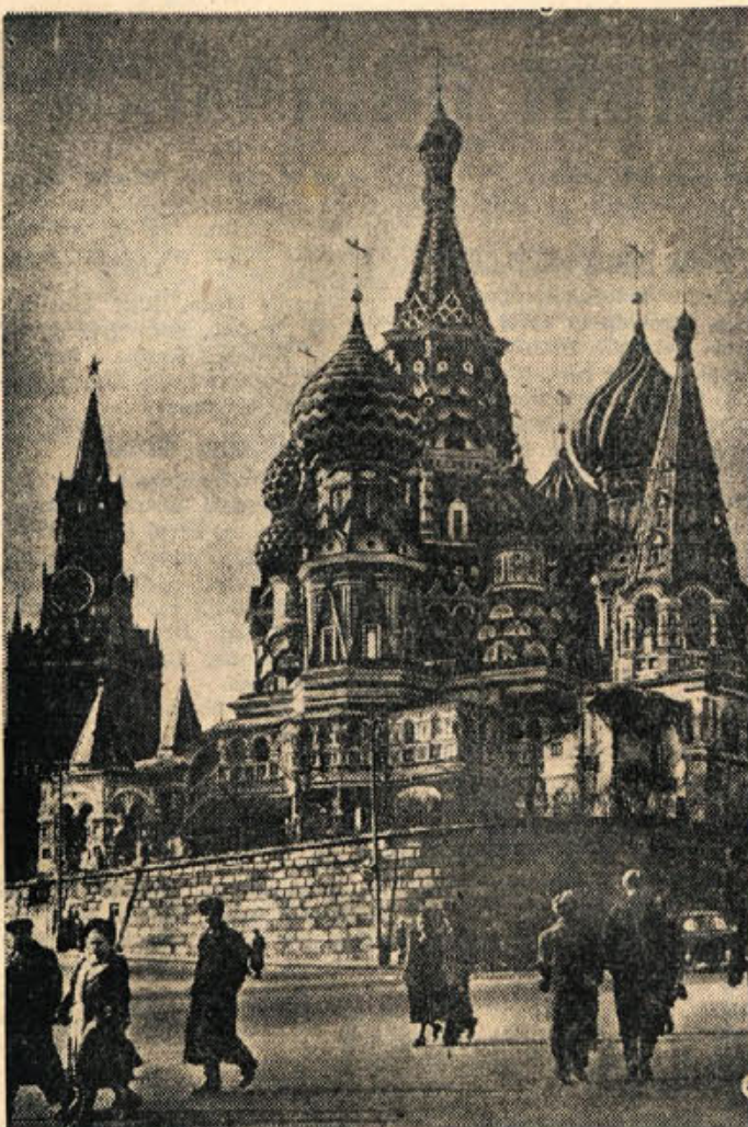
Ena izmed številnih arhitekturnih znamenitosti Moskve; katedrala Vasilija Blaženega, zgrajena v 16. stoletju.