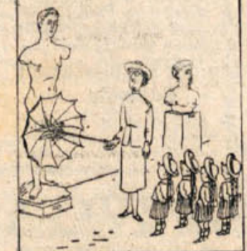
Budna skrb parjavle device.

»No, dva, tri dni je delal vsega skupaj.«