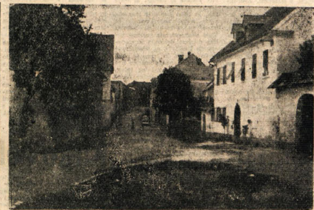
STARI TRG ob Kolpi je po razdelitvi okraja Kočevje in občine Predgrad prišel v sestav občine Predgrad skupno s še trinajstimi vasi in te doline. Poslej bo v Starem trgu krajevni urad občine Crnomelj. V Starem trgu je tudi pošta in dokaj močna kmetijska zadruga.

enot tudi oddelki Protiletalske zaščite ter okoli 20 gasilskih vozil z opremo, pred temi pa kolesarji in motoristi. V mimohodu je sodelovalo več kot tisoč pripadnikov navedenih organizacij. Neizključni hudi pripreki se je mimohod razvil brezhibno in je pokazal vzorno disciplino in strumnost nastopajočih. Pri popoldanskem nastopu so želi največ priznanja pionirji, ki so vse vaje izvedli res lepo in pokazali veliko spretnost. Tudi odrasli so izvedli vaje s sekirami, kar dobro, vendar ne tako brezhibno kot pionirji. Nastop nad 300 pionirjev je pokazal, da gasilske organizacije posevajo veliko pažnjo naraščanju, kar je še posebno pomembno, kaj je pohvalno to, da je v gasilskih vrstah vedno več žensk. Tudi ženske enote so pri nastopu in v mimohodu pokazale vzorno disciplino in izurjenost. Za zaključek so gasilci iz Crnomlja, Smihela pri Novem mestu in iz Novega mesta izvedli kombinirano moko vajo na stavbo Elektro podjetja. Bila je res lepa manifestacija našega gasilstva. Pri celotni proslavi so poleg godbe na pihalu iz Zidanega mosta sodelovale še godbe iz Metlike, Trebnjega in Novega mesta.