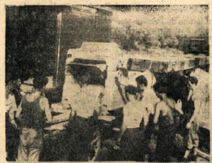
Veseli nakladajo mirnopedski mizarji iz vagona na voz nov mizarski stroj, ki so ga kupili za povečanje proizvodnje v podjetju.

Kakor Kočevski zbor odposlancev slovenskega naroda, se mi zdi ta kongres. Oni je bil pred 14 leti. Vojna je bila takrat. Za vrat so nas tlačali, roke in noge so nam skušali zvezati. Skoro ves svet je bil na kolenuh. Mi, majhen narod, pa smo kakor v posmeh vsemu, med bojem na življenje in smrt imeli volitve delegatov in imeli Kočevski zbor. Majhen narod, brez vsakih državotvornih izkušenj, toda kljub temu smo uspeli.