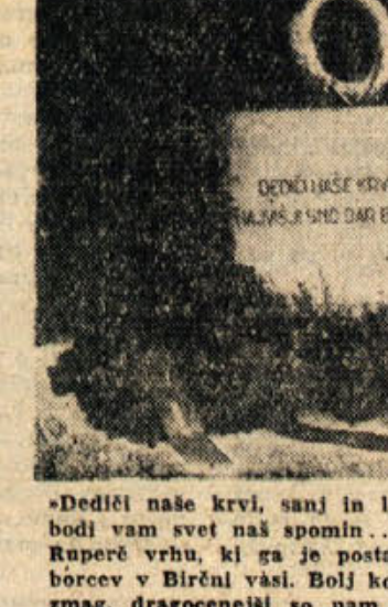
Dediščina naše krvi, sanj in ljubezni — dali najvišji smo dar, bodi vam svet naš spomin... govore besede s spomenika na Ruperč vrhu, ki ga je postavila krajevna organizacija Zveze borcev v Birtaln vasi. Bolj ko se odmakajo od nas leta borb in smag, dragocenejši so nam žilniti sadovi iz let revolucije.