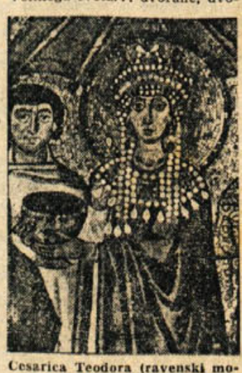
Cesarica Teodora (ravenski mozaiki)

mor ali čudovite pozlačene stukature. Bogastvo, bogastvo! In potem si ogledujemo Dvorana štirih vrat, Dvorana senata, Dvorana glasovanja, Dvorana Sveta dvanajstih, Dvorana Velikega sveta... dvorane, dvo-