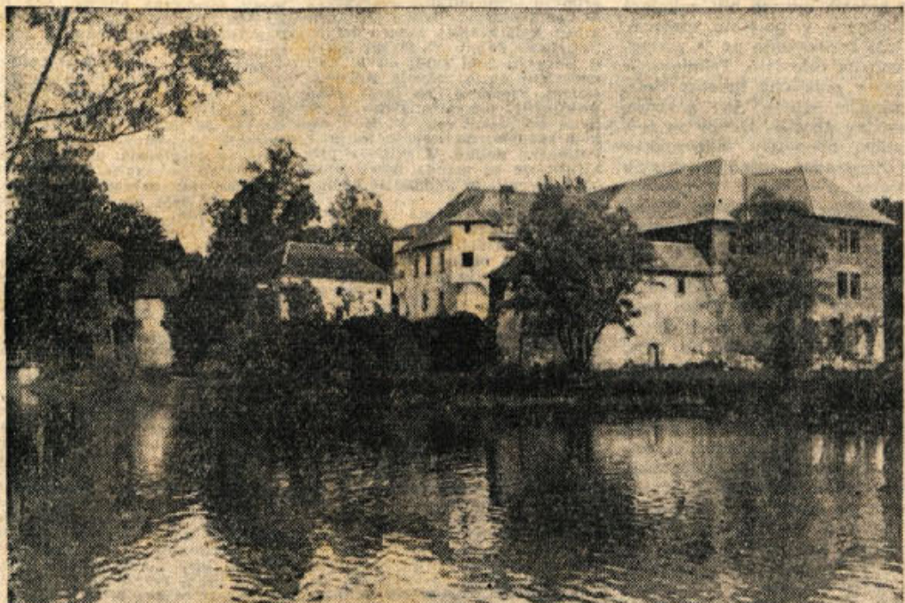
V neposredni bližini gradu na Otočcu bo tekla avtocesta Ljubljana-Zagreb-Beograd, le nekaj metrov od mostu z levega brega Krke na otok na modernizirano okrajna cesta Novo mesto-Smednik. Obnovljeni Otočec, biser Dolenjske, bo tako pristopen z vseh strani, zlasti še, ker je povezan tudi že z desnim bregom reke in z gozdom potjo skozi Struški boršč in sedanjo zvezno cesto Ljubljana-Zagreb. Zato spremljamo obnovo dela na Otočcu z razumljivo nestrpnostjo, saj si obojemo od povečanega tujkega prometa v dolini Krke lep narodni dohodek. — Na sliki: pogled na obnovljeno zapadno stran gradu

Urejuje uredniški odbor. — Odgovorni urednik Tone Gošnik. Naslov uredništva in uprave: Novo mesto, Cesta komandanta Staneta 30. Pošt. pred. Novo mesto 33. Telefon uredništva in uprave: št. 127. Rokopisov ne vračamo. Tiska Ciaspizsko-založniško podjetje »Slov. poročevalec« v Ljubljani. Za tisk odgovarja F. Tvečel