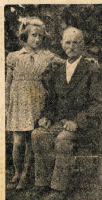
Vsi vaščani mu ob lepem življenjskem prazniku čestitamo in mu želimo še veliko zdravih in zadovoljnih dni. S. S.

ko in dogodke v svetu. Ker mu je v zadnjih letih opešal vid, da nese more več brati, rad zahaja k sosedu poslušati radijske vesti.