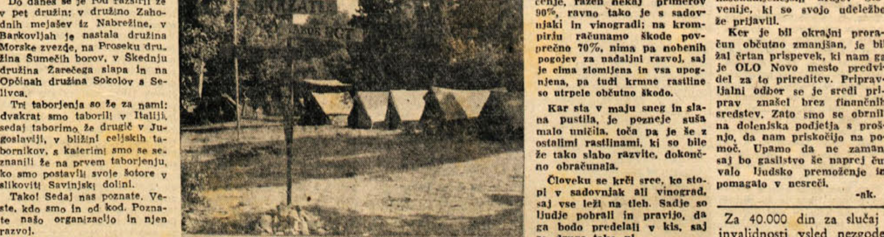
Pogled na del tabora »Skržatova« — članov Rodu gorjanskih tabornikov v Rabeu pri Labinu; taborili so sredi hrastov, cipres in lip neka minuto oddaljeni od morja. Včera zvečer se je vrnila z morja prva skupina 90 tabornikov, danes pa so tam začeli taboriti novomeški učiteljski in člani taborniških družin Črnomlja, Sentjerneja in Straže-Toplice.

V ponedeljek 15. avgusta so se je bilo po dele kipe, tudi za 20 cm na debelo. Se naslednji dan je ležala po vaseh in travnikih. Škoda je občutna posebno v okolici vasi Vrh in Gor. Brezovica, kjer je najbolj padala, padala pa je po vsej katastralni občini Sentjerne in tudi v sosednjih katastrálnih občinah. Občinska komisija je ocenila škodo takole: V katastralni občini Sentjerne: koruza, proso oves in lan 100% uničenje, razen nekaj primerov 90%, ravno tako je s sadovnjaki in vinogradi; na krompirju računamo škode povprečno 70%, nima pa nobenih pogojev za nadaljni razvoj, saj je elma zlomljena in vsa upognjena, pa tudi krmne rastline so utrpel občutno škodo. Kar sta v maju sneg in slana pustila, je pozneje suša malo uničila, toča pa je še z ostalimi rastlinami, ki so bile že tako slabo razvite, dokončno obravnala. Človeku se krči srce, ko stopi v sadovnjak ali vinograd, saj vse leži na tleh. Sadje so ljudje pobrali in pravijo, da ga bodo predelali v kis, saj za drugo tako ni. Kmetovalci, ki so resno oškodovani, se sprašujejo, če bo uprava za dohodke upoštevala škodo pri odmeri letne dohodnine. Jože Jakič