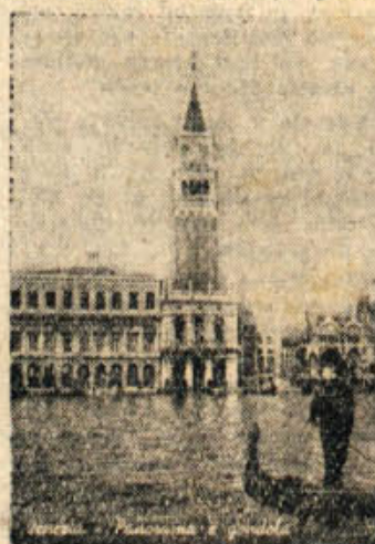
Fedoba iz Benetk

»Tri ure sploh nisem prišli nikamor. Po svetilniku sem to videl,« pravi nekdo med nami. »Na mestu nas je premetavalo. Kajpak: sto deset konjskih sil Ventilator naj nataknejo drugič namesto vjakaj!« »Nov, močnejši motor bomo dobili. Je že naročen,« pravi