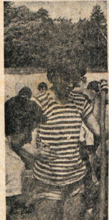
Zapisljena? Morda za hip ali dva sredi dela; čez nekaj let bo učiteljica, pa bo pripravovala otrokom, kako je pomagala v mladinski brigadi graditi domovini njen lepši obraz...

Cprav mu voda je ko kruh, jo revež žejni večno strada; naj sije sonce, dež naj pada; slov po tem, da zmer je suhi