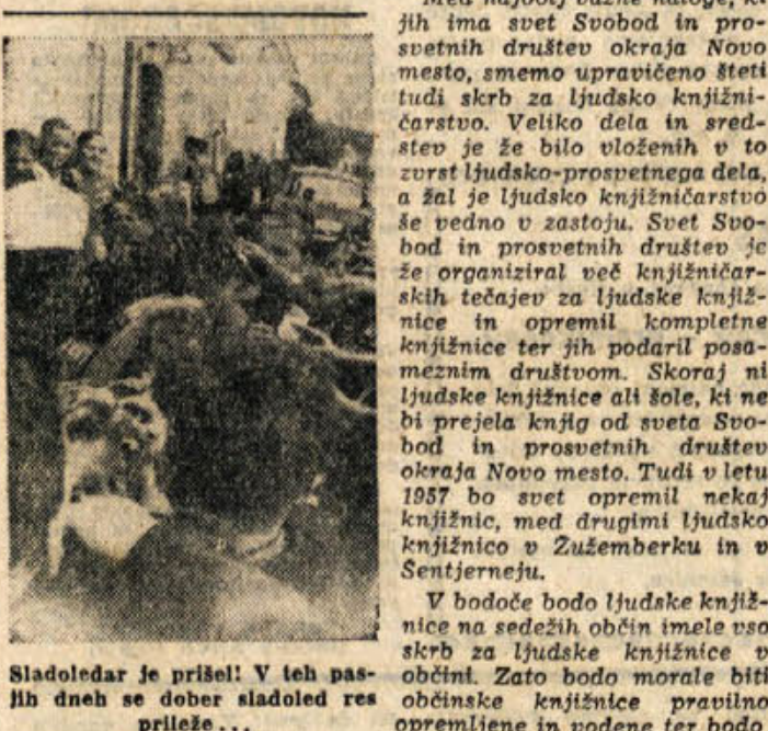
Sladoledar je prišel! V tet pasih dneh se dober sladoled res pričeže...

Štiri osebe živijo v tet naneti, vzbudilivi drami: Joe Saul in njegova žena Mordeen, Saulov prijatelj Ed in še mladi Victor, izredno ljubezen družji Saula in Mordeen, dolgo sta že poročena, toda otroka ni. Saul, poln starih predsodkov o krvi in nasiljevanju svojega življenja in rodu v sinu, kopri samo po otroku. Otroka pa ni, ker je Saul jalov. Mordeen sprevidi, da bo njuna ljubezen in sploh njuno življenje težko je, če možu daruje otroka. In tukaj se v drami začne pretresljiv zaplet. Samo iz ljubezni do moža, da ga osreči z otrokom, se vda mlademu Victorju, polnem življenjskih sil in brezobzirnosti, seljskega izživljanja. Vda se mu s studom, da bi moža osrečila z otrokom in rešila njuno ljubezen.