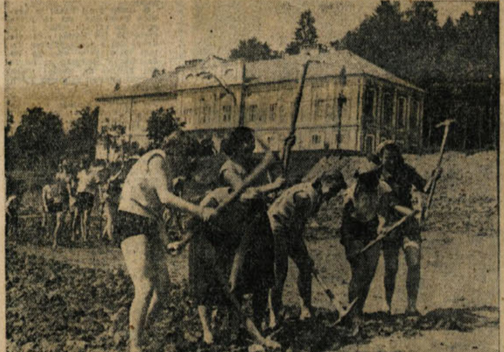
Dekleta v I. MDB Majde Šile v Ljubljani prav nič ne zaostajajo za fanti, nekatere jih v pridnosti in vztrajnosti celo prekašajo. — V ozadju Cekinov grad, v katerem je Muzej NOB.