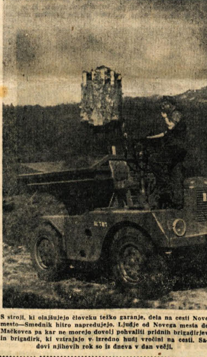
S stroji, ki olajšujejo človeku težko garanje, dela na cesti Novo mesto—Smednik hitro napredujejo. Ljudje od Novca mesta do Mačkoveca pa kar ne morejo dovolj pohvaliti pridnih brigadirjev in brigadirki, ki vrajajo v izredno hudi vročini na cesti. Sa- dovi njihovih rok so iz dneva v dan večji.

temeljni zakon o zakonski zvezi; ki nastanejo pred za- konsko zvezo, med njo in po nji. Vsakdanje življenje kaže na veliko krutost, ki je izražena v vedno bolj in bolj osamljene- mu načelu in ga zagovarjajo ne- katere veroizpovedi, da se mo- re zakonska zveza razvezati le s smrtjo enega zakonca. To nač- elo, ki je veljalo tudi v naših deželah vse do uveljavitve pri- dobitvev NOB, je marsikateremu zakoncu grenilo življenje in več- krat vedlo celo do samolastnih usodnih posegov. Vendar pa ima tudi sociali- stična družba velik interes za trdnost zakonske zveze, saj je ta najboljši porok za dobro družino, s tem pa tudi za dobro družbo. Zato dopuščajo zakoniti predpisi razvezo zakonske zveze le iz določčenih razlogov in to: 1) čl. 56: če je zaradi nesklad- nosti narav, trajnega nespora- zuma, nepremagljivega sovra- štva ali iz drugih vzrokov za- konsko razmerje toliko omanjano, da je skupno življenje nezno- so. 2) čl. 57: zakonca sme zahte- vati razvezo zaradi preštevila drugega zakonca; pravic tožbe pa ugasne po preteku enega le- ta. Ko je zakonca zvedel za pre- število, Naš zakon torej močatno obsoja konkubnat, izvenzakon- sko spolno življenje ter lahko- miseln odnos do zakonske zve- ze. Ta razlog je v praksi zelo