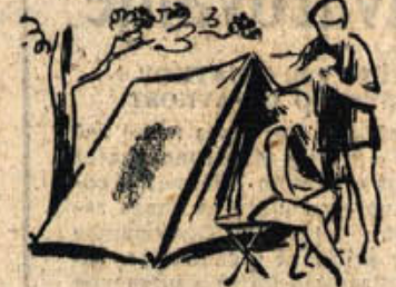
Počitnice blizu Dunaja pa bo odšlo 35 naših otrok. Na raznih taborih in kolonijah bo letos kakih 1000 do-

odpotovalo v mladinske zabavišnice v Sekiro ob Vrškem jezuru 37 dolenjskih otrok, na