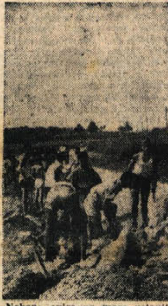
Nobena ovira ne more ustaviti navdušenih mladincev — kjer odpove orodje, sgrabijo pridne roke

Četrtega julija je CK KPJ z razglasom pozval ljudstvo na oborožen boj za splošno ljudsko vstajo. Bojni klic naše Partije na vstajo, k orožju, je bil odločen in neomahljiv bojni klic z vero v zmago, toda tudi z globoko zavestjo o stinih težavah, ki so čakale v tej borbi tako našo Partijo, kakor naše ljudstvo. Borba za osvoboditev države je bila zaključena z zmago. Ustanovljena je bila ljudska oblast. Po vojni smo se spopadli z gospodarsko nerazvijenostjo naše države in dosegli v teh kratkih letih pomemben razvoj. Ob dnevu borca lahko z zadovoljstvom ugovarjamo, da smo dosegli storili vse, kar je bilo v naši moči. Zmage v preteklih šestnajstih letih nas navdajajo z radostnim upanjem, da bo take uspehe tudi naša prihodnost in naša prizadevanja za srečo in boljše življenje naših narodov.