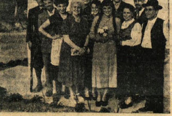
Igralska družina FD Boris Kidrič iz Stoplje po predstavi Bellh vrtnice

26. junija je bilo sslavnostno proslavo zaključeno šolsko leto. Obrokom vrca, osnovne šole in nižje gimnazije je govornica ravnateljica Tončka Škerietova in med drugim povedala, da se je uspeh na gimnaziji dvignil, na osnovni šoli pa malo poslabal. Hudo je, ker morajo mnogi učenci zaradi domačega dela za-