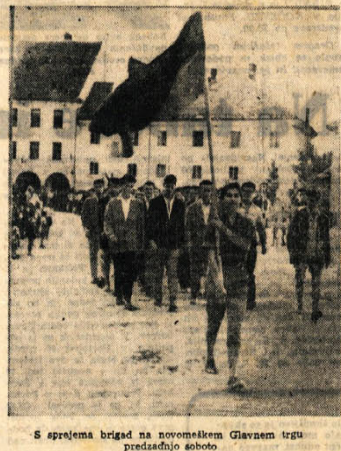
S sprejema brigad na novomeškem Glavnem trgu predzadnjo soboto

V Novem mestu je bila še izboljšana služba specialistov za razne bolezni. Lani je bilo specialističnih pregledov: okulističnih 1109, dermatoloških 765, nevroloških 357, otorinolaringoloških 378, pediatričnih 2650 in kožno-veneričnih 949. Zobnih storitev je bilo lani 7772, v letu 1955 pa 7056. Oskrbnih dni v bolnišnicah pa je bilo lani nekaj manj — 56.942, leta 1955 jih je bilo 57.631. V novomeških bolnišnicah se je leta 1955 zdravilo 3195 zavarovanih oseb, za katere je bilo za 31.651 oskrbnih dni 30.470.820 dinarjev stroškov. Lani se je zdravilo 526 zavarovancev manj, bilo pa je 1099 oskrbnih dni več kakor v l. 1955. Stroški zdravljenja so narasli kar za dobrih 11 milijonov dinarjev. Povprečna cena oskrbnega dneva v novomeških bolnišnicah je bila predlanskim 962 din, lani pa 1268 din. Splošna povprečna cena v vseh bolnišnicah je bila 1955, leta 1955 din, lani pa 1234 din. Lekarniški stroški: Pri pisanju receptov lani ravno nismo varčevali, saj je bilo izdanih kar 20.559 receptov več kot v letu 1955 (leta 1955 — 75.661 receptov, lani — 96.220 receptov). Res je, da so prej zdravniki pisali več zdravil na enem receptu, lani pa so to nekateri opuščali.