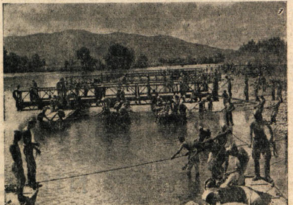
Gojenec vojaško-tehnične akademije pri praktičnem delu: čez reko gradijo most. V nekaj urah mora biti gotov, napredujoče enote ne smejo čakati. — Več berite o gojencih naših vojaških šol in akademij na 6. strani današnje številke.

Zadnja leta smo se nekako odvadili tarnati, češ da smo »najrevnejši, najbolj pasivni, najbolj zaostali« in podobno. Kmetijska pospeševalna služba je z družbenimi sredstvi dokazala na mnogih zelo uspešnih poskusih, da je možno iz revščine in dosežani nezavistnosti Dolenjske v tem, da se poprimemo najsodobnejših pripomočkov in dvignemo naše pridelke. Doseženih uspehov se nam ni treba skramovati, saj smo tudi v našem okraju pridelali po 33.000 kg krompirja na ha, medtem ko je okrajno povprečje 11.000 kg. Pri žitu imamo pridelok tudi a 3.500 kg namesto 1.100 kg; tudi v žitovinarji smo dosegli moznost od 4.000 do 5.200 litrov mleka (Nadaljevanje na 3. strani)