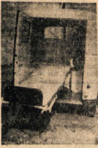
Pogled v notranjost sanitetnega avtomobila