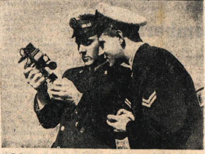
Gojenca vojne pomorske akademije pri praktičnem delu s sekstanom