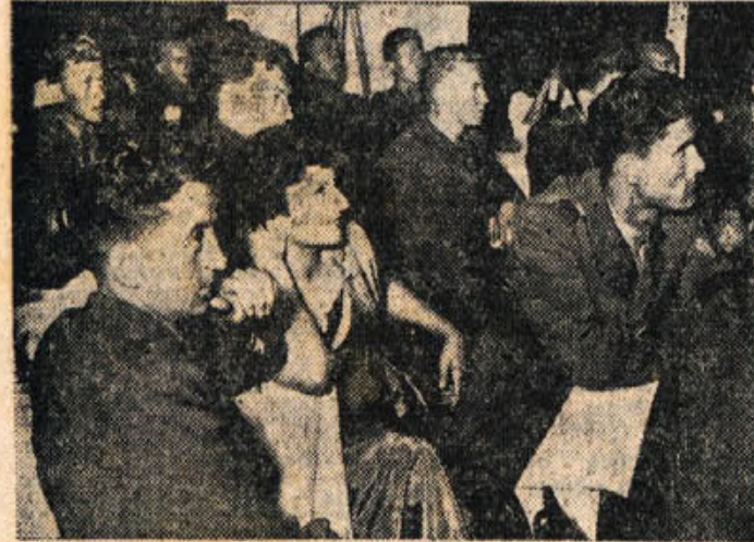
Gojenci vojne akademije so povabili goste v Dom JLA

Zadnji dnevi šolskega leta se stečajo h kraju in marsikateri mladinec sam ali s starši vred pomislija, kam bi usmeril svoje življenje — kakšnega poklica naj bi se lotil. Izobra je kaj raznovrstna in pestra. Na široko so odprta vrata v bodočnost; kruha in dela mlademu človeku v naši domovini ne manjka. Ob izbiranju poklica ne bi smeli prezreti važne, častne in privlačne dolžnosti, ki jo mlademu človeku povzročajo Jugoslovanska ljudska armada. Postati oficir naše ljudske armade je v resnici velika čast. Srednješolcem je Državni sekretariat za narodno obrambo tudi letos omogočil vstop v vojaške akademije in šole JLA, kjer lahko naši mladenci najdejo bediši v pehoti,