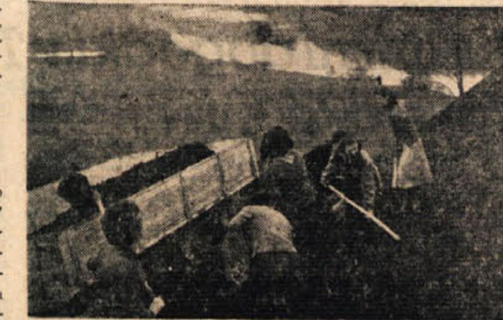
Dekleta v delovni četi pomagajo na stadionu onkraj Krke

Bršljin v Črnomlju Delavska prosvetna društvo »Svoboda« iz Bršljina priredi v soboto 20. aprila ob 20. uri koncert ženskega in moškega pevskega zbora v Črnomlju. Koncert bo v dvorani kulturnega doma. Med odmeri bo igral tamburaški orkester »Svobode«.