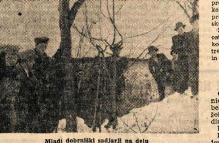
Mladi dobrniški sadjarji na delu

nam, ločeno z jablanami, bruskami in slivami. Podobna obnova se bo še nadaljevala, ker nameravajo izkoristiti vse še nezasajene kmetijske površine s sadnimi vrstami, po predhodni proučitvi strokovne komisije, v kolikor ne bodo ta zemljišča še primerna tudi za druge kmetijske kulture.