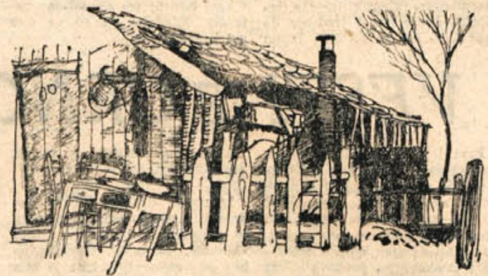
Bogdan Borčič: ILUSTRACIJA

Za alkoholne pijače v gostinstvu smo lani izdali povprečno 2.024 din na prebivalca, za brezalkoholne le 197 din na prebivalca, za hrano pa povprečno 1.072 na prebivalca. Se pravi, da je glavni izdelek za storitve gostinstva še vedno alkohol. Razne veselice, vinotoči, zidanih in drugi prostori, kjer ga cukamo v počastitev tega ali onega, za boljše voljo, za večjo korajžo, za utapljanje ljud. bezenskih, družinskih, pravdarskih, davčnih, taksarskih, bolezenskih, prebavnih in drugih tegob, nam poberejo mimo tega še prenekateri tisočak in delovno uro.