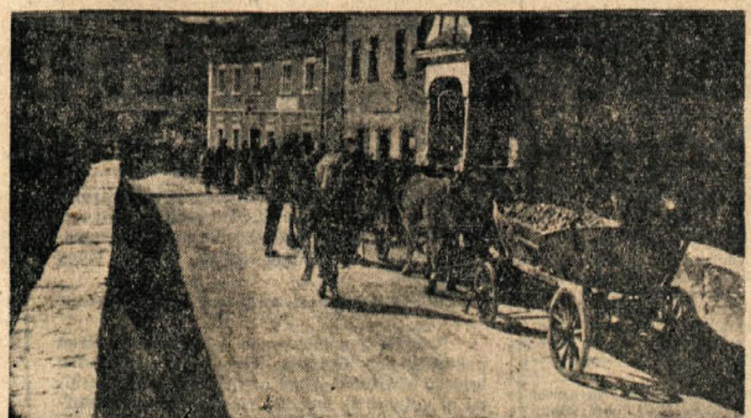
Čeprav je že pomlad, priroma iz te in one kleti še vedno kak voz lanskega krompirja. Naš fotoreporter je na Mirni pred kratkim »ujel« dolgo vrsto kakih 25 voz. Kmetijska zadruga je plačevala krompir od 11 do 13 dinarjev. Kdor je lani škilil na spomladansko višjo ceno inč istrjskega krompirja, ni prišel na račun. V jeseni bi ga lahko bolje prodal...

Semičani se že pripravljajo na proslavo 27. aprila in 1. maja. Na predvečer bodo po vaseh zagoreli kresovi. Osrednja proslava bo v Semiču. Mladi bodo postavljeni, 1. maja bo pa organiziran izlet na Mirno goro. P. M.