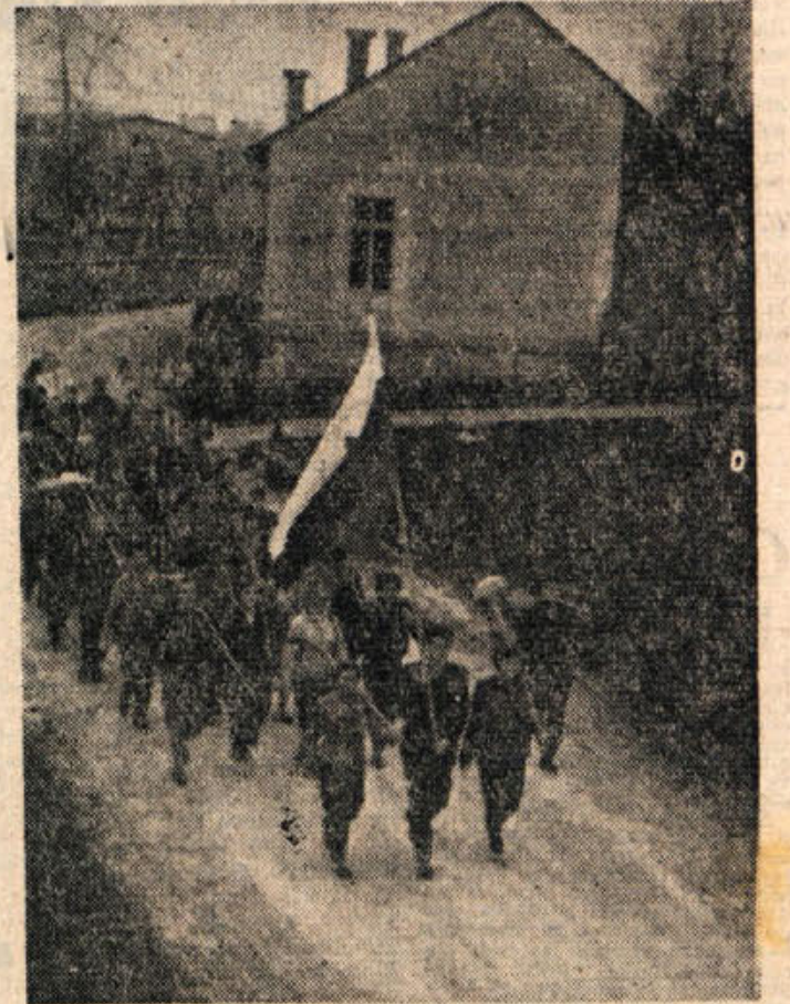
Delo — ponos človeka! Mladina ne zaostaja; kjer je treba priti, tam pomaga in gradi domovino. — Na sliki: mladinska delovna četa novomeških dijakov koraka na nogometno igrišče na Loli