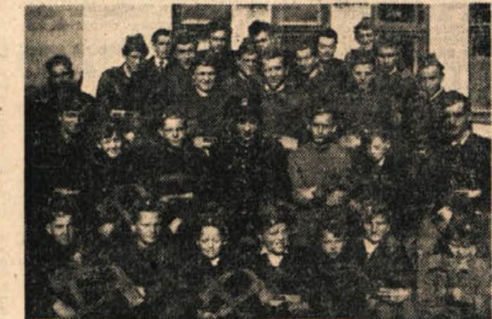
Midinci in pionirji — gasilci v Otočcu

udeležencev. Razen v množičnem tečajevnem nastopu bodo predstavniki našega okraja nastopili v obliki (moška in ženska vrsta Partizana Novo mesto) v malem rokometu (moška in ženska vrsta Črnomelj) in v košarki (moška vrsta Partizana Novo mesto). Prav tako pa bodo sodelovali tudi nekateri atleti, moška vrsta orodnih telovadcev (Partizan Novo mesto) in vrsti novomeškega društva v akademskih sestavih. Prav tako je predvideno, da bo na akademiji v Bihaču nastopila tudi folklorna skupina in zabavni sekstet Studentskega kluba okraja Novo mesto s slovenskimi narodnimi pesmi in priljubljenimi polkami. Računamo, da bo šlo v Bihač preko 500 udeležencev, saj bodo sodelovali tudi motoristi Avtomoto društva, taborniki, ki bodo pomagali pri urejanju taborišča in številnih tehnični aparat. Ljudska tehnika bo pripravila ozvočenje in razsvetljavo taborišča. JLA pa bo po vsej verjetnosti oskrbela prevoz s kamioni in prehrano v taborišču. Pripravljeni odbor je že zagotovil pomoč SZDL in ostalih organizacij ter JLA, ker zlet ne bo samo telesnovzgojnega značaja, ampak bo imel tudi velik političen namen. O podrobnostih bomo še poročali. F. M.