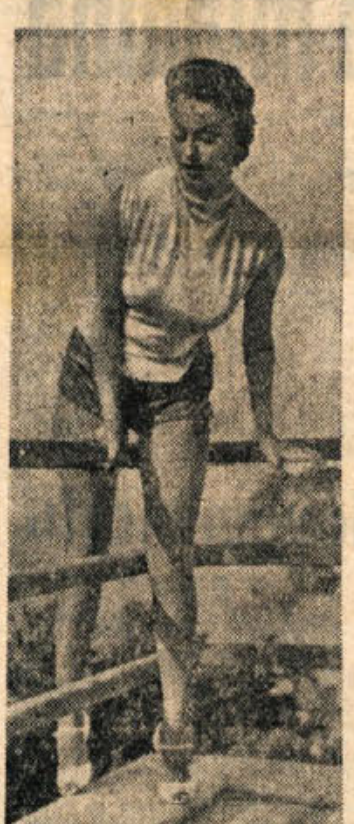
Sophia Loren se rada ukvarja tudi s telovadbo. Na sliki jo vidimo med odmorom v času snemanja filma »Kruh, ljubezen in...«, ko telovadi na balkonu hotela, kjer je nastanjena vsa filmska ekipa

V nekem kraju blizu New Delhija se je pred kratkim zgodil primer, redek dandanes tudi v najbolj zgoščenih krajih