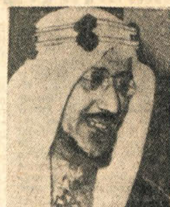
Arabski kralj Ibn Saud

Januarja letos je obiskal ZDA kralj Saudske Arabije. Tudi drugače se njegovo ime večkrat pojavlja v javnosti, saj je vrhovni zakonodajni in izvršni organ države, ki je osmerkrat večja od Jugoslavije, ima pa le nekaj nad šest in pol milijona prebivalcev. V njegovi deželi je znana mohamedanska božja pot Meke, v zemlji te države pa je obilo nafte, ki zanima svetovne gospodarstvenike, državnike in politike. Ker je Saud gospodar te nafte, ima v svetovni politiki pomembno besedo. Ameriške petrolejske družbe, ki imajo pravico črpati nafto na ozemlju te dežele, ustvarjajo pri tem ogromne dobičke, kralj pa dobi-