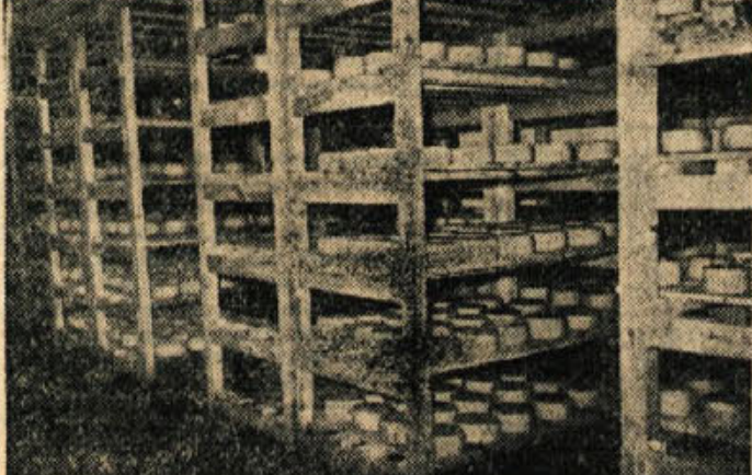
Pogled v zoriino klet in polno police novomeške Mlekarne. V začetku je kazalo, da bo sira preveč, zdaj pa ga trg zahteva toliko, da komaj sproti ustrezno vsem, ki bi radi provrstino blago

Statistični urad Zpadne Nemčije je objavil številke prometnih nesreč leta 1956. Promet je lani na področju Zpadne Nemčije povzročil 12.654 smrtnih nesreč, navzile najdomnejšim ukreptom, zaščiti, kaznovanju itd. Ranjeno pa je bilo 361.143 oseb.