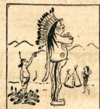
»Ljubezen, zvestoba, sovrastvo, ljubezen, zvestoba...«

»Ti, ali nima oštrv Glažek precej vodeno vino?« »To ti bo povedal najbolje Pepe. Hodil je k njemu pit in sedaj si mora zdraviti revmatizem.«