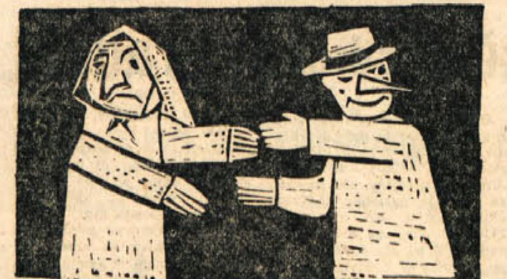
Zdenka Golob-Borčić: ROČNE LUTKE (linorez)