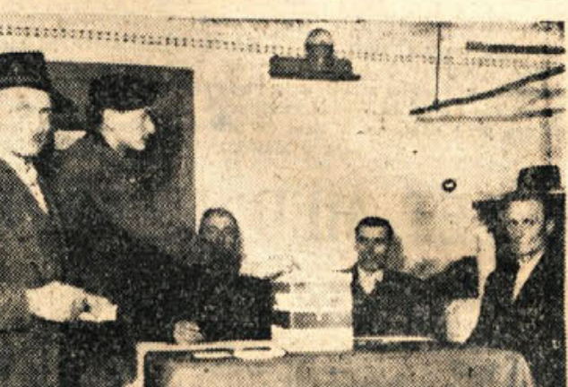
Takole so volili v nedeljo, 24. februarja v Grčvrhu pri Mirni peč nov vaški odbor SZDL

okolice je bil med NOB zatočišče mnogih borec in aktivistov, njegov dom je bil vedno na stežaj odprt vsem, ki so bili potrebni pomoči. Mnoge enote, ranjenci, bolniki in odgovorni