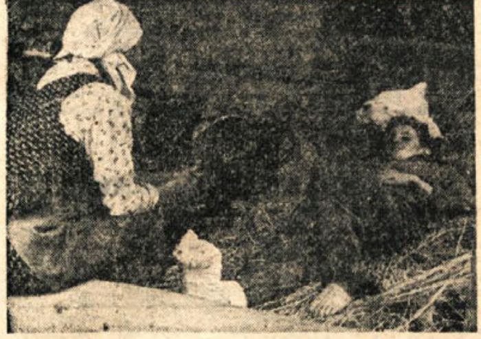
Se pomni, tovariš, tople besede sočutja naših mater, ki niso pozabile ranjencev in bolnikov v vseh letih NOB? Spomini se jih danes s hvaležnim srcem, saj so bile zares naše mame, vedno pripravljene preiti za svobodo tudi svoje krvi! — Na sliki: obisk ranjenca pred odhodom v Bari (iz arhiva Belokranjskega muzeja v Metliki).