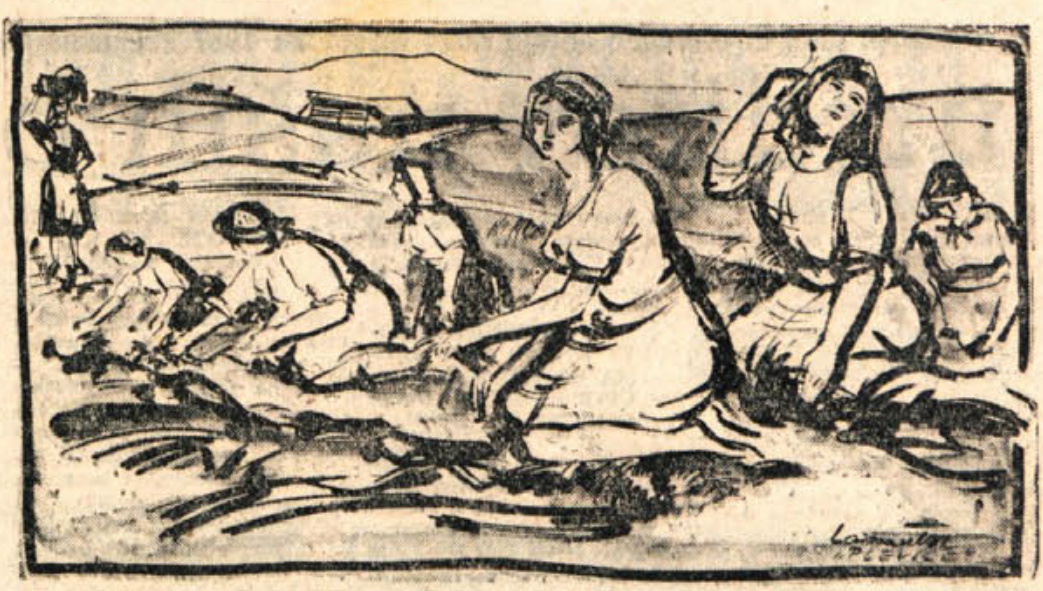
VLADO LAMUT: PLEVICE