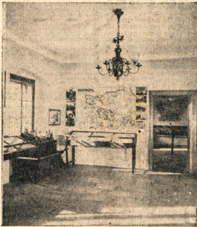
Pogled v oddelek NOB v Dolenjskem muzeju v Novem mestu

Opozorilo: »Najstarejša zgodovina Dolenjske« stane v predprodaji 200 din, knjižniška cena bo 240. Naročite jo v Dolenjskem muzeju (Novo mesto), v Belokranjskem (Metliki) in Posavskem muzeju (Brežice).