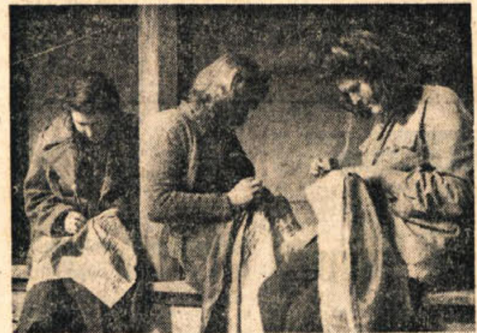
V ČRNOMLJU LETA 1944: DEKLETA ŠIVAJO ZASTAVE ZA NAŠE BRIGADE